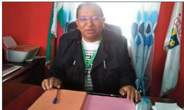
Ny ben'ny tanànan'ny kaominina Sabotsy Namehana Avaradrano, Andriamosa Avotrianiaina.

-AA : mandroso ny fanabeazana ato Sabotsy Namehana, be ny foto-drafitrasa vita, ankoatra izany efa misy hatramin'ny Oniversite tsy miankina ato anivon'ny kaominina, eo koa ireo toeram-pianarana miankina amin'ny fanjakana maro. Eo amin'