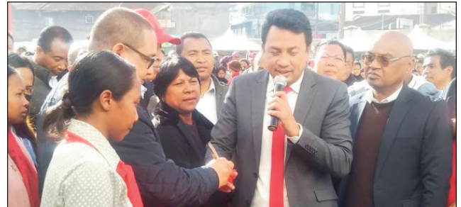
Ny fanokafana ny fampirantiana tetsy amin'ny Magro Behoririka.