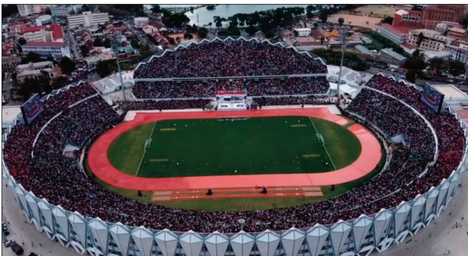
Ny kianjaben'i Mahamasina nandray hetsika ara-pilazantsara.

Tsy nahazo an'i Mahamasina, fa etsy amin'ny kianja "Elgeco Plus Stadium By-Pass" no hanatanterahana ny lalao famaranana baolina kitra « Telma Coupe de Madagascar 2022 » hifanandrinan'ny ekipan'ny Elgeco Plus Fc Analamanga, sy ny ekipan'ny Fosa Juniors Fc Boeny amin'ny alahady 03 jolay 2022 ho avy izao hanomboka amin'ny 2 ora tolakandro.