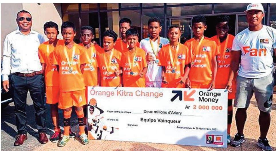
Elgeco Plus U13.

Nanomboka omaly zoma 01 jolay 2022, ka haharitra hatramin'ny 04 jolay 2022 any Casablanca Maroc ny fifaninanana baolina kitra « Tournoi Orange Sponsors Change » izay lalao iraisam-pirenena hifaninan'ireo ekipa afrikanina sokajy U13 avy amin'ny firenena miisa 10 misy ny Orange (Burkina Faso, Cameroun, Côte d'Ivoire, Libéria, Madagascar, Mali, Maroc, République, Sénégal ary i Sierra Leone). Mazava loatra fa ny Orange no mikarakara ny hetsika mba hahafahan'ireo katitakely miaina tanteraka ny fitiavan'izy ireo baolina kitra aty Afrika.