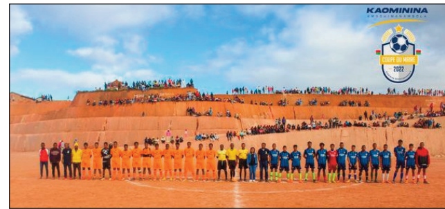
Ny lalao fiadiana ny Coupe du Maire 2022 teny Ambohimambola.