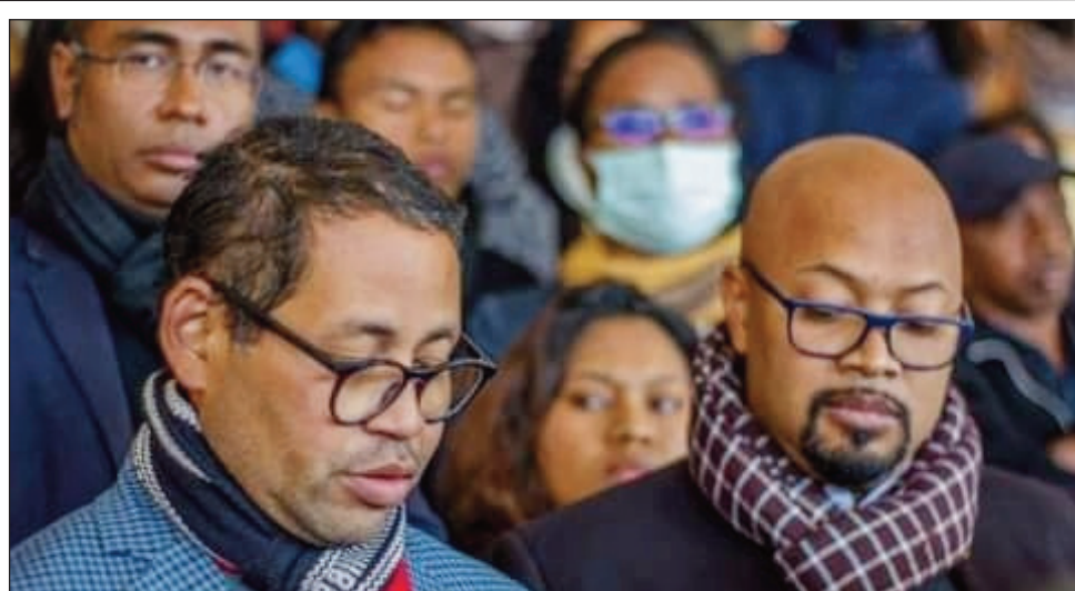
Ireo avy amin'ny sendikan'ny mpiasa ao anivon'ny ministeran'ny raharaham-bahiny.

Ny « fihonana in-telo miantona » izay nolazainy fa nisy dia tsy nataony velively hamahana