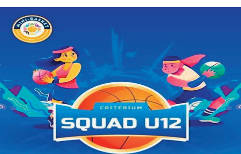
Criterium National U12.

Hanomboka anio sabotsy 02 jolay y2022 eny amin'ny kianja "Terrain universitaire Ankatso " ka tsy hifarana raha tsy amin'ny alahady 10 jolay 2022 ho avy izao ny hetsika Fihaonamben'ny Basketry hoan'ny ankizy latsaky ny 12 taona na ny "Criterium National U12 Filles & Garçons 2022".