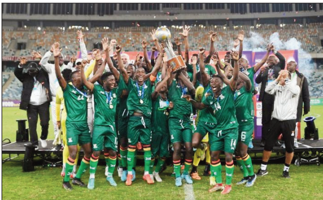
I Zambia tompondaka ny Cosafa Cup 2022.

Nifarana tamin'ny alahady 17 jolay 2022 teo, ny fifaninana baolina kitra « Cosafa Cup 2022 », notontosaina tatsy Afrika Atsimo, ka i Zambia no voahosotra ho tompondaka, rehefa nandresy an'i Namibie 1-0 teo amin'ny lalao famaranana.