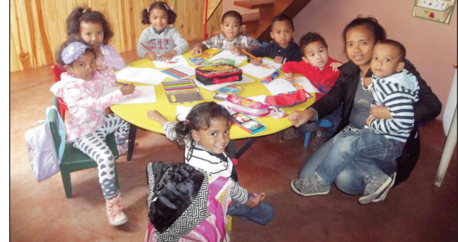
Sekoly Clever Child Ampefiloha.