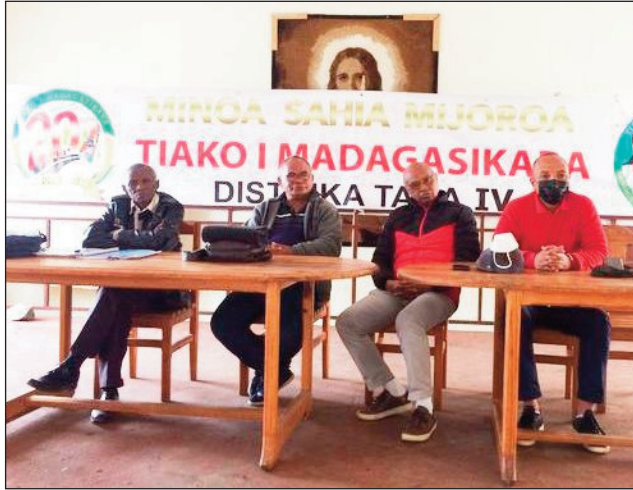
Ny fifidianana ireo ho mpikambana vaovao ao amin'ny DISTIM Boriboritany faha-4.