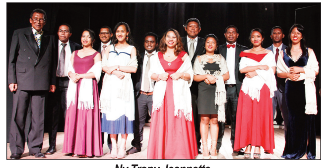
Ny Tropy Jeannette.