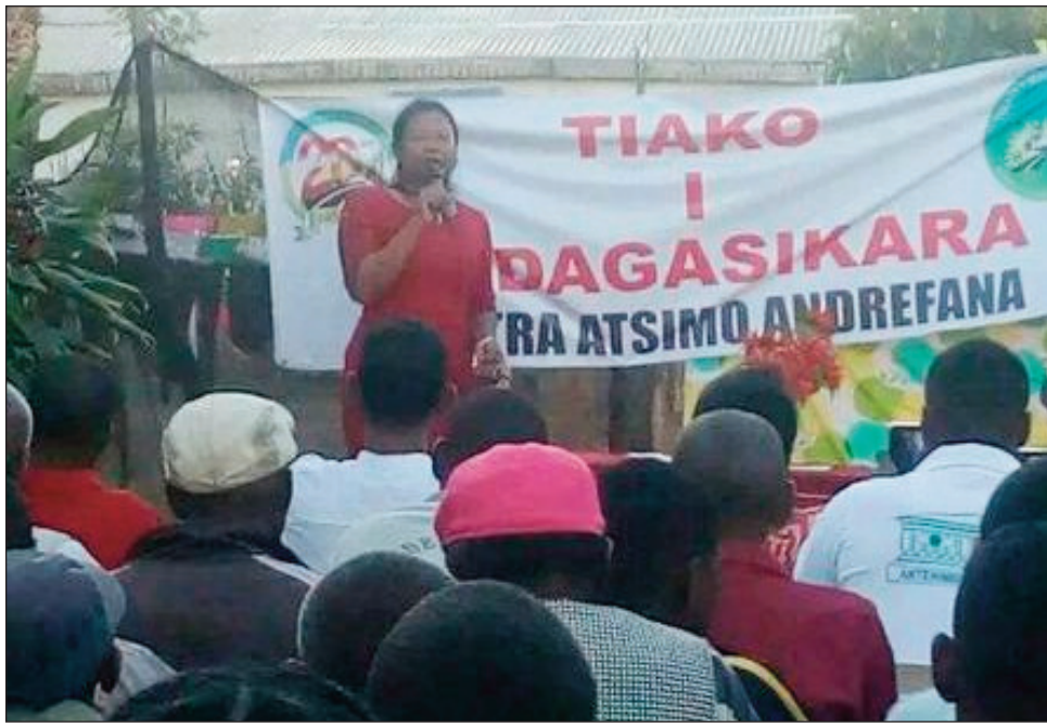
Ny fivoriamben'ny DISTIM tany Toliara.