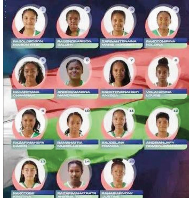
Ankoay, U18 vehivavy.

Nivoaka izao ny anaran'ireo ho ao amin'ny Ankoay, ekipam-pirenena Malagasy eo amin'ny sokajy vehivavy izany: ireto