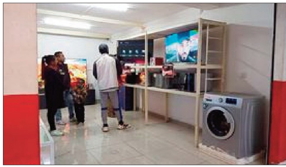
Entana maro samy hafa hita amin'ny Tranomboatra Baolai.

Rehefa manakaiky toy izao ny « Grandes vacances » dia ny milina mandeha amin'ny herinaratra, no mahasarika ny tsirairay. Ao anatin' izany, dia manana tolotra hampihantana ny daholo be, ny Tranomboatra « Baolai » etsy Soarano, Analakely ary ao Bazar be Toamasina. « Noho ny fangatahan'ny besinimaro dia, mbola mitohy hatrany ilay « promotion - cadeau » amin'ireo Smart Tv sy télé Led marika « Jeyoo » sasantsasany, izay ahitana 32" hatramin'ny 85", izay misy antoka 1 taona hatrany. Ny antsipiran'izany rehetra izany, dia ho hita ao amin'ny site web sy pejy facebook baolai ary ao amin'ny laharana 0202230848 sy 0202260588 - 0333718888 (amin'ny ora fiasana) », hoy ny tompon'andraikitra. Mbola ao ihany koa