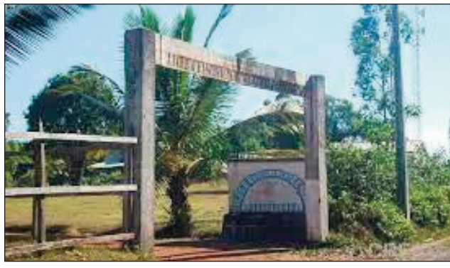
Ny Lycee Tata Max, anisan'ny mandray ireo mpanala fanadinana bakalôrea any Farafangana.

zony afaka miatrika fanadinana, fa saingy eo ambany fiahiana sy fanaraha-mason'ny mpiasan'ny fonja izany manao izany fanadinana izany hatramin'ny alakamisy ho avy izao. Mirary fahombiazana ho avy ny gazety Ny Valosoa Vaovao ary mirary fahombiazana ihany koa ho an'ireo rehetra miatrika ity fanadinam-panjakana ity.