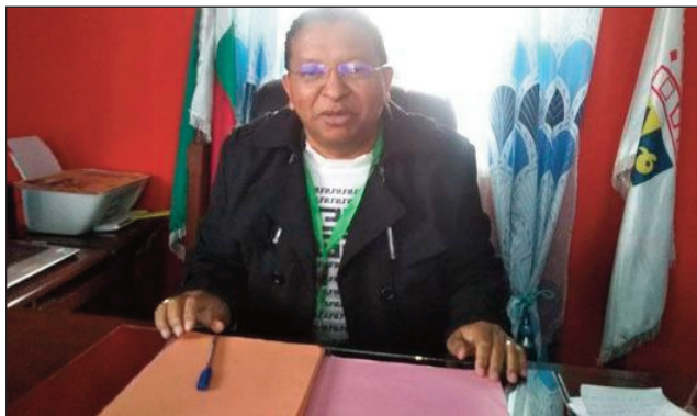
Ny ben'ny tanànan'ny kaominina Sabotsy Namehana Avaradrano, Andriamosa Avotriniaina.

-AA : mandroso ny fanabeazana ato Sabotsy Namehana, be ny foto-drafitrasa vita, ankoatra izany efa misy hatramin'ny Oniversite tsy miankina ato anivon'ny kaominina, eo koa ireo toeram-pianarana miankina amin'ny fanjakana maro. Eo amin'ny