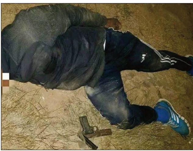
Ilay jiolahy lavo voatitifitry ny zandary teny Alasora.

Jiolahy niomana hanafika no maty voatitifitry ny mpitandro filaminana tany Mendrikolovana, kaominina Alasora distrikan'Antananarivo Avaradrano. Tato anatin'ny herinandro dia nisy ny fisafoana nataon'ireo zandary, ny vondrom-paritry ny fandriampahalemana Antananarivo renivohitra ary ny zana-tobim-paritra Alasora. Paik'ady maro samihafa no nentina nanatanteraka izany. Izany dia fepetra noraisina, mba hanafoanana ny vaky trano, ny fiparitahan'ny zava-mahadomelina ao anatin'ny faritra manodidina ny kaominina Alasora. Nahomby ny tetika, nody ventiny ny rano natsakaina. Jiolahy iray no maty voatitifitry ny zandary, ny talata hariva teo, tany Mendrikolovana, ao anatin'ny kaominina Ala-