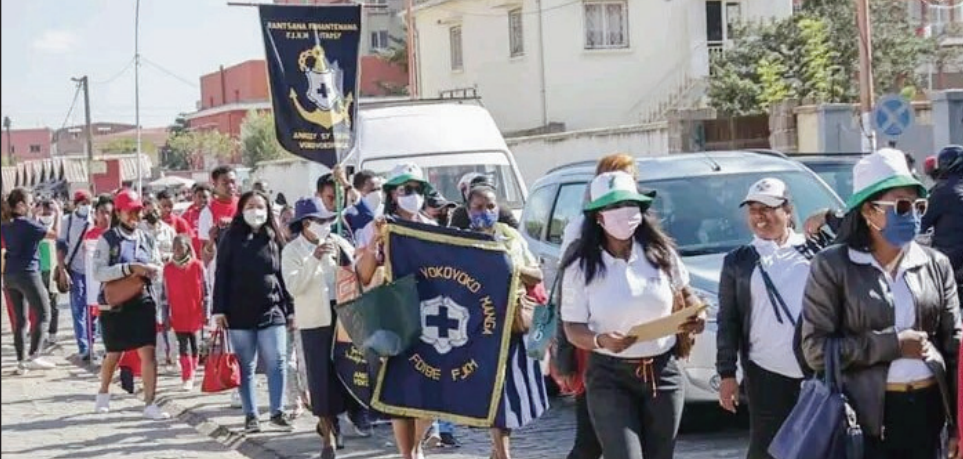
Hetsika nandritra ny fankalazana ny 31 mey, ny talata teo.