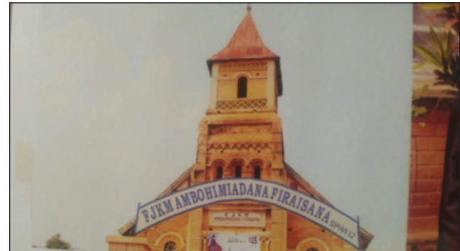
Fjkm Ambohimadana Firaisana.