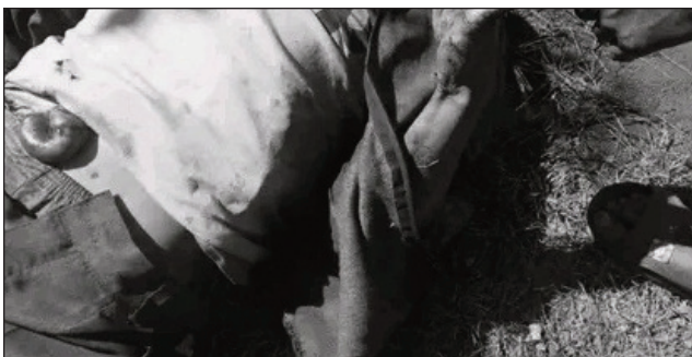
Ilay raimpianakaviana hita faty.

Miseho lany ny tsy fandriampahalemana amin'izao fotoana any amin'ny distrikan'Arivonimamo faritr'ltasy. Sokajina ho faritra mena amin'ny tsy fandriampahalemana ihany koa noho ny afitsok'ireo olon-dratsy ny an-toerana ankehitriny. Mandry tsy lavo loha ny fokonolona ary tsikaritra nahazo vahana ny vono olona. Ny tranga niseho ny harivan'ny alahady 29 mey 2022 lasa teo, no tena nampivarahontsana ny mponina. Lehilahy iray, eo amin'ny 47 taona eo, no hita faty tany Alatsi-