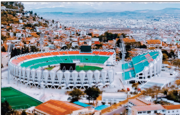
Ny kianjan'i Mahamasina ankehitriny.

Nambaran'ny fampitam-baovao navoakan'ny FMF, fa nisokatra nanomboka omany alarobia 1 jona 2022 ny fivarotana ny tapakila ao amin'ny www.ticketplace, hahazoana manatrika ny lalao hifanandrinan'ny Barea de Madagascar sy ny As Palancas Negras Angolaise, izay tafiditra amin'ny fifanintanana « Qualifications CAN 2023 », andro faha-2, izay ho tontosaina ao amin'ny kianja Barea Mahamasina amin'ny alahady 05 jona 2022.