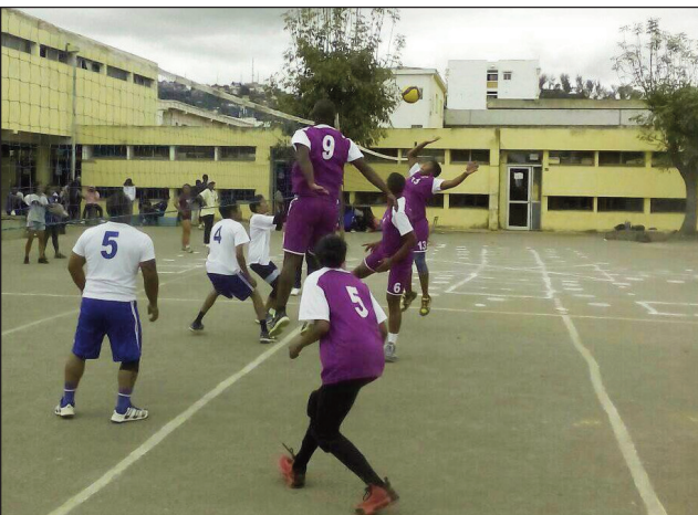
Volley-ball Asief 2022 teny Ampefiloha.

Nahazoam-bokatra ireo lalao basikety sy volley-ball notontosaina tamin'ny sabotsy lasa teo, ho an'ny fifaninanana Asief 2022 eto Analamanga. Voka-dalao volley-ball notontosaina teny amin'ny kianjan'ny LMA : A.N (03) # MEAH (00) FORFAIT, MJS (03) # MMRS (00), SENAT (03) # CUA (00), MDN (03) # JIRAMA (01), PRM (03) # TOPDOM (00). Voka-dalao basikety teny amin'ny kianja Toby Ratsimandrava DB : SANTE 44 - 32 MEF, VD