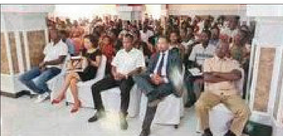
Ny fihaonambem-paritry ny antoko RDS tany Mahajanga.

Nahatanteraka fihaonambem-paritra tany amin'ny faritra Boeny ny sabotstey, ny antoko RDS (Roso ho amin'ny Demôkrasia Sôsialy), izay tarihan'ny fi-