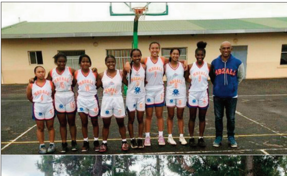
Ny ekipan'ny Mb2All Analamanga U18, 2022.

kbb, Dtsc 72 - 09 Btv, Cosbaimi 60 - 17 Nbe, Jcba 55 46 Bcna, U16 F : Lucadro - Cosfa, Asa 36 - 07 Gbca, Ast 17 - 39 Mb2All, Sepa 67 ha 38 - 42 Jcb. Rainilita