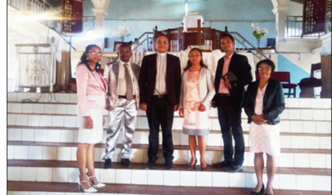
Ireo nitarika ny fotoana tao amin'ny FJKM Ivoanjo Finoana.