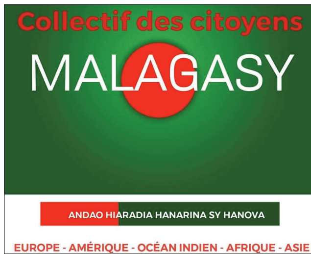
Ny sary famantarana ny Collectif des Citoyens Malagasy Maneran-tany.

Manoloana ny fanambarana nataon'ny filoha Marc Ravalomanana, filohan'ny rodoben'ny mpanohitra eto Madagasikara (RMDM), sady filoha nasiônalin'ny antoko TIM, ny alatsinainy lasa teo, sy manoloana ny tsy fanajana ny demôkrasia sy ny lalàm-panorenana miverimberina ataon'ny fitondrana Rajoelina, nanao fanambarana ny "Collectif des Citoyens Malagasy Maneran-tany". Nanambara izy ireo fa handray ny andraikiny na eo amin'ny sehatra iraisam-pirenena, na ny aty an-tanindrazana ihany koa. Maromaro ireo fikambanana nanao izany fanambaran-fanohanana ny fanambaran'ny filoha Ravalomanana izany, toy ny : K25 Benelux (Belgique- Netherlands-Luxembourg), ny GTT La Reunion, Pro-Ravalomanana, ny K2, VVSD (Vehivavy Vonona Sahy Diaspora, ... Toy izay ny santionan'izany fanambarana izany : "Izahay vondrona, manohana ny Filoha Ravalomanana Marc ho Filohampirenena miray amin'ny fiombonambe "Collectif des Citoyens Malagasy Maneran-tany" dia manao izao fanambarana izao, tao aorian'ny nahafantarany ny tsy fanajana ny demôkrasia sy ny fanitsahana efa ho lavareny ny lalàm-panorenana.