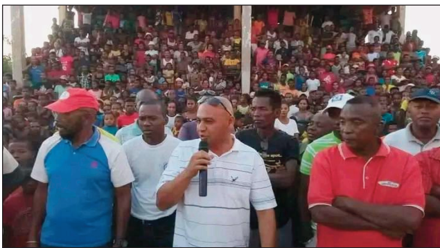
Ny depiote Leva (mitana micro).

Ny zoma 17 Jona dia tonga namory olona tao Ankilizato faritra Menabe ny Justice et Paix avy ato Morondava, ka nanontany ny fototry ny tsy fandriampahalemana ao Ankilizato ary nilaza fa afaka hiaro ireo vahoaka, ka nisy ny olona nilaza fa efa tsy misy ny olana eo amin'ny ben'ny tanàna sy ny depiote, fa olona avy amin'ny ekipan'ny ben'ny tanàna no mpanao kidnaping sy vpono olona ao Ankilizato, saingy tsy nahirahan'ny ben'ny tanàna azy ireo izany. Namaly koa moa ny ilany, nilaza fa tsy marina izany fa tsy mifanaraka ny ben'ny tanàna sy ny solombavambahoaka, ka izay ny fototry ny olona ao satria dia migadra avao izay ben'ny tanànan'Ankilizato tsy miray tendro amin'ny Depiote Leva. Zao za da mbola Depute leva koa