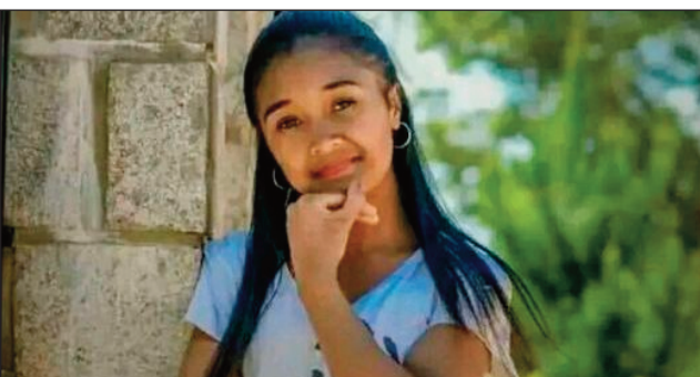
Ilay tovovavy nisy naka an-keriny tany Sabotsy Anjiro Moramanga.

amin'ny zandarimariam-pirenena any an-toerana amin'izao fotoana.