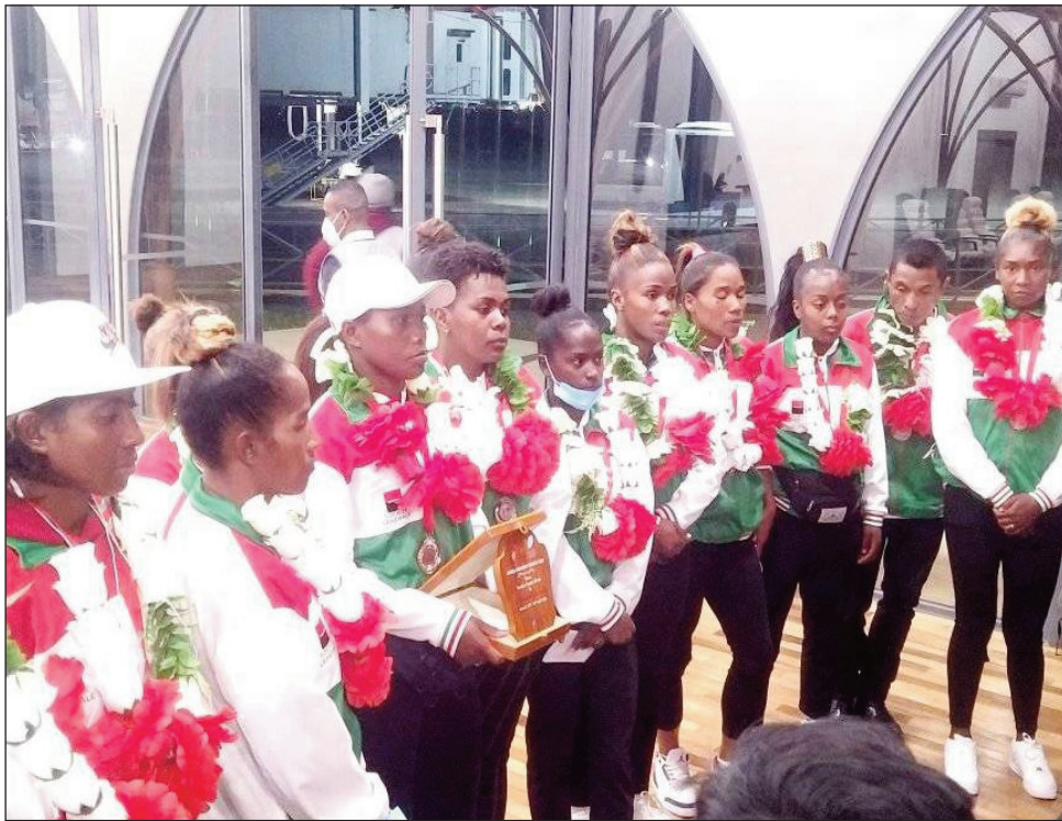
Ny "Ladies Makis 7s" tonga teny Ivato.

Lanonana maro no voafaritry notontosaina hatramin'ny omaly alarobia 04