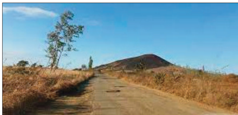
Ny lalampirenena faha 6

Fiara iray hihazo an'Antananarivo, no nikatso tao Antsohihy faritra Sofia, nandritra ny ora maro ny talata 03 mey lasa teo. Fiara iray niala tany Diego hihazo an'Antananarivo avy amin'ny Kaoperativa KOFMAD io nikatso tao amin'ny 33 km tsy hidirana an'Antsohihy nanomboka ny alahady 1 mey lasa teo ka hatramin'ny talata teo. Velon-taraina ireo mpandeha, fa tsy nisy ny fiara hafa nalefan'ny Kaoperativa ho azy ireo. Ireo nanana saran-dalana ihany no tafody ary nisakana fiara, ireo tsy nanana fahefana kosa dia niandry izay tian'ny mpamily natao sisa. "Ny fianakaviana efa sasa-miandry taty Antananarivo. Ny tena sady lany vola no lany fotoana, hoy ireo mpandeha, teo am-piandrasana vahaolana izay tsy fantatra hoe rahoviana tamin'izany. Tena tsy rariny ny tsy fanarahan-dalana tahaka izao", hoy ireo mpandeha. "Tsy misy fizahana ny fiara akory alohan'ny handeha. Vaky ny kodiarana, tsy misy na ny hasolo azy akory aza. Ny saran-dalana anefa naloa feno. Tsy misy fanajana ny mpandeha mihitsy", hoy hatrany izy ireo. Tsy nisy ny vahaolana nomena ny mpandeha. Ny fiara tsy voakaraka tsy tokony hisa mihitsy, kanefa sady handeha lavitra. Mitaraina ireo mpandeha ary miantso vahaolana avy amin'ny tompon'andraikitra.