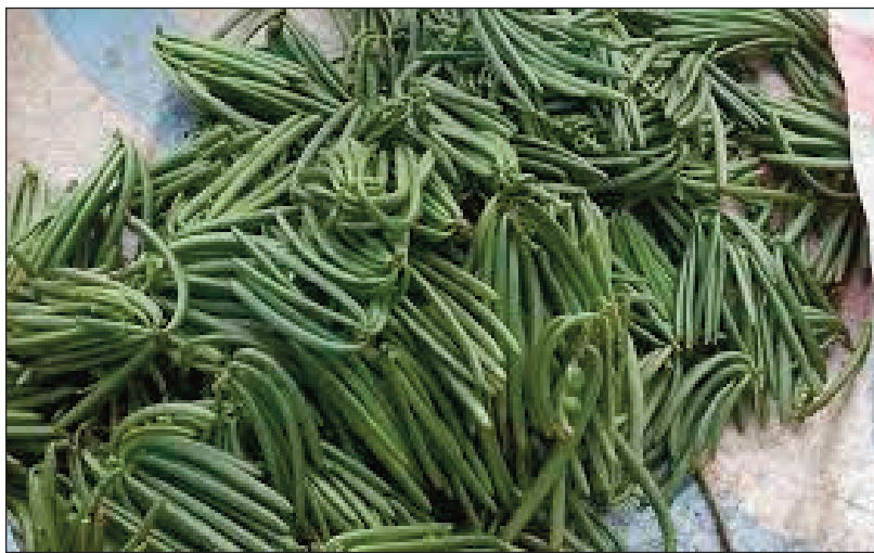
Lavanila manta, miainga eny amin'ny tantsaha.

andraikiry ny varotra ankehitriny, amin'ny fahafahan'ny mpamboly handefa solontena, hiaro sy hitondra ny tenin'izy ireo amin'ny fivoriana isa-tsokajiny momba ny lavanila. Fantatra fa ho tanterahana any amin'ny fokontany ny fivorian'ny CNV, komity nasionalin'ny lavanila amin'ity taona ity. Raha ny vidin'ny lavanila masaka koa dia tsy tonga amin'ny vidiny nampanantenain'ny filoha Rajoelina hatramin'izao ny vidin'ity voly fanondrana ity.