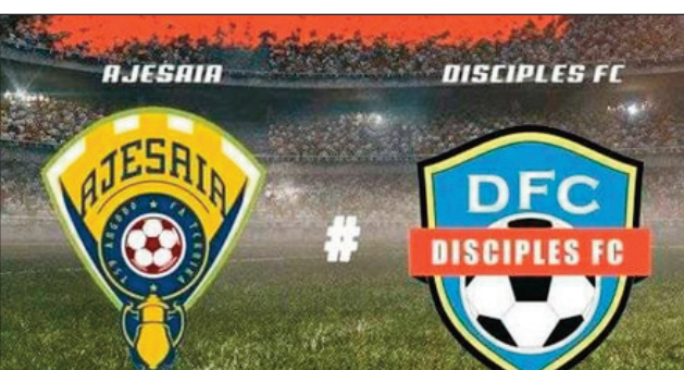
Playoffs 1/2-famaranana mandroso OPL 2021/2022.

Ny kianja syntetika eny Ambohidratrimo eto Antananarivo sy ny «Stade Moderne d'Ampasambazaha » any Fianarantsoa, no handray an'ireo lalao ankatoky ny famaranana mandroson'ny fifaninanana "Playoffs Orange Pro League 2021/2022 " amin'ny sabotsy sy alahady ho avy izao.