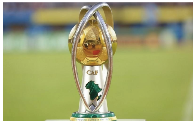
Amboara ny Chan.

Nanambara ny CAF fa hahemotra amin'ny fotoana manaraka, izay mbola tsy voafaritra ny antsapaky ny fifanintanana CHAN 2022, hatao any Algérie amin'ny taona 2023, izay tokony notanterahina tamin'ny alakamisy 28 aprily 2022. Marihana fa ekipa miisa 47 no nanoratra anarana, hanao ny fifanintanana, ka anisan'izany ny Barea de Madagascar. Raha ny tokony ho izy dia toerana 3 no hiadian'ny vondrona aty amin'ny tapany Atsimon'i Afrika. 13 no hifanintanana. Lesotho irery no tsy handray anjara. Fifanintanana mivantana mandroso/miverina no