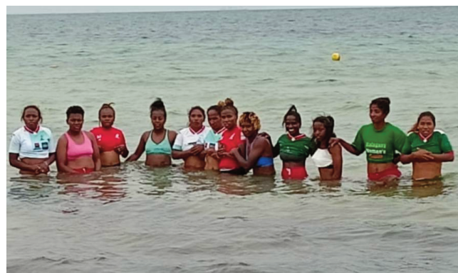
Makis à 7 vehivavy any Tonizia.

Niatrika ny fifaninana rugby Africa Womens Sevens 2022 omaly zoma 29 aprily, ny Makis à 7 vehivavy, ka nifanandrina tamin-dry zareo Ghanaena tamin'ny 3 ora sy 12 min ary tamin'i Tonizia tamin'ny 4 ora sy 40 min tao amin'ny kianja Gammel any Tonizia. Marihana fa anio sabotsy 30 aprily 2022 no andro faharoa farany amin'ity fifaninana ity, ka marihana fa ankoatra an'ireo ekipam-pirenena 4 voalaza teo ireo dia mbola ao ihany koa i Sénégal sy Zimbabwe, Zambia sy