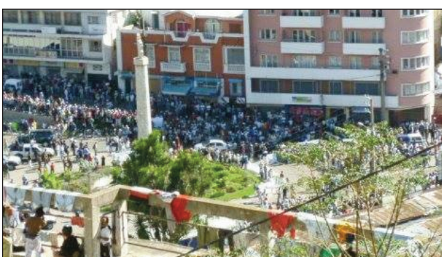
Hiainga eto Ambohitato, ny filaharamben'ny mpiasa rahampitso alahady voalohan'ny volana mey.

Tsy amelàna raha tsy azo ny fitakiana, nisongadina io nandritra ny fihaonana teo amin'ireo sendika samihafa toy ny SSM, CTM ary ny SESAM omaly nandritra ny fihaonany ireo tamin'ny mpanao gazety. Tanjona amin'izany ny famoronana asa, karama tsy mifanaraka amin'ny vidim-piainana, tany tan-dalàna lavitry ny kolikoly ary anjakan'ny fandriampahalemanana eto Madagasikara. Filaharambe miainga eny Ambohitato amin'ny 9 ora maraina miaraka amin'ny sorabaventy sy ny mpitondra taxi eto andrenivohitra, no hanao filaharana mihazo ny Gymnase couvert Mahamasina raham-