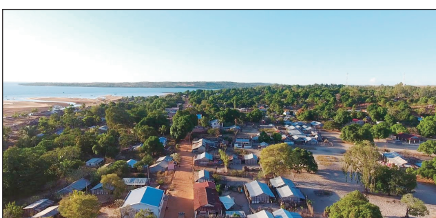
Ny tanànan'Analalava any amin'ny faritra Sofia.