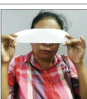
Ireo vehivavy roa mpisoloky tratra, tany amin'ny renivohitry ny faritra Atsinanana.

Nisehoana tranga fisolokiana tany Toamasina faritra Atsinanana tamin'ity herinandro ity. Vehivavy roa no tratran'ny polisy any an-toerana nisandoka ho mpiasam-panjakana, ka efa namitaka orinasa maromaro tany an-toerana. Nisandoka ho mpiasana ministera ireto andriambavilanitra ireto, ka nitety orinasa tao Toamasina ary naka vola, nilaza fa misy hetsika sosialy atao eo anivon'ny INTRA: INstitut National de TRAvail, izay rafitra iray eo anivon'ny Ministeran'ny Asa sy Fampananan'asa ary Lalàna sosialy. Rehefa nahazo antso avy tamin'ireo tom-