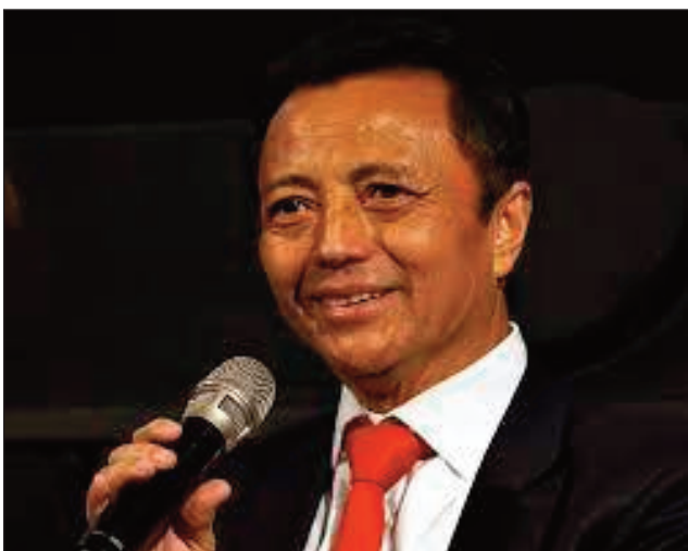
Ny filoha Marc Ravalomanana, filoha nasiònaliny antoko TIM.