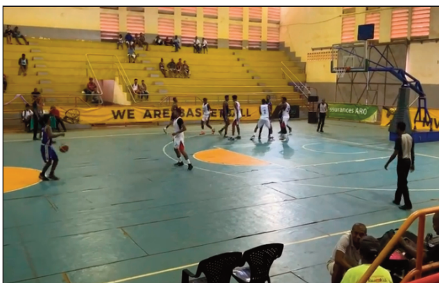
Basket N1A lehilahy 2022 any Antsiranana.

Andro farany amin'ny dingana fifanintsanana omaly zoma 29 aprily 2022, eo amin'ny fifanintsanana basikety fiadiana ny ho tompondakan'i Madagasikara 2022, ho an'ny vondrona Andrefana, izay tanterahina ao amin'ny "Gymnase Couvert Antsiranana", ka nikatoka voalohany tamin'izany ny -2Bc Analanjirofo sy ny Gnbc Analamanga, narahin'ny Tgbc Betsiboka sy ny Sebam Boeny ary ny Mb2All Analamanga sy ny