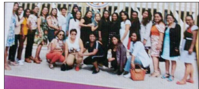
Ireo avy amin'ny MMF Analamanga.