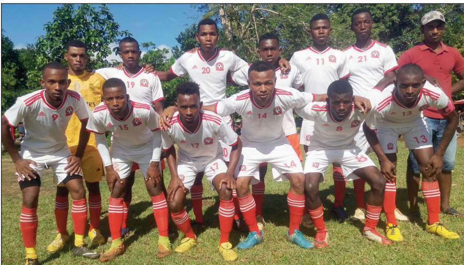
Ny ekipan'ny Taureau Fc Vohimasina, anisan'ny nilalao ny fan'ny herinandro teo tany Vohipeno.