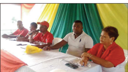
Ireo lohandohan'ny mpisorona amin'ny antoko TIM any Fenoarivo Atsinanana.

Nanatanteraka fanameloma-maso sy fana-beazamboho, na redynamisation ny antoko Tiako i Madagasikara (TIM), ireo mpitarika ity antoko ity, tany Fenoarivo Atsinanana, faritra Analanjirofo ny faran'ny herinandro teo. Noho ny traikefa ananan'ny filoha Marc Ravalomanana, amin'ny fitantanam-pirenena sy fahaiza-mitarika, miantso ity ray amandrenin'ny firenena ity hirotsaka hofidiana ho filoha indray izy ireo amin'ny taona 2023. Araka ny fanambarana nataon'ireo mpita-