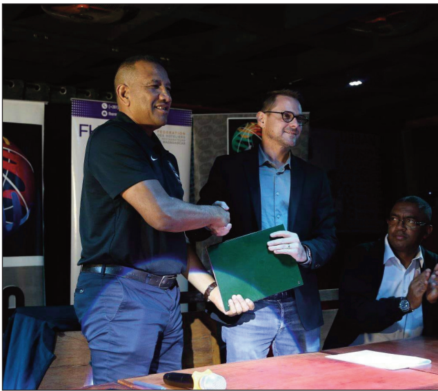
FMBB sy FHORM tetsy Anosy.