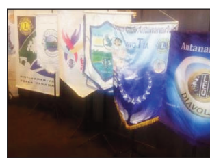
Ny famantarana samihafa ny Lions.