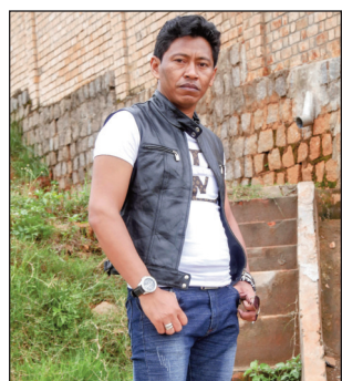
Nanou, anisan'ireo nanangana ny tarika « Zovy ».