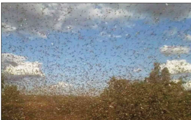
Andiam-balala mamely ny any amin'ny faritra Menabe.