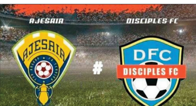
Playoffs 1/2-famaranana mandroso OPL 2021/2022.

Ny kianja syntetika eny Ambohidratrimo eto Antananarivo sy ny «Stade Moderne d'Ampasambazaha » any Fianarantsoa, no handray an'ireo lalao ankatoky ny famaranana mandroson'ny fifaninanana "Playoffs Orange Pro League 2021/2022 " amin'ny sabotsy sy alahady ho avy izao.