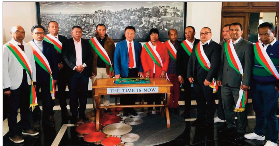
Ny filoha Ravalomanana, sy ireo depiote TIM, teny Faravohitra, omaly tolakandro.

panorenana dia miantoka ny fahalalahana maneho hevitra ao amin'ny andininy faha-10, ary ny "zo hivezivezy malalaka manerana ny tanin'ny Repoblika" ao amin'ny andininy faha-12. Ny fanakanana sy fisavana ny delegasiôna notarihin'ny Filoha nasionalin'ny TIM, sy ny fandràna ny fameloma-maso, izay nokasain'ny antoko TIM hatao tao Antsirabe ny sabotsy 28 mey 2022, dia tena fanitsakitsahana ny Lalàmpanorenana. Fanararaotam-pahefana ireny fepetra noraisina tamin'ny mpanohitra ireny, ary ny mpitandro ny fila-