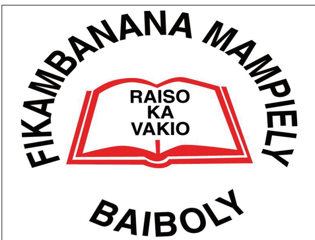
Mampielly ny baiboly ihany koa ny FMMBM.