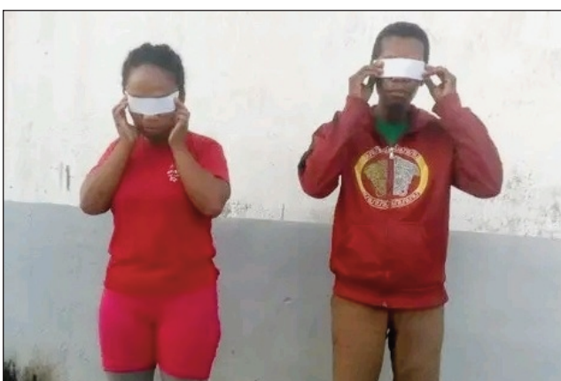
Ireo mpisoloky tratra tany Mahanoro.

Nisehoana asa fisolokiana ihany koa ny any Mahanoro any amin'ny faritra Atsinanana, vehivavy iray misandoka ho mpitsabo, sy lehilahy iray milaza ho mpiasan'ny Jirama, no voasambotra tany an-toerana. Tsy mit-sahatra manao ny ezaka hamongorana ny tsy fandiampahalemana sy fisolokiana amin'ny lafiny rehetra ny Polisim-pirenena any Mahanoro. Miara-miasa amin'ny olona tsara sitrapo izay manome vaovao ho azy ireo hatrany ireto farany, ka izany no anisany nahazoana ireto vokatra tsara ireto: Ramatoa iray misandoka ho mpitsabo amin'ny alalan'ny ody