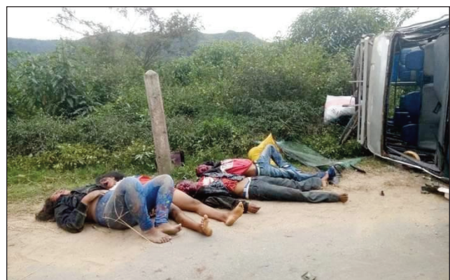
Loza mahatsiravina nitranga tany Anjiro Moramanga.