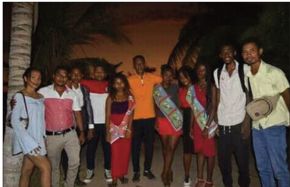
Ny fameloma-maso ny antoko TIM tany Maroantsetra faritra Analanjirofo.