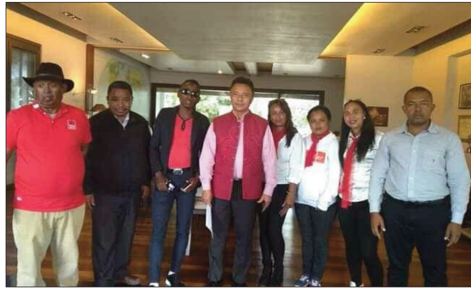
Ny Dis-TIM Manjakandriana, nifampiarahaba tratra ny taona tamin'ny filoha Ravalomanana, teny Faravohitra.