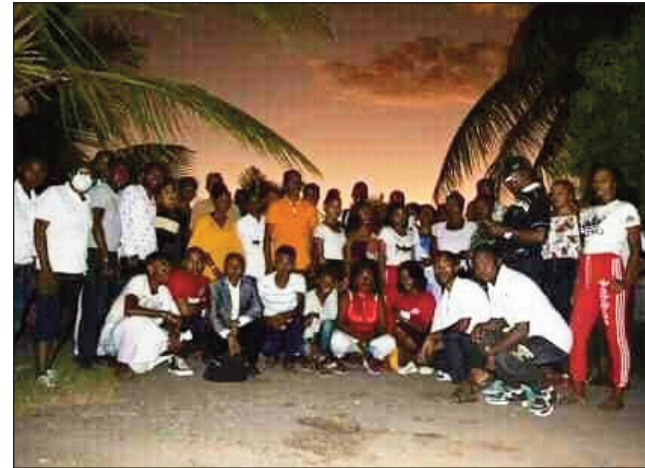
Ireo mpitarika ny Tanora TIM any amin'ny faritra Atsimo Andrefana.