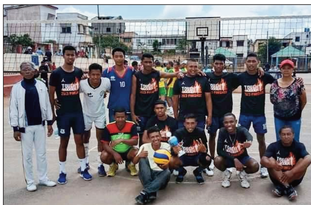
Volley-ball Analamanga teny ltaosy.

Ny daty farany fanovanana «mutation interligues» kosa anefa dia hahemotra amin'ny 31 mey 2022 ho avy izao.