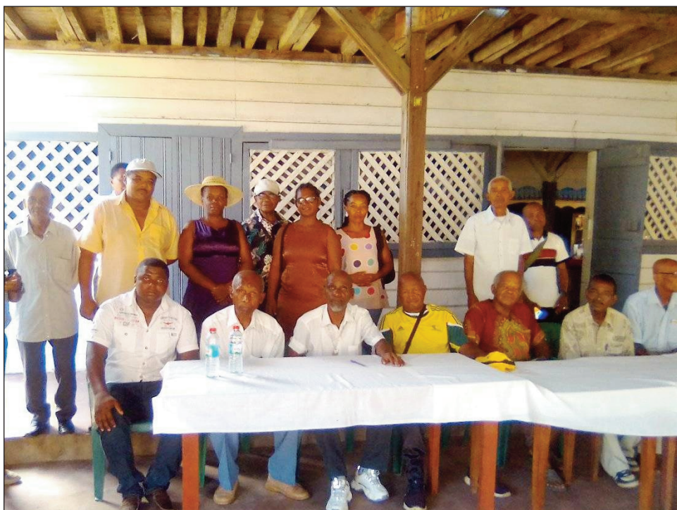
Ny fivorian'ireo mpitarika ny antoko TIM tany Maroantsetra.