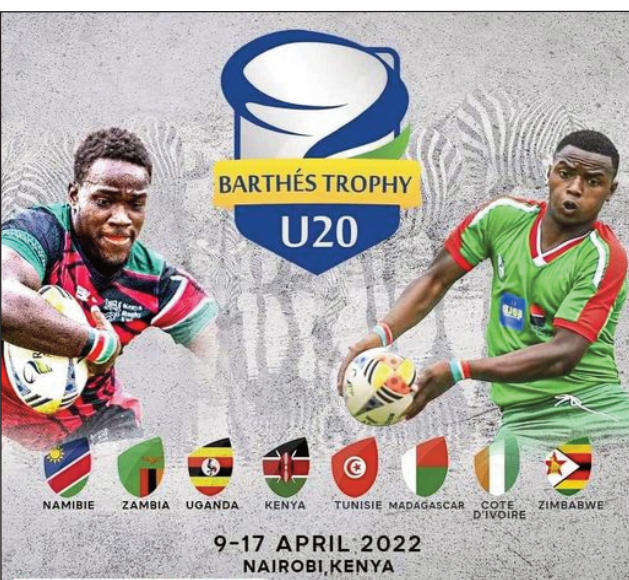
9-17 APRIL 2022 NAIROBI, KENYA