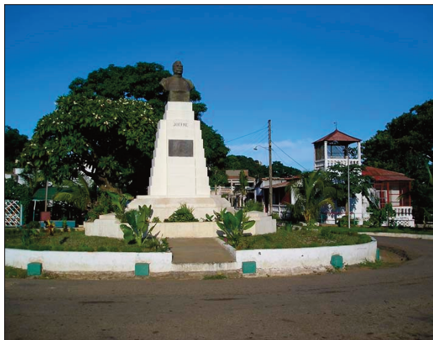
Ny Place Joffre any Antsiranana.