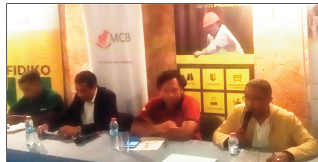
Mpikarakara avy amin'ny Utop.