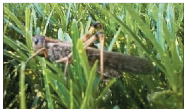
Valala mpanimba voly any amin'ny distrikan'i Manja.

Mirongatra ny andiam-balala amin'izao fotoana any amin'ny distrikan'i Manja faritra Atsimo Andrefana. Noho izay antony izay, maro ny fambolena potika any an-toerana. Anisan'ny faritra mpamokatra vary, katsaka, voanjo sy tsaramaso, kabaro sy ny maro hafa anefa ity distrika ity. Ankehitriny, velon-taraina ireo tant-saha noho ny firongatry ny andiam-balala sy kijeja izay, mamotika ny fambolena. Efa tao anatin'ny tapa-bolana izay no nirongatra ireo andiam-balala ireo. Miakatra mameno ny arabe amin'ny lalam-pirenena fahasivy mi-hitsy aza izany, ka mananosarotra ny fifamoivoizana. Mangataka fanampiana sy famonjena ireo tantsaha any an-toerana, ny mba hamonoana ireo andiam-balala ireo. Hisy fiantraikany amin'ny vokatra mivoaka avy ao amin'ity distrika ity ny fahasimban'ny voly izao.