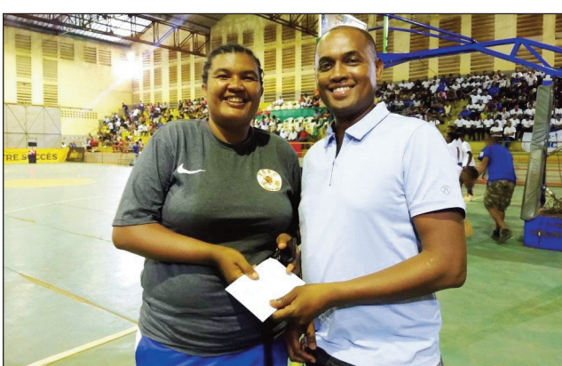
Fanolorana fanampiana tany Antsiranana.

Andro faha-4 ny fifanintsanana basikety, fiadiana ny ho tompondakan'i Madagasikara 2022 ho an'ny vondrona Andrefana, anio alakamisy 28 aprily 2022. Ao amin'ny "Gymnase Antsiranana" hatrany, no hanatontosana ny hetsika araka izao fandaharam-potoana izao :