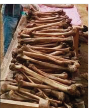
Ireo taolam-paty tratra tany Ankilizato.