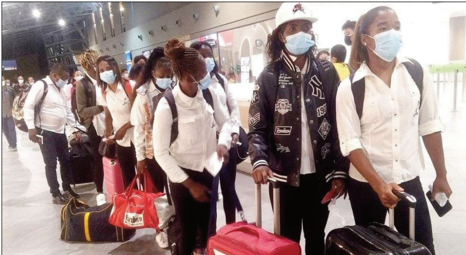
Makis à 7 vehivavy teny Ivato.

Nanainga tetsy amin' ny seranam-piaramanidina tamin'ny talata 26 aprily 2022 lasa teo, hiatrika ny fiadiana ny ho tompondakan'i Afrika eo amin'ny taranja Rugby lalaovin'olona fito (7), izay ho tanterahina ny faha-29 sy 30 aprily any Jammel Tunisie, ny ekipan'ny Makis de Madagascar vehivavy, ahitana mpilalao miisa 12 sy "Coach" iray, "Manager" iray ary Mpitsara sy Mpitsabo iray avy.