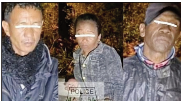
Ireo olona 3 nosamborin'ny polisy.

Olona nanao taingin-telo tamin'ny moto sady nisandoka andraikitra, no nosamborin'ny polisy afak'omaly alina. Izy ireo dia lehilahy 60 taona sy 47 taona ary voavavy 39 taona, no voasakan'ny Polisy tamin'izany, rehefa nanao taingin-telo tamina moto iray tokony ho tamin'ny 12 ora alina afak'omaly. Vao nahita ireo Polisy nanakana ilay lehilahy 47 taona nitondra ilay moto dia nitonona ho "Brigadier de Police", ka tsy