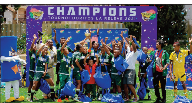
Tompondaka Doritos andiany voalohany.

Nifarana omaly alarobia 27 aprily 2022 ny fisoratana anarana, amin'ny fifaninanana baolina kitra ho an'ny katitakely: « Tournoi Doritos La Relève » andiany faha-2. Marihana fa ankizy teraka anelanelan'ny 1 janoary 2007 sy 31 desambra 2008, no ekena handray anjara amin'ity fifaninanana ity, ka mitondra Bokim-pianakaviana