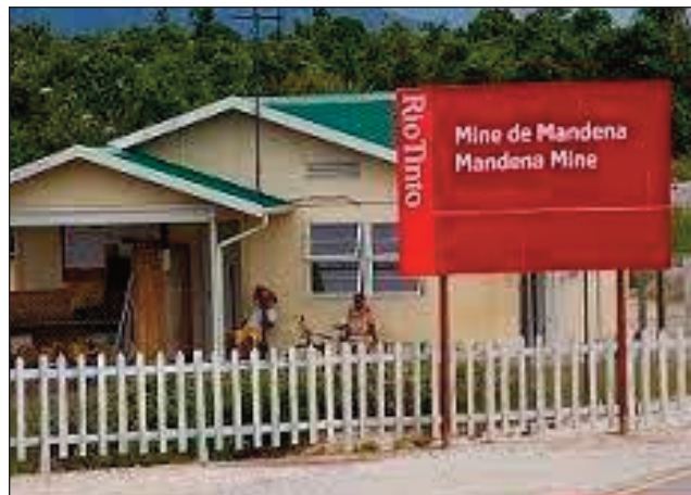
Ny orinasa Rio-Tinto/QMM any Mandena Faradofay.

Araka ny vaovao farany voaray omaly, avy any Mandena any amin'ny distrikan'i Fort-Dauphin faritra Anôsy, nirefotra ny lakrimôzena tany an-toerana nanaparitahan'ireo mpitandro filaminana, ireo tantsaha sahirana nanao fihetsiketsehana. Nifampiatrika tamin'ireo vahoaka: vahoaka maty mosary noho ny fahatapahan'ny antom-pivelomany, izay nanao grevy teny amin'ny lalan'i Mandeha, ny mpitandro ny filaminana.