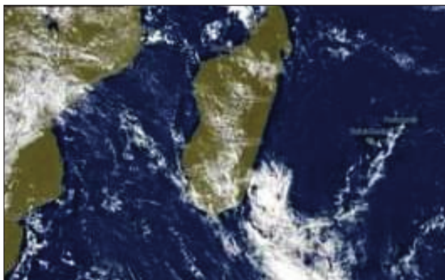
Sarin'ny rivodoza Jasmine tamin'ny zanabolana omaly.

Efa nivoaka an-dranomasina omaly tany atsimon'i Farafangana faritra Atsimo Atsinanana ny rivodoza Jasmine. Tsy misy atahorana ingtsony arak'izany ny momba ity rivodoza ity araka ny nambaran'ny ao amin'ny sampan mpa-mantatra toetrandro eto amintsika. Iny koa no mety ho rivodoza farany handalo eto amintsika tamin'ity taom-pahavaratra teo, fa fa amin'ny taom-pahavaratra manaraka indray vao mety hisy izay rivo-mahery izay handalo eto Madagasikara. Faran'ny volana aprily sy mey eo tokoa no fiakaran'ny fandalovan'ny rivodoza