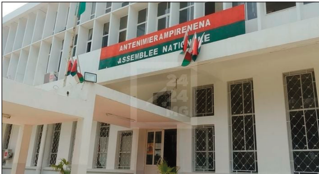
Ny lapan'ny Antenimierampirenena eny Tsimbazaza.

Hivory ara-potoana voalohany amin'ity taona ity, ireo Parlemanta eto amin-tsika dia ny Antenimierandoholona sy ny Antenimierampirenena, ny talata 3 mey ho avy izao no hanomboka amin'ny fomba ofisialy izany fivoriana ara-potoana izany. Io dia araka ny voalaza ao amin'ny lalampanorenana, mivory ara-potoana voalohany ny Parlemanta eto amin-tsika manomboka ny talata voalohany amin'ny volana mey, koa dia io talata 3 mey io no daty hanombohan'izany fivoriana izany. Araka ny loharanom-baovao, misy depiote maro an'isa eny Tsimbazaza amin'izao fotoana, miketrika ny fanonganana ny biraon'ny maharitra andrimpanjakana mpanao lalàna ity. Vokatry ny olana anatin'ny an'ivon'ireo mpomba ny fitondrana no mahatonga iza-