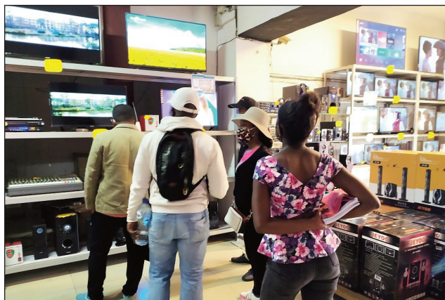
Entana maro samy hafa hita amin'ny Tranombarotra Baolai.

R ehefa manakaiky toy izao ny volana mey dia maro ny magazay lehibe eto amintsika, no manavao ny tolotra omeny. Anisan' izany ny Tranombarotra « Baolai » etsy Soarano, Analakely ary ao Bazar - be Toamasina, izay ahitana entana « 1er choix », mifanaraka amin' ny filana sy ny fahefa-mividin'ny besinimaro hatrany. « Vao nahatonga Smart tv - t l  led 32" hatramin'ny 85 " sy laser tv samihafa iza-hay (misy antoka 1 taona). Ho an'ireo izay mividy Smart tv marika «Jeyoo» iray 42" - 75" sy 85" dia hahazo ampli - baffle rechargeable iray hoy ny tompon' andraikitra. Ny antsipiriana izany rehetra izany, dia ho hita ao amin' ny site web sy pejy facebook baolai ary ao amin'ny laharana antarobia 020 22 605 88