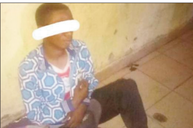
Mpangarom-paosy tratra tany Ivato.

Voasambotra ny mpangarom-paosy iray nikohizana tao amin'ny tsenan'ny kaominina Ivato distrikan'Ambohidratrimo. Manao ny ezaka rehetra hamongorana ny tontakely sy ny mpangarom-paosy ny polisy kaominialy, ny miaramila sy ny zandarimariam-pirenena eny Ivato. Andro tsena ny alarobia, ka mifanaret-saka ny mpivarotra sy ny mpividy, ka eo no manararaotra manao ny asa ratsiny ireo jiolahy. Efa