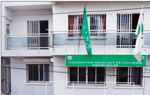
Ny biraon'ny FMF eny Isoraka.

Tamin'ny andron'ny alakamisy 31 martsa 2022 dia fitantanana roa miavaka tsara, no fantatra fa miandraikitra ny Federation Malagasy de Football, satria ny mpitantana ilany nosoloin'ny filoha lefitra voalohany ao amin'ity rafitra ity, sy ny SG ao aminy dia nantsoin'ny Fifa nanatrika ny "72ème Congrès de la FIFA" any Doha Qatar ary ny mpitantana iray hafa kosa, notarihan'ny filoha lefitra fahatelo ao