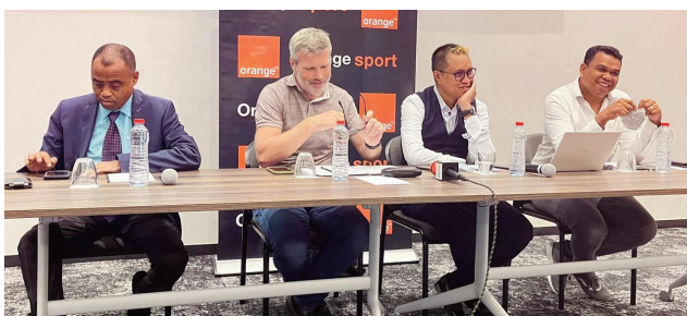
Ny CFEM teny Ambodivona.

Nampita vaovao maromaro tamin'ny mpanao gazety, teny Ambodivona ny alakamisy teo, ny mpitantana ao amin'ny CFEM notarihan'ny filohany.