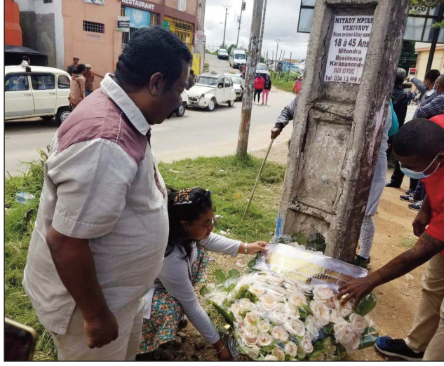
Ny fanaterana fehezamboninkazo teny Soanierana ny alakamisy teo.

31 martsa 1992, notsaroina afak'omaly ireo Federalista namoy ny ainy tamin'ny diabe nataon'izy ireo, saika ho eny amin'ny Cemes Soanierana, nisy ny fikaonandoham-pirenena tamin'izany fotoana izany. « Feno 30 taona ny nahafatesan'ny namana federalista. Mahatsiaro anareo izahay federalista maneranana an'i Madagasikara ». Io no teny voarakitra teo amin'ny fehezamboninkazo izay nentina nahatsiarovana sy nanzomezam-boninahitra ireo martiora mahery fon'ny firenena, izay resy lahatra tamin'ny foto-kevitra fitsinjaram-pahafana federalista. Raha nandeha hanantitra ny lalampanore-natana federalista tao amin'ny fikaonandoha tao