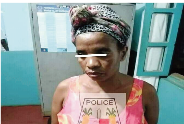
Ilay vehivavy mpisoloky tratra.

Asa fisolokiana, vehivavy iray 35 taona eo milaza ho mahay mampitombo vola, saingy voasambotry ny mpitandro filaminana tany Antsirana faritra Diana. Milaza ho mahay mampitombo vola amin'ny alalan'ny vata kely ity vehivavy ity. Miresaka amin'ny olona izy ary mampiseho ny fahaizamanaan'ny amin'ilay vata kely eo ary tena vola no ampiasainy amin'ny voalohany. Misy amin'ireo namany no miaraka mijery amin'ireo olona eo, ka mody gaga mahita ny zavatra ataony ary mamporisika ireo mpijery hanao izany. Lehilahy iray no