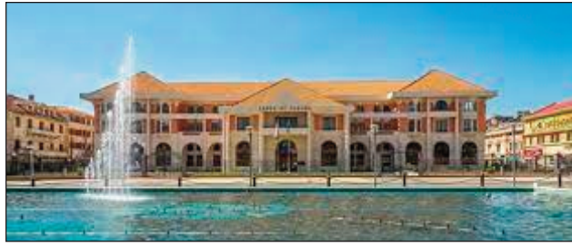
Ny tranon'ny CUA, maloto ny fitantanana, maloto ny tanàna.