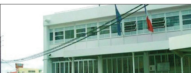
Ny tranon'ny Masoivoho Frantsay etsy Ambatomena.

Hifidy eto amintsika ihany, ireo Frantsay monina sy miasa eto Madagasikara. Nanambara ny Ambasadaon'i Frantsa eto Madagasikara, fa hisy biraom-pifidianana hisokatra eto Madagasikara hahafahan'ireo teratany Frantsay miasa sy monina eto Madagasikara, manatanteraka ny latsa-batony. Miisa 12 ireo biraom-pifidianana ireo, izay hita manerana ny Nosy: 5 eto Antananarivo renivohitra, ary 7 kosa any amin'ny faritany hafa toa an'i Mahajanga, Fianarantsoa, Toliara, Antsirana, Toamasina, Nosy-be, ary Antsirabe. Raha tsiahivina, ny 10 aprily ho avy izao no hanatanterahana ny fihodinana voalohany, ary ny 24 aprily 2022 kosa no hanaovana ny fihodinana faharoa amin'ity fifidianana ho filohampirenena Frantsay ity. Marihina fa ny Frantsay no anisan'ny vahiny voalohany, maro monina sy miasa eto Madagasikara.