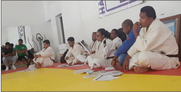
Mpanao Judokas Malagasy.

Hanomboka anio alakamisy 14 ka tsy hifarana raha tsy amin'ny sabotsy 16 aprily 2022, ny fifaninana "Coupe de Madagascar de Judo 2022".