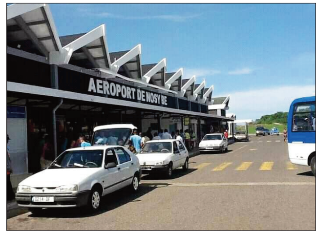
Ny seranam-piaramanidin'i Fascène any Nosy-Be.

Nisokatra nanomboka omaly, ny sidina iraisam-pirenena any Nosy-Be faritra Diana, arak'izany nisokatra amin'ny sidina avy any ivelany koa ny seranam-piaramanidina iraisam-pirenena'i Fascène. Sidina NEOS mampitohy an'i Milan any Italy sy i Nosy-Be io tonga omaly io. Mpizahatany miisa 336 no tonga any amin'ny Nosy Manitra, renivohitry ny Ylang-Ylang eto amintsika. Heverina fa hanomboka hiarin-doha amin'izay ity sehatry ny toekarena: fizahantany ity any an-toerana. Efa tena latsaka antanarana tanteraka ireo mpisehatra rehetra amin'izany tany Nosy-Be, toy izany koa ny mponina, noho ny fikatonan'ny seranam-piaramanidina tany an-toerana, vokatry ny fepetra noraisina momba ny valanaretina coronavirus.