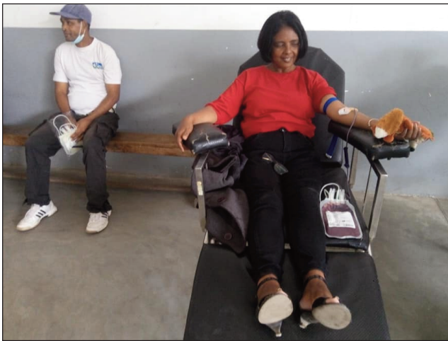
Hetsika fanomezan-drà natao tetsy Bel'Air.

Taorian'ny hetsika famonjena ireo traboina vokatry ny rivo-doza nisesy teto amin'ny fireena, izay nitondran'ny Vehivavy Tiako i Madagasikara (TIM) avy eto Analamanga anjara dia tsy mitsahatra mijery izay rehetra mety hahasoa ny mpiara-belona aminy izy ireo araka ny tarigetran'ny filoha mpanorina ny antoko TIM ny filoha Marc Ravalomanana. Amin'ny maha renim-pianakaviana azy ireo dia eo ny fijerena ny lafiny fahasalamana, indrindra ny fisian'ny marary izay hita ankehitriny fa sahirana noho ny tsy fahampian'ny rà izay aina eny amin'ny hopitalim-panjakàna. Noho izany, nisy ny hetsika fanomezana rà maimaimpoana nataon'ireo Vehivavy TIM