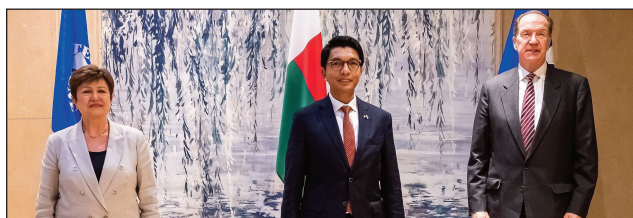
Ny Filoha Rajoelina tany Washington, Etazonia.