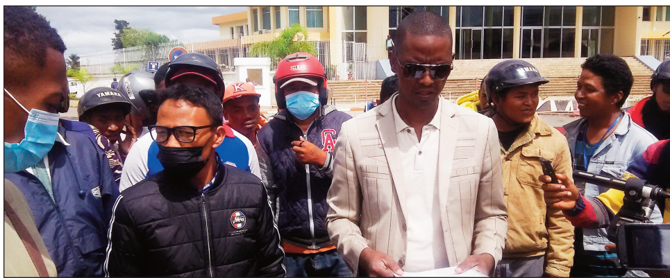
Ireo avy amin'ny fikambanana AKD.