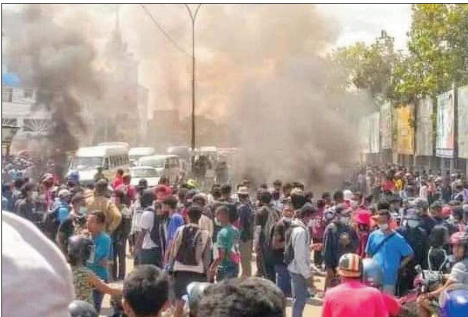
Ny hetsiky ny mpianatra tetsy amin'ny ENS Ampefiloha omaly.