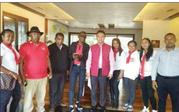
Ireo mpitarika ny antoko TIM avy any amin'ny faritra Bongolava teny Faravohitra.