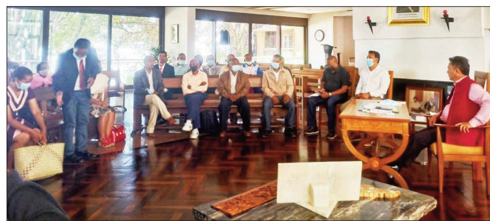
Ny Dis-TIM Manjakandriana, niarahaba ny filoha Ravalomanana teny Faravohitra.

Tsy diso anjara tamin'ny fiarahabana tratry ny taona ny filoha Marc Ravalomanana, filoha nasiônaly, sady filoha mpanorina ny antoko Tiko i Madagasikara (TIM), teny Faravohitra, ny Dis-TIM any amin'ny distrikan'i Manjakandriana faritra Analamanga. Afak'omaly izy ireo, no tonga niarahaba sy nirary soa ho an'i Dada noho ny Asaraman'ny taona vaovao. Voasolotena nandritra izany ireo kaominina mandrafitra ny distrikan'i Manjakandriana, na ny avy any amin'ny tapany avaratra : Vakini-mananara, na ny avy amin'ny tapany atsimo :