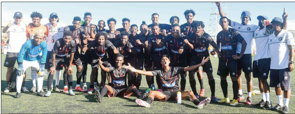
Ny Fosa Juniors Boeny ankehitriny.

Tontosa tamin'ny asabotsy 5 sy alahady 6 martsa 2022 lasa teo ny andro faha-11 amin'ny fifaninanana baolina kitra "Orange Pro League 2021/2022" karakarain'ny CFEM izay nahazoana vokatra toy izao : Uscafoot 1-1 Ajesaia, Tia Kitra Fc 1-0 Five Fc, Fosa Juniors Fc 2-1 Jet Kintana, As Fanalamanga 1-0 Cosfa, A.Dato Fc 3-1 Jfc Toliara, Disciples Fc 2-2 Zanakala Fc, Elgeco Plus 8-3 3Fb Toliara, Mama Fca 0-0 Cffa. Vokatry'izay dia lasa ny Elgeco Plus indray no mitarika an'isa vonjimaika manana isa 20 (+10) arahin'ny Disciples Fc isa 19