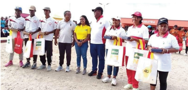
Mpilalao nahazo amboara teny Tongarivo.