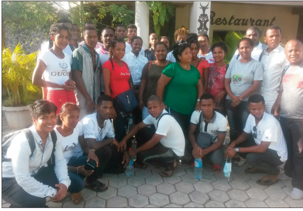
Ny sasany amin'ireo mpiaro ny zon'olombelona any Menabe.

Notanterahana ny herinandro teo ny fifanaovan-tsoniam-piaraha-miombon'antoka amin'ny fanatanterahana ny tetikasa Rary Aromada, ka tafatsangana ny rafitra mpanaramaso ny zon'olombelona. Isan'ireo faritra sivy iasan'ny tetikasa Rary Aromada ny faritra Menabe, ka natsangana ny vondrona mpanaramaso ny fampiharana ny zon'olombelona, izay misandrahaka amin'ireo distrika dimy ato amin'ny faritra. Mizara telo mazava ny asa ho ataon'ireo vondrona tanora ireo, ka mijery ireo tranga tsy fanajana ny zon'olombelona sy manao fana dihadiana ary ny fitakiana ny fampiarana ny lalana. Ny Ong code Menabe no mitan-tsoroka ny fanatanterahana ity tetikasa Rary Aromada ity, izay hiara-hiasa amin'ireo