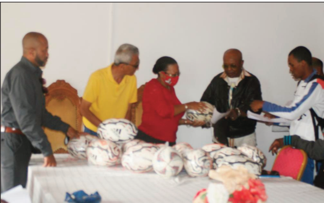
Ny lanonana teny Faravohitra ny alahady teo.