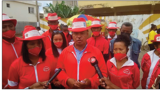
Ireo avy amin'ny Randrana Sendikaly.