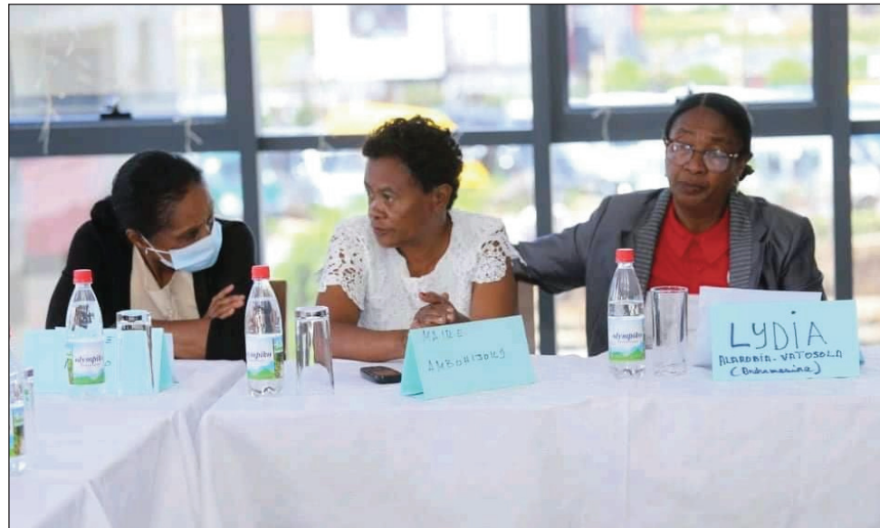
Ireo Vehivavy TIM Analamanga, niomana hizara fanomezana ho an'ny traboina teny Alakamisy Antananarivo Atsimondrano.