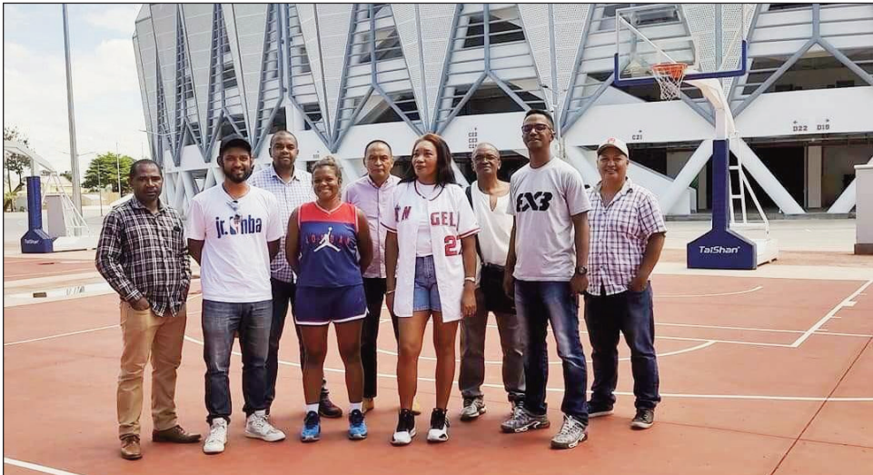
FMBB teny amin'ny Kianja Barea.

Efa vonona ny FMBB "Federation Malagasy de Basket Ball", mpikarakara amin' ny hetsika fankalazana ny 8 martsa 2022 eto Antananarivo, izay hiarahany amin'ireo mpiara-miombon'antoka aminy samihafa. Eny amin'ny Kianja Barea Mahamasina, no fotoana hanatanterahana an'izany amin'io talata 08 Martsa 2022 io ka hisy ny : -Diabe firaisankina ho fankalazana ny andron'ny vehivavy, -Lalao basikety 3x3 ho an'ny "Vétérans" Vehivavy, -Lalao baskety 3x3 ho an'ny ankizy U12 F, U14F, -Fanangonana ireo fa-