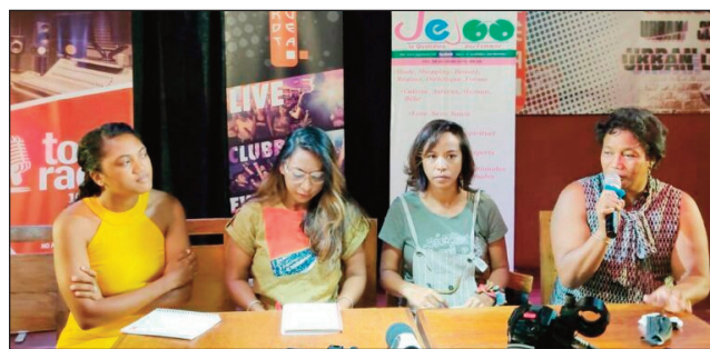
Tafa tamin'ny mpanao gazety, nataon'ireo mpikambana, amin'ny biraon'ny fikambanan'ny Vehivavy Mpanao Gazety eto Madagasikara.