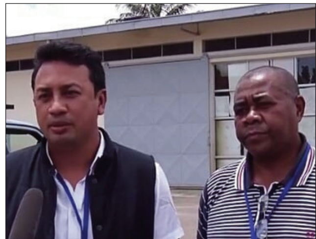
Ny avy amin'ny antoko TIM teny amin'ny CENI omany.