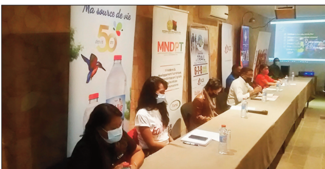
Ny sasany amin'ireo mpikambana ao amin'ny Utop Madagasikara.

Hifarana amin'ny 19 Martsa 2022 ho avy izao ny fisoratana anarana, amin'ny hetsika arapanatanjahantena « Le trail aux milles sourires » andiany faha 13, izay karakarin'ny fikambanana UTOP Madagascar. Fifaninanana hazakazaka lavitr'ezaka, izay hanomboka ny 06 May 2022 ka hatramin'ny 08 May 2022 ho avy izao, ahitana karazana fifaninanana miisa 6. Voalohany ny fifaninanana antsoina hoe « Ultra-trail », izay manana halaviran-dalana 126 Km: mampitohy an'i Marozevo (Mandraka) mankaty Antananarivo ary misy mizara sokajy telo ity fifaninanana ity, ao anatiny izany ny fifaninanana olondrery, ny olon-droa ary farany ny « Relais » miaraka amin'ny olona 4. Ny faharoa dia ny fifaninanana antsoina hoe « Le 6 Trail », izay manana halavin-da-