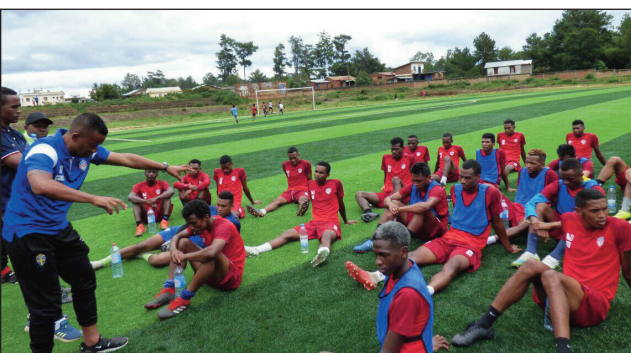
Ny ekipan'ny Disciples Fc.

fifaninanana baolina kitra "Orange Pro League 2021/2022".