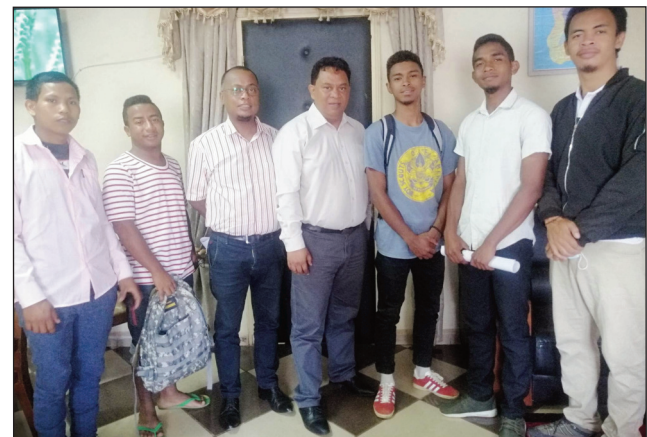
Ny solontenan'ireo tanora amin'ny Tily Menafify Ivato Seranana, nihaona tamin'ny mpitantana ny kaominina Ivato.