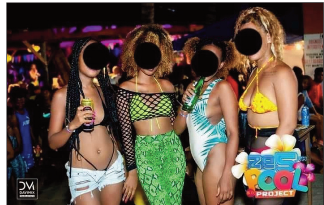
Hetsika mamofady tao amin'ny Hotel de la Baie Antsiranana.