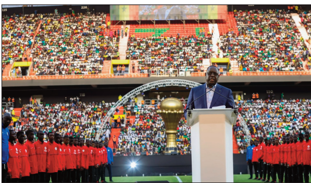
Fitokanana ny kianja manara-penitr'i Sénégal.

Filoham-pirenena maneran-tany maro (Adama Barrow, président de la Gambie, Umaro Sissoco Embaló, président de la Guinée-Bissau, George Weah, président du Libéria, Paul Kagame, président du Rwanda, et Recep Tayyip Erdogan, président de la Turquie) niaraka tamin'ny filohan'ny FIFA Gianni Infantino sy filohan'ny CAF Patrice Motsepe ary mpilalao baolina sangany Afrikana maro no nanotrona ny fitokanana ôfisialin'ny kianja fanaovambaolina vaovao "Stade du Sénégal/Abdoulaye Wade." na koa "stade olympique de Diamniadio" tany Diamniadio (30 km miala an'i Dakar renivohitra), tamin'ny alatsinainy 21 febroary 2022 lasa teo.