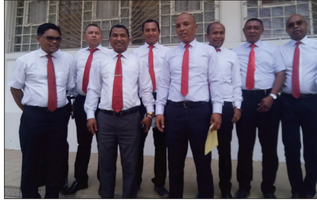
Ireo parlemanta TIM, nitafa tamin'ny mpanao gazety teny Tsimbazaza omaly.

Ny fepetra rehetra horaisina manandrify izany dia nankinina tanteraka eo amin'ny distrika isanisan'ny avy. Ny fanamarinana ny mombamomba ny mpifidy tsirairay voakasik'izany, na ny fanitsiana tokony ho atao amin'izany, dia tsy maintsy noresahina tao amin'ilay lisitra natolo-