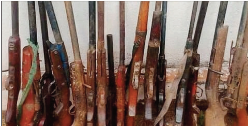
Basy azo tany Ambatofinandrahana.