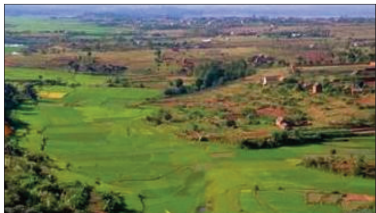
Lalana mankany Mangabe, toerana handehanan'ireo mpandray anjara amin'ny randonnée Ortana volana martsa.

Ho tanterahana any Mangabe, tendrombohitra any Ambohimanga Avaradrano, ny randonnée, na ny fanatanjahantena laroina fizahantany karakarain'ny Ortana, na ny Ofisim-Paritra momba ny Fizahantany amin'ny faritra Analamanga. 20 km mahery eo, any avaratr'Antananarivo, no misy an'i Mangabe, toerana manana ny tantarany ara-kolontsaina, sy eo amin'ny fivavahana nentin-drazana. Ahitana fasana olona nanana ny naha-izy azy tamin'ny nanjakan'ny Mpanjaka Andrianampoinimerina koa any Mangabe dia ny fasan'Andriantsivongo sy Andriantandro, izay mpanandro sy astrôlôgy tamin'izany fotoana izany. Hamakivaky tanimbary, lohasaha sy havoana ary tontolo maitso mavana amin'izany faritra izany, ireo handray anjara amin'ity randonnée Ortana volana martsa ity, 9 km ny lalana handehanan'ireo mpandray anjara. Eo Antaninarenina no fiangana ny sabotsy 26 martsa maraina io, hihazo an'Ambohimanga ireo mpandray anjara mialohan'ny dia tongotra laroina fizahantany.