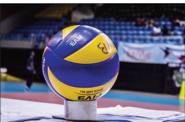
Baolina, ho an'ny taranjam-panatanjahantena volley-ball.

Hofaranana eny amin'ny kianja Akany Sambatra Itaosy, amin'ny alahady 27 martsa 2022 ho avy izao, ny famaranana ny taom-pilalaovana 2021, ho an'ny ligin'Analamanga eo amin'ny taranja volley-ball. Ny lalao famaranana ny fiadiana ny ho tompon-dakan'Analamanga eo amin'ny sokajy 2DM, no hotanterahina amin'izany, ka hifanandrinan'ny ekipan'ny Cvb, sy ny ekipan'ny Asi, izay samy nandavo avy