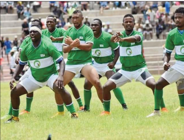
Ny Usa Ankadifotsy sy ny Cosfa Miaramila.