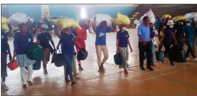
Ny fizarana fanampiana nataon'ny ONG TAK tetsy Mahamasina.