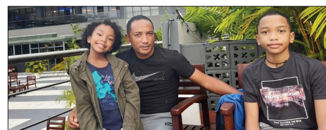
Santionan'ny delegasiôna malagasy any Egypta.