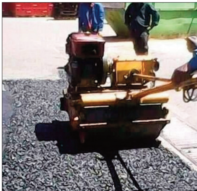
Ny fanamboaran-dalana any amin'ny kaominina Ivato Ambohidratrimo.