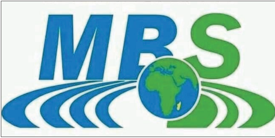
Ny sary famantarana ny radio sy ny televiziôna MBS.

Miha-maroko amin'izao fotoana ny fanehoan-kevitra avy any amin'ny faritra, noho ny nanapahana ny televiziôna MBS ao amin'ireo televiziôna satelita toy ny Canal Plus, Startimes, ny Parabole, ... Tena efa niharitra ela kosa izy ireo, ka ampy izay, araka ny fanambarana voaray. Mijaly izahay aty amin'ny faritra, mila vaovao tsy mitongilana hoy ihany ny fanambarana, ka mitaky ny hamerenana ny televiziôna sy ny Radio MBS ao amin'ny Canal Plus, ny Startimes ary ny Parabole. Tsy mahazaka demokrasia izao fitondrana izao, ny MBS dia efa nodorana sy nopotehina ny fiandohan'ny taona 2009, ny 26 jany, nefa tafarina ihany. Tonga teo amin'ny fitondrana ny Filoha Rajaonarimampianina Hery dia nanaiky ny nanokafana indray ity radio televiziôna MBS ity. Fotoana fohy taorian'ny nanomezan'ny Fitsarana Avo momba ny Lalampananorenana ny fahefana