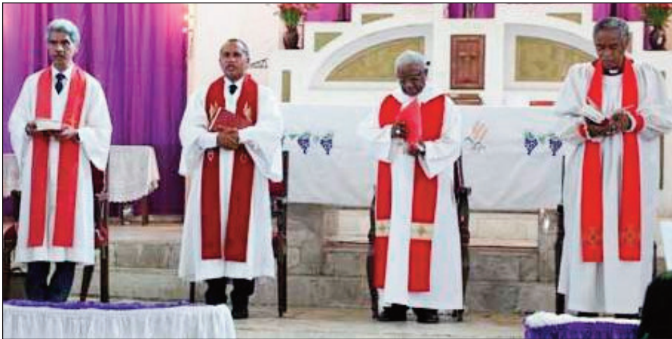
Ireo filoham-piangonana 4 ao amin'ny FFKM.

Ho fisorohana ny olana mety hitranga amin'ny fifidianana rehetra ho avy eto amin'ny firenena, mangataka amin'ny tompon'andraikitra mahefa ny FFKM: Fiombonan'ny Fiangonana Kristiana eto Madagasikara, ho afaka hanangana fikambanana hanara-maso ny fifidianana eto amintsika. Mangataka ny FFKM mba ho afaka hanangana fikambanana manara-maso fifidianana toy ny KMF/CNOE, ny Safidy, ... Manoloana ny fiahiana halabato toa izay efa niseho hatram'izay, dia mangataka ny FFKM mba hitoraka izay mety ho olana goavana hitranga eto amin'ny Firenena. Ao anatin'ny adidy sy andrai-