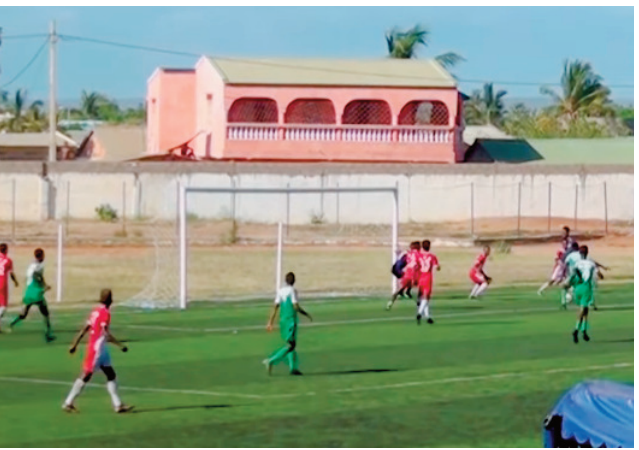
Lalao Orange Pro-League 2022.

Fararonan'ny fampidirambaolina maty tamin'ny andro faha-12 ny fifaninanana "Orange Pro League 2021/2022", notontosaina tamin'ny faran'ny herinandro lasa teo. Baolina nahatratra 33 no tafiditra tamin'izany. Vokatra rehetra azo : As Fanalamanga 1-2 Uscacafot, Cosfa 1-1 Tia Kitra Fc, Five Fc 1-5 Fosa Juniors Fc, Jet Kintana 1-5 Ajesaia, Cffa 5-0 A.Dato Fc, Mama Fca 1-0 3Fb To-