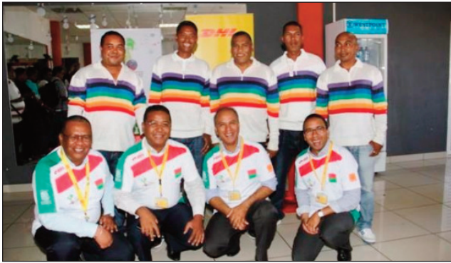
Mpanao tsipy kanetibe Malagasy.

Toy izao indrindra ny fanambarana nataon'ny kômité mpanatanterak'ny FIPJP mikasika an'izany : " Suite au comportements