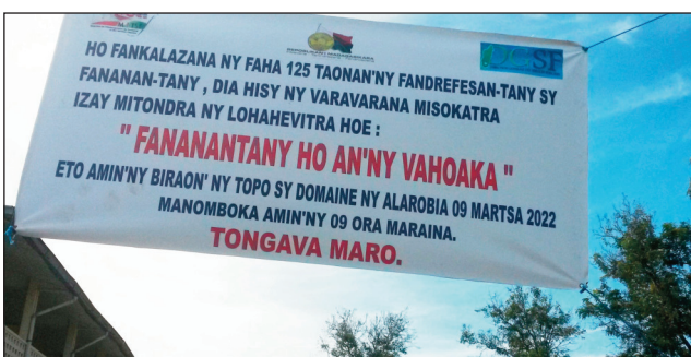
Hetsika momba ny faha-125 taonan'ny fananantany sy ny fandrefesantany tany Morondava.

Toy ny faritra rehetra dia nankalaza ny famaranana ny faha-125 taonan'ny fandrefesantany sy ny fananan-tany teto Madagasikara, ny tato Menabe. Nivoitra tamin'izany, fa isan'ireo olana telo lehibe ato Menabe ny olan'ny fananan-tany, izany no nisy dia noho ny tsy fahaizana mitantana, sy ny tsy fisian'ny serasera teo amin'ity sampan-draharaha ity, izay no nanaovana ny varavarana misokatra nandritra ny fan-