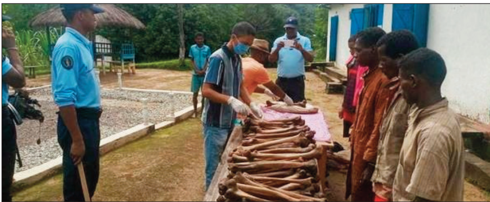
Taolam-paty sarona tany Anosibe An'Ala.