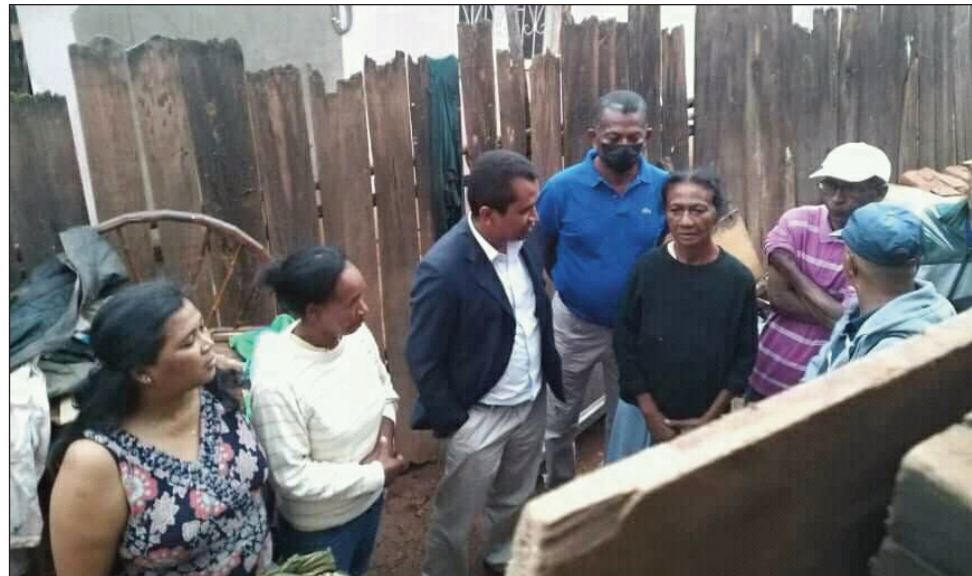
Fanabeazam-boho ny antoko TIM tao Ankoririka, Kaominina Morarano Chrome, distrikan'Amparafaravola, faritra Alaotra Mangoro ny faran'ny herinandro teo.