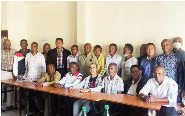
Fivorian'ireo "Maîtres de Salles" karaté-do.

Nohamafisina ary nodinihan'izy ireo tamin'izany ilay fanapahan-kevitra nataon'ireo "Liges 12" ny amin'ny tsy fandraisana anjara intsony, amin'ny