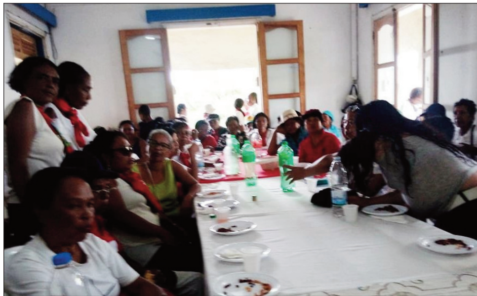
Ireo vehivavy ao amin'ny Boriboritany faha-3, sy ny Vehivavy TIM ao amin'ity boriboritany ity, nanadio lalankely ho fanamarihana ny andron'ny 8 martsa.