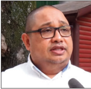
Ny depiote voafidy avy amin'ny antoko TIM ao amin'ny Boriboritany faha-3.

Naneho ny heviny mahakasika ny raharaham-pirenena amin'izao fotoana, indrindra ny mahakasika ilay resaka fitsipaham-pitokisana ny governemanta, na fanalana ny governemanta, ny depiote voafidy tao amin'ny Boriboritany faha-3, avy amin'ny antoko Tiako i Madagasikara (TIM). Miantso ireo Solombavambahoaka naman aizy, mba hanohana amin'ny fitsipaham-pitokisana, nambanan'ny ao amin'ny Vondrona Parlemantera TIM. Nambanan'ity olomboafidy ity fa: "tsy manana eritreritra hiditra anaty fiarahamitantana ny governemanta