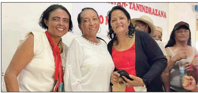
Vehivavy TIM Analamanga sy Atsinanana miara-dia.