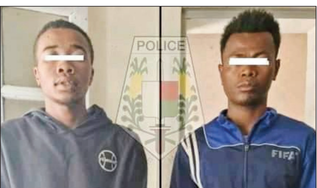
Ireo roalahy mpangalatra moto tratra.