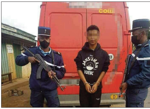
Ilay lehilahy nandona nahafaty olona tany Manjakandriana (afvoany), nefa nitsoaka avy eo.

Lalampirenena faharoa tany Manjakandriana, vehivavy iray 35 taona teo no maty nofaohan'ny fiara, nandositra ilay mpamily nahavanon-doza tamin'izany lozam-pifamoivoizana izany. Fiara fourgon iray avy any Toamasina nizotra tamin'ny lalam-pirenena faharoa, teo Volavia Manjakandriana ny talata teo, no nifaoka olona miisa efatra, tamin'ny 05 ora maraina. Vehivavy iray 35 taona no maty teo noho eo, ary olona telo hafa naratra mafy. Efa nihazo ny sisin-dalana izy ireo raha ny fantatra, saingy voafaokan'ilay fiara izay voalaza fa nan-