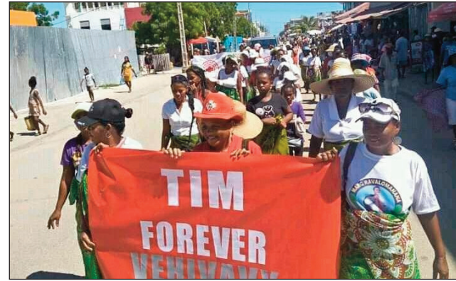
Ny Vehivavy TIM Morondava, nandray anjara tamin'ny filaharamben'ny 8 martsa, tany amin'ny renivohitry ny faritra Menabe.

Niavaka tsy toy ny isan-taona ny fankalazana ny 8 Martsa, ho an'ny renivohitry ny faritra Menabe, satria dia tsy nandaitra intsony ny teritery fanaovana ny loko volomboasary, fa samy nanao izay loko tiany ireo fikambanana sy sampan-draharaha ary saika hita nisongadina mihintsy aza ny loko mena, ohatra amin'izany ny vehivavy avy ao amin'ny fiadidiana ny faritra Menabe dia nisafidy ny loko mena, ireo antoko sy fikambanana manohana ny fitondrana dia tsy sahy niseho masoandro mihintsy tamin'ity indray mitoraka ity, raha nijoro sy navitrika kosa ny Vehivavy TIM teto Morondava ary nandray anjara tamin'ny hetsika rehetra izay nentina nankalaza ity 8 Martsa 2022 ity. Nanontany tena ny rehetra raha saika hijery volomboasary midorehitra, ary samy nilaza hoe efa tsy misy manohana fitondrana afa- tsy ny solombavambahoaka ve sisa ato Morondava? sa kosa leo didy jadona ireo vehivavy? Tao moa ireo nilaza fa maro loatra ny fampantanenana poakaty