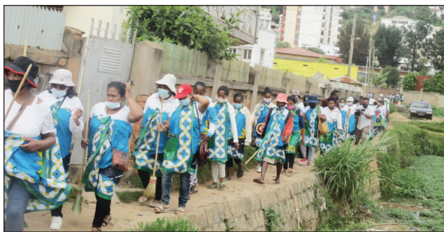
Ireo Vehivavy TIM Boriboritany faha-3 sy ireo vehivavy ao amin'ity boriboritany ity, nanadio tanàna ny talata teo.

Tsy diso anjara tamin'ny fanamarihana ny andron'ny 8 martsa koa ny Vehivavy TIM ao amin'ny Boriboritany faha-3 eto Antananarivo Renivohitra. Fanadiovana lalankely tamin'ny fokontany miisa 3 tao amin'ity Boriboritany ity no nataon'izy ireo nandritra izany fanamarihana ny andro eran-tany iadiana amin'ny zon'ny vehivavy izany. Nanatantantana hetsika fanadiovana lalankely faobe teny amin'ny fokontany Ampandra-