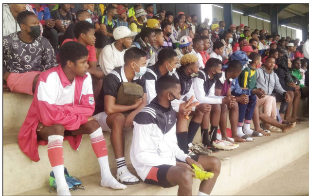
Mpilalao rugby U20 nofantenana teny amin'ny kianjan'ny Makis.