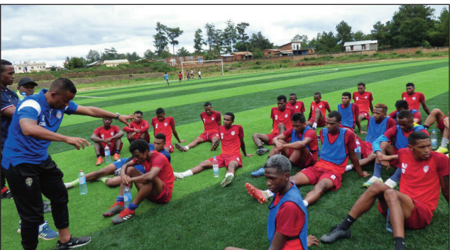
Ny ekipan'ny Disciples Fc.