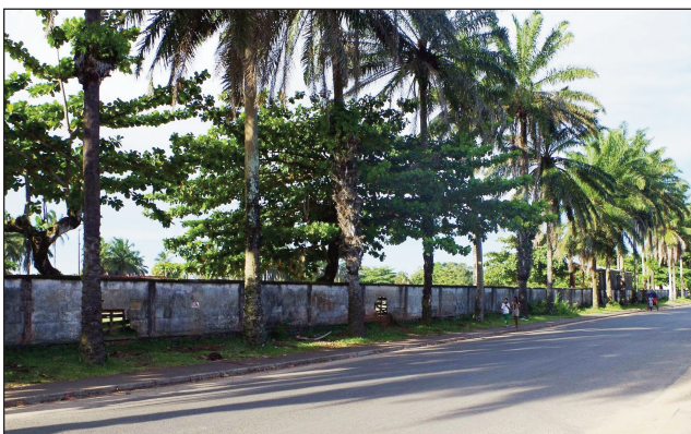
Santionan-dalana any Manakara.

Raikitra fa any Manakara ihany, no hatao ny fifaninanana athletisma fiadiana ny ho tompo-dakan'i Madagasikara, amin'ny « Cross Country ». Amin'ny sabotsy 12 martsa 2022 ho avy izao no hanatanterahana an'izany, ka ny hazakazaka 2km, 4km, 6km, 8 km ary 10 km arakaraka ny sokajin-taona, sy ny "relais inter-quartier", no hifaninanana.