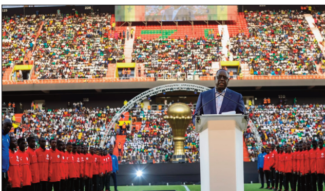
Fitokanana ny kianja manara-penitr'i Sénégal.

Filoham-pirenena maneran-tany maro (Adama Barrow, président de la Gambie, Umaro Sissoco Embaló, président de la Guinée-Bissau, George Weah, président du Libéria, Paul Kagame, président du Rwanda, et Recep Tayyip Erdogan, président de la Turquie) niaraka tamin'ny filohan'ny FIFA Gianni Infantino sy filohan'ny CAF Patrice Motsepe ary mpilalao baolina sangany Afrika maro no nanotrona ny fitokanana ôfisialin'ny kianja fanaovambaolina vaovao "Stade du Sénégal/Abdoulaye Wade." na koa "stade olympique de Diamniadio" tany Diamniadio (30 km miala an'i Dakar renivohitra), tamin'ny alatsinainy 21 febroary 2022 lasa teo.