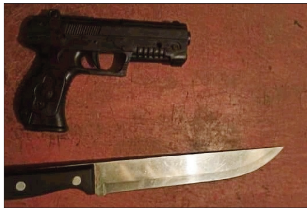
Ireo fitaovam-piadiana nentin'ilay nanafika cash point.

Tany Antsirabe faritra Vakinankaratra, no nitranga ny fanafihana, tratra ilay lehilahy nanafika cash point niaraka tamin'ny basy kilalao. "Cash point" iray teo avaratry ny hopitaly Ave Maria ary atsimo kelin'ny Hôtel Diamant Antsirabe afak'omaly, no nisy nanafika tamin'ny 4 ora sy 10 minitra tolandro teo ho eo. Lehilahy iray 28 taona no nanao izany niaraka tamin'ny basy kilalao sy antsy iray. Tsikaritr'ilay tompon-tsena anefa ity jiolahy ity, ka niantso vonjy avy hatrany izy. Taitra tamin'izany ny