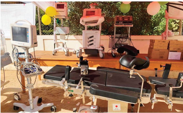
Ireo fitaovana samy hafa momba ny fahasalamana, nomen'ny Ambasadin'i Japon ny hopitalin'i Tanambao any Toliara.