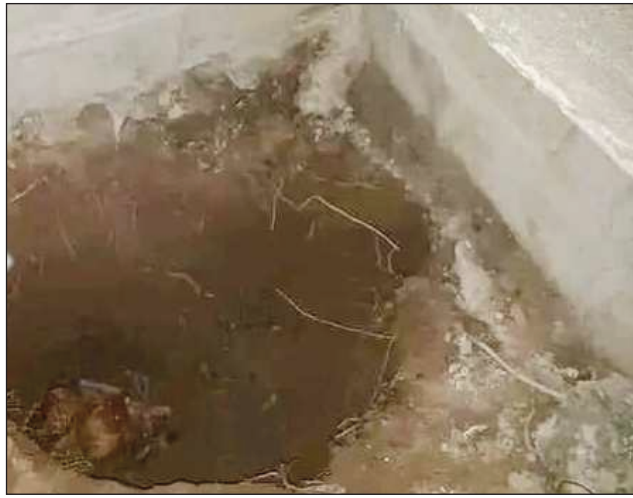
Fasan'ny Mpanjaka vaky tany Ambanja.