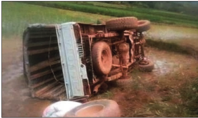
Ilay fiara mpitatitra niharan-doza tany Vondrozo.

Noho ny haratsian-dalana, fiara iray no tapaka hisatra ary nivarina tany an-tanimbary, tany amin'ny distrikan'ny Vondrozo any amin'ny faritra Atsimo Atsinanana. Olona miisa 4 no naratra mafy vokatry izany. Distrika mbola misedra olana amin'ny haratsian-dalana i Vondrozo. Itrangana lozampifamoivoizana matetika ny lalam-pirenena faha 27, na fahavaratra na main-tany. Ireo fiara mpitatitra olona no tena lasibatra, ankoatra ny fiara madinika sy kamiao mpi-