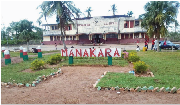
Ny tanànan'i Manakara, renivohitry ny faritra Fitovinany.

Vonona tanteraka i Manakara any amin'ny faritra Fitovinany manontolo, amin'ny fandraisana ny hetsika atletisma fiadiana ny tompon-dakan'i Madagasikara, na «Championnat de Madagascar de Cross Country 2022 », araka ny fampitam-baovao nalefan'ny Tale Teknikan'ny FMA, Rambeloson Hery, avy any an-toerana. Fantatra ary fa vita omaly zoma 11 martsa 2022, tao amin'ny efitrano malalaky ny biraon'ny kaominina ao