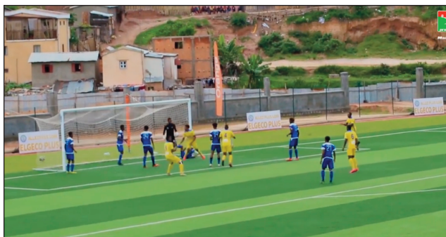
Lalao Orange Pro League 2021/2022.

Noho ny fandalovan'ny andro ratsy Batsirai teto amin'ny Nosy dia niova avokoa ny fandaharan-dalao baolina kitra Orange Pro League 2021/2022 andro faha-7, izay saika notanterahina tamin'ny faran'ny herinandro lasa teo (sabotsy 5 sy alahady 6 febroary 2022 ka lasa : Talata 08 febroary 2022 12:00-Ajesaia # Uscafoot (kianja Complexe Sportif Cnaps Vontovorona), 14:30-Jet Kintana # Fosa Juniors Fc (kianja Complexe Sportif Cnaps Von-