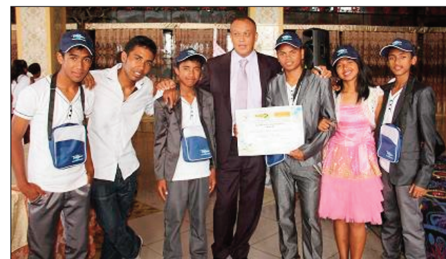
Ny Groupe 3 Mi, miaina ny finoana an'Andriamanitra.