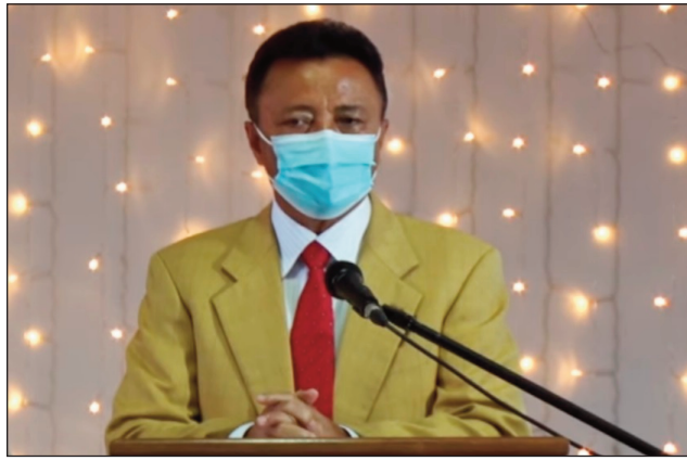
Ny filoha Marc Ravalomanana, filohan'ny RMDM.

Manoana ny voina mihàtra amin'ny firenena amin'izao fotoana izao, vokatry ny andro ratsy Ana, sy ny rivodoza Batsirai, misy ny fanambarana avy amin'ny filoha Marc Ravalomanana sy ny RMDM, Rodoben'ny Mpanohitra ho an'ny Demokrasia eto Madagasikara: "nandalo fotoan-tsarotra tokoa ny firenena vokatry ny fandalovan'ny rivodoza roa nifanesy dia Ana sy Batsirai. Nisy ireo havantsika izay namoy ny ainy vokatry ireo rivodoza ireo. Amin'ny anaran'ny tenako manokana, sy ireo mpikambana rehetra ato amin'ny RMDM dia miara-ory aminareo fianakaviana sy mitondra ambavaka anareo rehetra hatrany izahay. Miarahaba ihany koa ny Malagasy tsy maty fo aman'aina, satria tena mahery tokoa raha iny rivodoza Batsirai iny. Maro ny faritra no nitondra faisana vokatry izany ary betsaka ny zavatra simba, na ireo fananana iombonana izany na ihany koa ireo fananan'ny fianakaviana tsirairay toy ny trano, ny entana tao antokantrano, ny fambolena sy fiompiana, sns... Mankahery hatrany ny vahoaka Malagasy aho mba tsy ho kivy ary tsy hitanondrika fa hitraka sy hiatrika kosa, ireo fanarenana ny simba. Manao antso avo ihany koa amin'ny fifanomezan-tanana eo amin'ny tsirairay any amin'izay toerana misy anareo tsirairay any. Homba