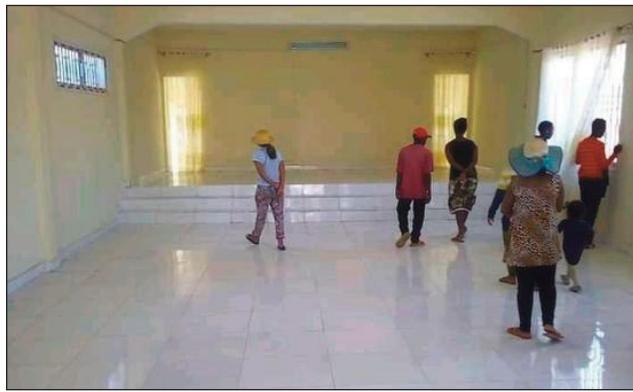
Ny Tranompokonolona Mandrosoa Ivato, nandraisana traboina tany an-toerana.