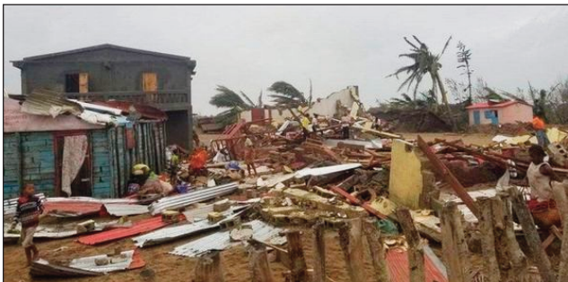
Fahapotehana vokat'i Batsirai.

Namely mafy tany amin'ny faritra no-lalovany ny rivo-doza Batsirai, nandalo teto amintsika ny faran'ny herinandro teo. Araka ny tarehi-marika farany navaokan'ny BNGRC, na ny Birao Nasionaly mpitantana momba ny loza sy ny tandindon-doza, nahatratra 20 hatreto no namoy ny ainy, vokat'ny rivodoza iny. Miisa 69102 ireo voatery nafindra toerana, izay tokenrano miisa 15489. Miisa 55421 ireo traboina, izany hoe tokenrano miisa 10515.