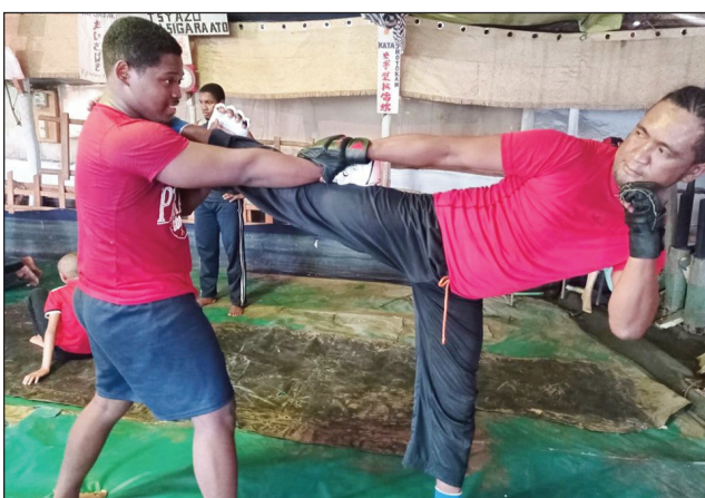
Ny haiady iarahana amin'ny TCDCCL.