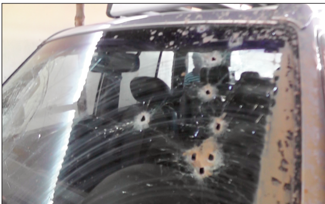
Ilay 4x4 nisy nanafika.

Miseho lany ny tsy fandriampahalemana any amin'ny distrikan'i Belo Tsiribihina, faritra Menabe iny. Karana iray no voatafitry ny jiolahy, lasa tamin'izany ny vola mitentina 150 tapitrisa Ar. Ny alarobia maraina teo, tokony tamin'ny 11 ora dia mpandraharaha iray avy ao Belo sur Tsiribihina, handeha hanao versement aty Morondava, no notafihan'ny jiolahy tao amin'ny lalam-pirenena faha-8a, mampitohy an'i Belo sur Tsiribihina sy Morondava. Tao Asakaly, no nisy nanakana ny fiara 4x4 iray, voatifitra avy hatrany ilay karana nitondra ny fiara, izay mpampanofo fiara, avy hatrany dia nandroba ireo tao