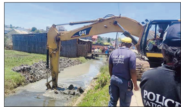
Ny fanadiovana sy fandalinana lakandrano, nataon'ny kaominina Alasora.