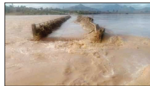
Ny fanamboarana ny lalana tapaka sy simba, tao aorian'ny fandalovan'i Batsirai.

radier an'i Bevilany. Rehefa midina ny rano vao afaka mandeha ny mpifamoivoy. RN 2 : Moramanga - Brickaville, PK 184+300, izay nisy ny hazo nianjera ary efa nesorin'ireo fokonolona teo amin'ny manodidina. RNS 12: Manakara - Farafangana, PK 71 sy PK 98 ary ny PK 204+200, fanaisorana ny hazo kinitina nianjera izay nibahana ny arabe. RN 42: PK 14+ 500 Fianarantsoa - Isorana; fi-