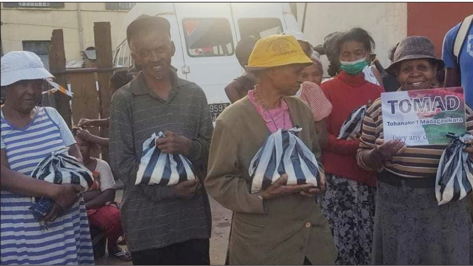
Olona traboina, anisan'ny nahazo fanampiana tamin'ny fikambanana ToMad.