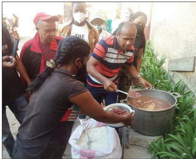
Ny fanomezana sakafo masaka ho an'ireo traboina, nataon'ny depiote Todisoa sy ny mpiara-miasa aminy.