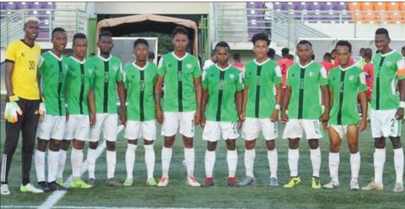
Orange Pro League 2021/2022.