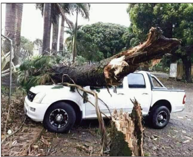
Ny fahapotohana vokatry ny rivodoza Batsirai, tatsy amin'ny Nosy Maorisy.

Na izany aza efa nanimba zavatra maro tany amin'ny faritra maro tany an-toerana izy. Eo amin'ny 17 km/ora eo ny fikisahany, arak'izany mihamanatonana hatrany ny morontsirak'i Madagasikara izy, tao aorian'ny fandalovany tatsy amin'ireo Nosy rahavavy. Mahery vaika ny rivotra sy ny tafiotra entiny, satria ma-