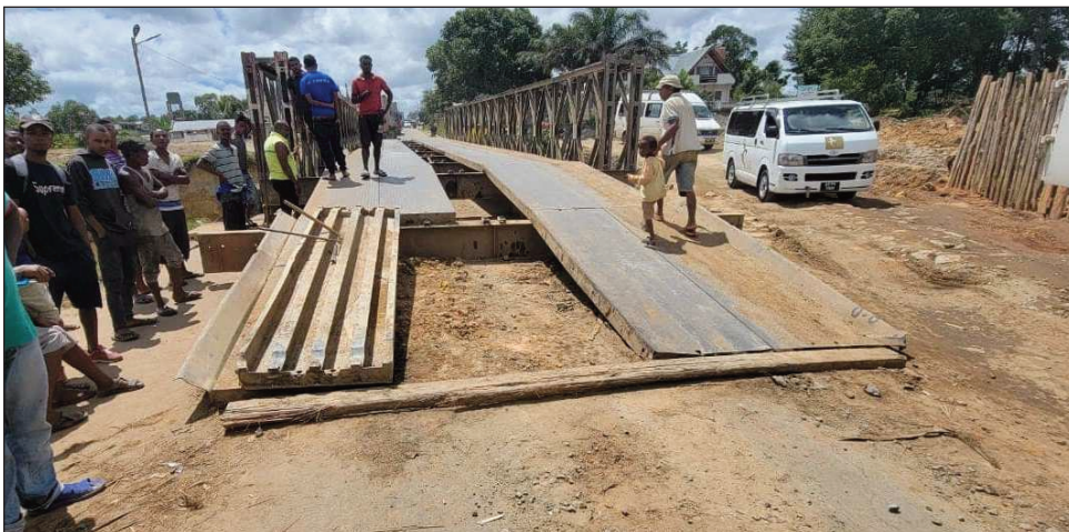
Ny fanamboarana amin'ilay Pont Bailey any Moaramanga faritra Alaotra Mangoro.

Misy fiatoana aloha ny fampiasana ilay Pont Bailey any Moramanga, mba hanatsarana ny fifamoivoizana amin'izany tetezana izany. Misy ny fanambarana avy amin'ny ministeran'ny asa vaventy mahakasika izay. "Ny Minisiteran'ny Asa Vaventy dia mampilaza antsika mpampiasa ny lalam-pirenena faharoa RN2, fa nohon'ny asa fanatsarana izay tsy maintsy hotanterahina manomboka ny 02 febroary 2022, eo amin'ny tetezana PK 108+600 Moramanga, dia hisy fiatoana ny fifamoivoizana any an-toerana. Ny asa fanatsarana atao dia ny fanamafisana sy ny fame-