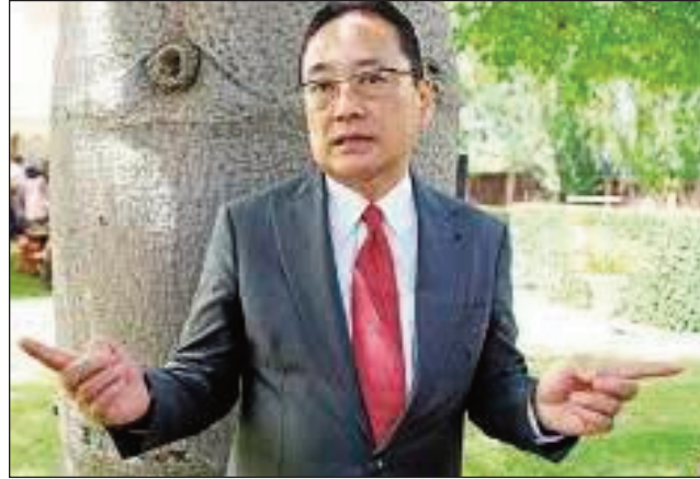
Ny Ambasadaoron'i Japon eto Madagasikara.

dia nanatsara hatrany ny fifandraisana niorina tamin'ny fifanajana i Madagasikara sy Japon. Samy nisitraka ny fiaraha-miasa mahomby amin'ny sehatra samihafa ny firenena roa tonta, izay tsy mitsaha-mitombo ary miitaratra izany fisaakaizan'ny firenena roa tonta eo amin'ny sehatry ny fampandrosoana. Miitatra amin'ny sehatra samihafa izany fiaraha-miasa izany, toy ny fiaraha-miasa amin'ny fampandrosoana, ny fiaraha-miasa eo amin'ny sehatry ny varotra, ny fampiasam-bola, ny kolontsaina, ny politika, ary indrindra ny fahasalamana. I Madagasikara sy Japon dia manome lanja izany fiaraha-miasa izany ary maniry ny hanamafy izany hatrany. Ary ho tarat'izany, no nanapahan-kevitra ny hankalazana ny faha-60 taonan'ny fifandraisan'ny Repoblikan'i Madagasikara sy i Japon amin'ny alalan'ny hetsika samihafa mety hitranga mandritra ny taona 2022. Noho izany, manasa ireo fikambanana rehetra misehatra ao anatin'izany fanamafisana ny fifamatorana sy fiaraha-miasa eo amin'ny Malagasy sy ny Japone izany ny masoivohony eto amintsika, mba hanamafika izany fankalazana izany.