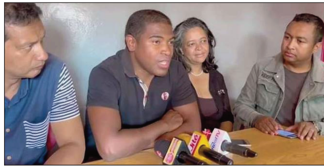
Ireo avy amin'ny Cellule de Crise ny asa fanaovan-gazety eto Madagasikara.

Nitaraina ireo mpanao gazety tany Toamasina ny talata teo, tamin'ny fidinana'ny Filoha Rajoelina tao amin'ny seranantsambon'ny Toamasina, fa nisy ny fanavakavahana ny mpanao gazety samy nanao ny asany nataon'ny tao amin'ny fiadidiana ny Repoblika sy ny tao amin'ny seranana. Noho izay antony izay, misy ny fanambarana avy amin'ny Cellule de Crise ny asa fanaovan-gazety eto amin'ny Port, nisy kosa ny voasakana noho ny antony tsy voazava hatreto tamin'ny fanaraha-maso io vaovao io. Tsy fahatomombanana teo amin'ny fandrindrana ve? Raha vao nianga dia tsy nisy ny sakana, tsy nisy ny toromarika ary tsy nisy ihany koa fakana taratasy manokana ny amin'ny fanaraha-maso io hetsika io ary maro ny mpanao gazety, no nandeha fiara sy moto tamin'izany. Rehefa tonga teo an-toerana anefa dia hita fa nisy ny tomponandraikitra voarara tsy afaka niditra tao amin'ity toerana ity. Ary teo koa no