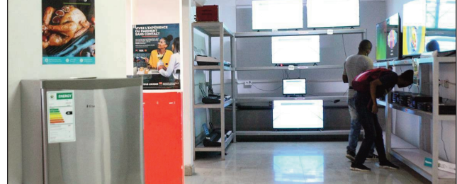
Entana samy hafa hita amin'ny Tranombarotra Baolai.

tra ny stock izay misy. Ary ny entana rehetra ato aminay dia 1er choix avokoa, izay natao hatrany mifanaraka amin'ny filana sy fahefa-mividin'ny besinimaro », hoy ny tompon'andraikitra. Marika avo lenta daholo no hita ao amin'ity Tranombarotra lehibe iray ity raha resaka fahitalavitra fisaka. Anisan'izany ny « Hisense », mpanohana ofisialy ny mondial 2022. Ny eto Madagasikara dia ny Tranombarotra « Baolai » no « Représentant officiel » an'ity marika ity efa ho 12 taona lasa izao. Mbola misy koa ny synthetiseur fer à lisser ( volo ), cuisinière à gaz sy électrique - amplibaffle sy subwoofer rechargeable- four micro