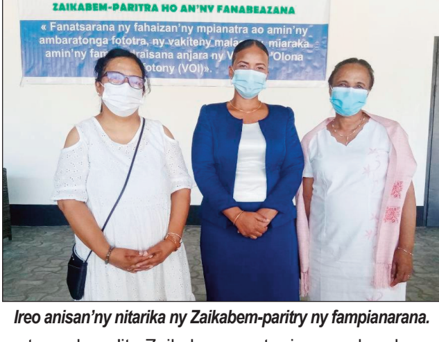
Ireo anisan'ny nitarika ny Zaikabem-paritry ny fampianarana.

Faritra fito am'ireo sivy no manantateraka Zaikabem-paritra, ho an'ny Fanabeazana amin'ity taom-pianarana 2021 sy 2022, ka natao tao amin'ny trano malalaky ny Pact Spat, Splendide, Marina, Miou Miou ary Calypso, ny Alakamisy teo. Maro ny mpandray anjara tamin'izany dia ny manampahefahana ny anivon'ny Governora, ny Préfet, ny Distrika rehetra sy ny Ben'ny tanàna ato anatin'ny Faritra Atsinanana, ny Cisco ato anatin'ny Fari-piadiam- pampianarana, ny Mpanolotsaina ny Fanabeazana, ny Lehiben'ny ZAP ary ireo Vondron'olona Ifotony (VOI) ary ny (VFF), no manantateraka izany Zaikabem-paritra, ho an'ny Fanabeazana amin'ity taom-pianarana 2021 sy 2022 ity izany. Ny Tafita sy ny Jica no mpa-