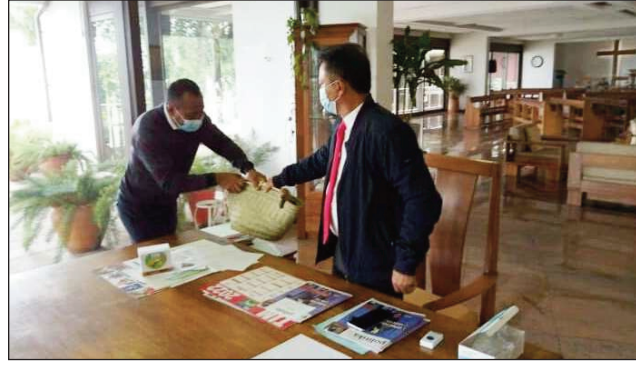
Ny avy amin'ny COMTIM Ambohitrimanjaka teny Faravohitra.

Mitohy hatrany ny fifampiarahabana tratry ny Asaramaniry ny taona vaovao, fiarahabana ny filoha Marc Ravalomanana, filohan'ny RMDM (Rodobenen'ny Mpanohitra ho an'ny Demokrasia eto Madagasikara), sady filoha nasisionalin'ny antoko TIM, eny Faravohitra. Ny alakamisy teo, ny COMTIM Ambohitrimanjaka distrikan'Ambohidratrimo indray, no nifampiarahaba tratry ny taona tamin'ny filoha Ravalomanana. Fifampidinihana teo amin'