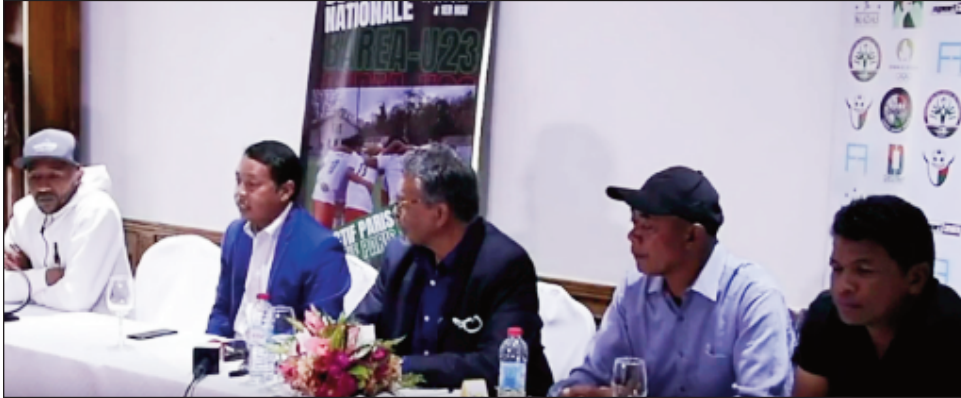
Ufiscam sy Madas teny Anosy.