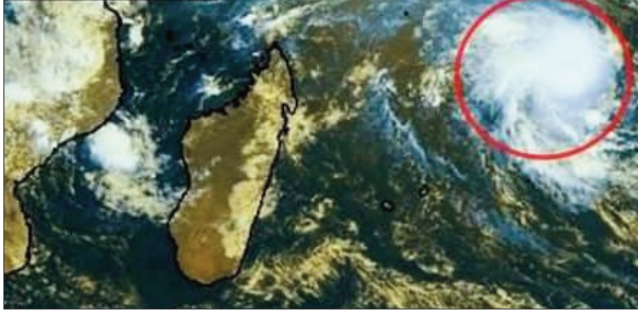
Sary avy amin'ny zanabolana, mahakasika ilay rivodoza Emnati.