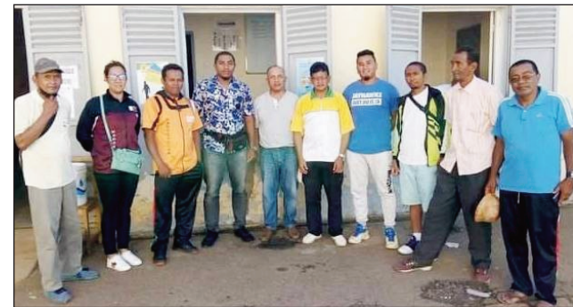
Mpikambana CRA Basketball vaovao any Vakinankaratra.