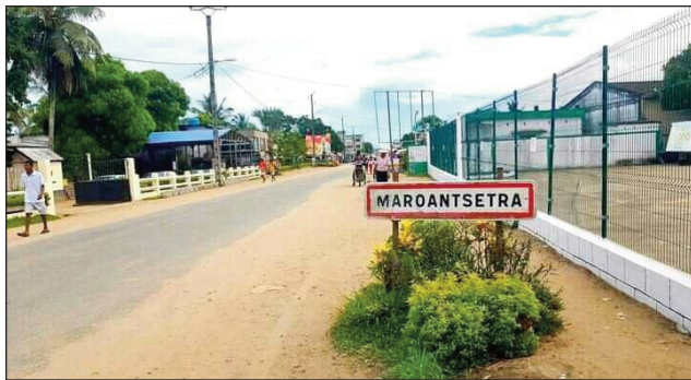
Ny tanànan'i Maroantsetra, renivohitry ny Antimaraoa.

Mangataka ny hanaovana azy ireo ho faritra vaovao: Faritra antsoina hoe Ambatosoa, ny any amin'ny distrikan'i Mananara Avaratra sy ny any amin'ny distrikan'i Maroantsetra, izay ao amin'ny Faritra Analanjirofo amin'izao fotoana araka ny fangatahana ataon'ireo zanak'ny faritra iny ireo. Raha ny distrikan'i Maroantsetra dia misy kaominina miisa 20, kaominina miisa 16 kosa ny ao amin'ny distrikan'i Mananara Avaratra. Arak'izany, hisy kaominina miisa 36 ity Faritra Ambatosoa, izay ho faritra