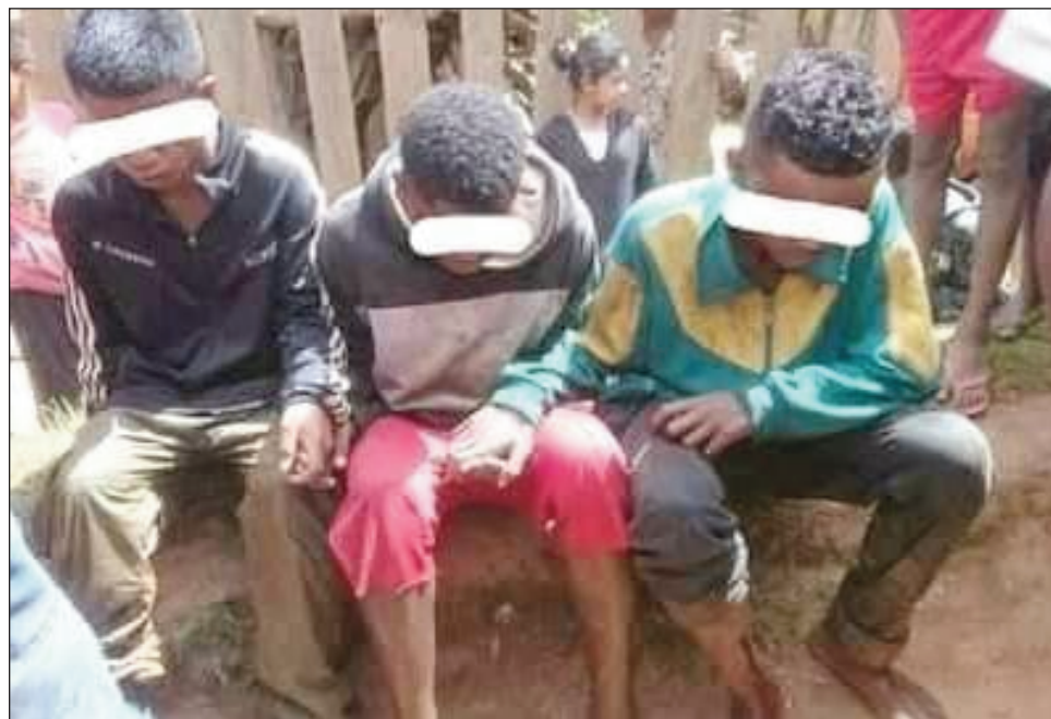
Ireo ankizy 3 lahy tratra nangalatra.

Tranga mampalahelo sy mahonena no nitranga tany Ambatolampy faritra Vakinankaratra, efa tena lalina tokoa ny fahantrana eto amintsika, ka mamaky trano hatramin'ny ankizy. Mirongatra ny vaky trano sy hala-botry ao Ambatolampy faritra Vakinankaratra raha ny fitantaran'ireo mponina any antoerana. Ny alakamisy teo, zazalahy kely miisa 3, no tratan'ny fokonolona saika hamaky trano. 17 taona ny zokiny indrindra amin'izy telolahy ireo. Raha araka ny fanazavana azo, efa fanaon'ireto farany ny toy izao, saingy izao izy ireo vao tratra. Efa natolotra ny manampahefana any antoerana izy telo mirahalaha ireto amin'izao fotoana. Ankizy amin'ny fotoanan'ny tokony hianatra nefa lasa mpangalatra, noho ny tsy firaharahan'ny fitondrana Rajoelina ny lafiny fampianarana sy fanabeazana eto amintsika no