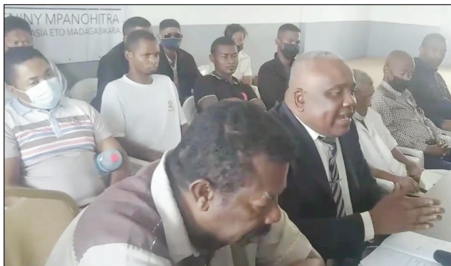
Ny avy amin'ny RMDM, nitafa tamin'ny mpanao gazety tetsy Bel'Air Ampandrana.