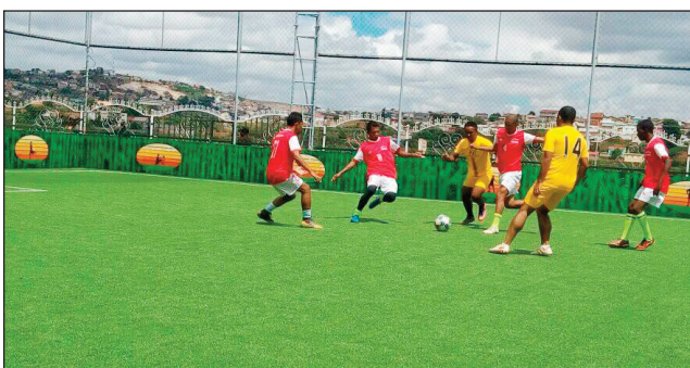
Lalao voalohany teny amin'ny kianja "Mada Terrain Behitsy".