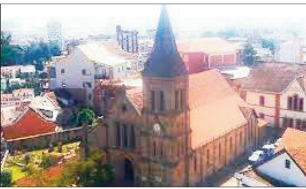
Ny FJKM Tranovato Ambatonakanga, hamaranana ny hetsika vontom-pitia.

Nisokatra ny alatsinainy faha-14 febroary lasa teo, ny hetsika vontom-pitia karakarain'ny foibe Fjkm. Tetsy amin'ny Fjkm Katedraly Analakely no nanokafana izany. Maharitra herinandro izy io, ka ny famaranana dia ho tantehina ao amin'ny Fjkm Tranovato Ambatonakanga. Isaky ny amin'ny 12 ora hatramin'ny 2 ora tolakandro no hanatantehana izany. Herinandron'ny fanarenana sy ny