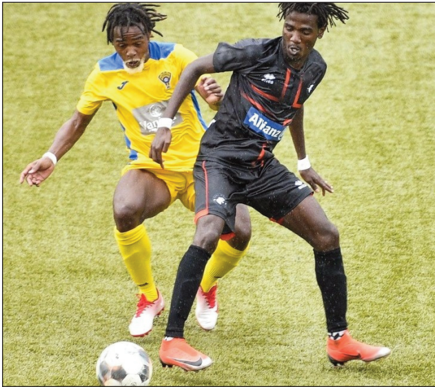
Lalao Orange Pro League 2021/2022.

Nandefa taratasy any amin'ny minisitera mpiahy MJS « Ministère de la Jeunesse et des Sports », tamin'ny fiandohan'ity herinandro itsahana ity ny CFEM, mba hangatahana fahazoan-dalana amin'ity minisitera ity, ny mba hanokafana ho an'ny Daholobe amin'izay an'ireo kianja rehetra mandray ny fifaninanana baolina kitra Orange Pro League 2021/2022, indrindra ireo kianja amin'ny Faritra Analamanga sy Matsiatra Ambony ary Vakinankaratra, izay mbola ao anaty fanarahana ny fepetra ara-pahasalamana tantetraka ankehitriny. Zary miteraka akony eo amin'ny toe-tsaina sy eo amin'ny toe-bola an'ireo klioba mandray anjara amin'ity OPL ity any amin'ireo Faritra vaolaza farany ireo