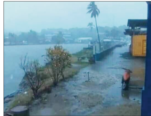
Ny fandalovan'ny rivodoza Dumako tany Sainte-Marie.