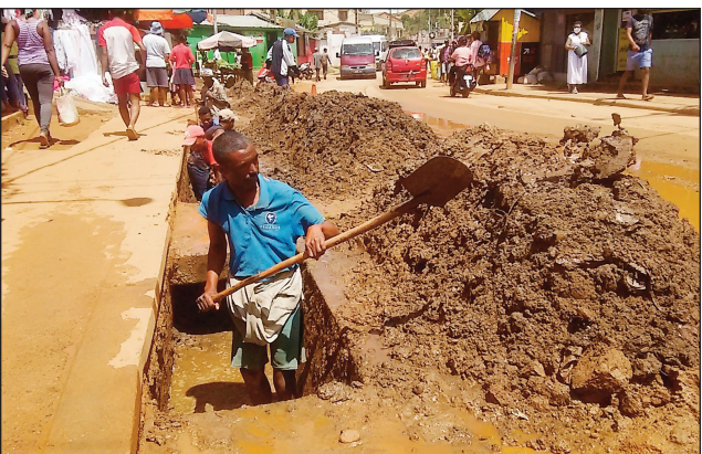
Ny fanadihovana lakandrano notarihan'ny depiote.