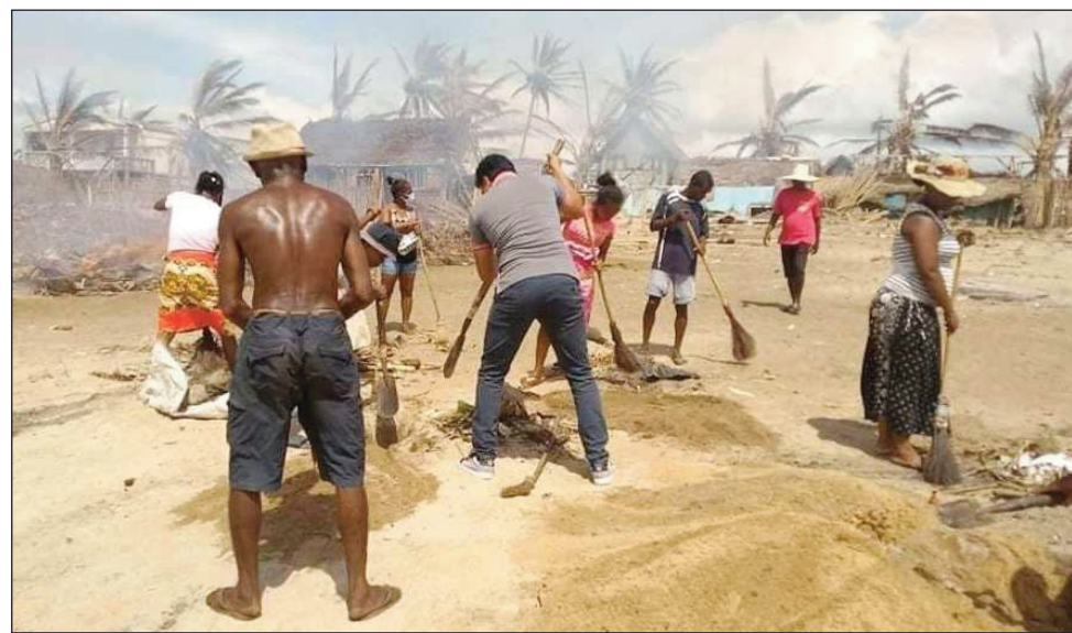
Tondra-drano tany Toamasina, vokatry ny rivodoza Dumako.