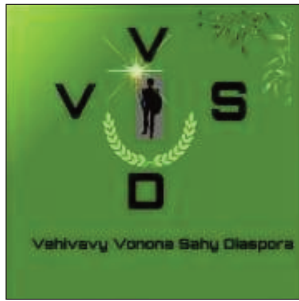
Ny sary famantarana ny VVSD.

H itohy hatrany ny hetsika sosialy ataon'ny VVSD, na Vehivavy Vonona Sahy Diaspora any ivelany. Mananjary any amin'ny faritra Vato-vavy, sy Vohipeno any amin'ny faritra Fitovinany indray, no hitondran'izy ireo fanampiana manaraka ho an'ireo olona sahirana traboina mila izany, noho ny rivodoza Batsirai nandalo farany teto amintsika. Misy ny fanambarana avy amin'ny VVSD mahakasika izay: «miharahaba anareo rehetra mpikambana, namana, mpiara-miombon' antoka Malagasy sy vahiny tsy ankanavaka. Fisaorana lehibe no atolotra anareo rehetra nitoto nahafotsy sy nahandro nahamasaka tamin'ny fanampiana natao ny faha 8 sy 9 february lasa teo, ny amin'ny fanampiana ireo mpiara-monina amintsika traboina any Madagasikara. Ho fanohizana ny asa so-