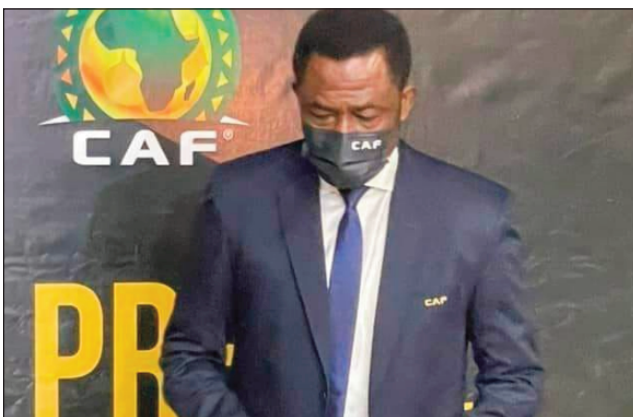
Anisan'ny mpikarakara ny Super League de la Caf.