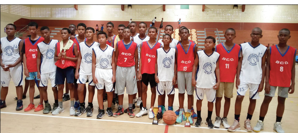
Tompondaka tany Ampisikina Mahajanga.

noi de nouvel an 2022 », nokarakarain'ny sekiônan'ny taranja basikety bao-