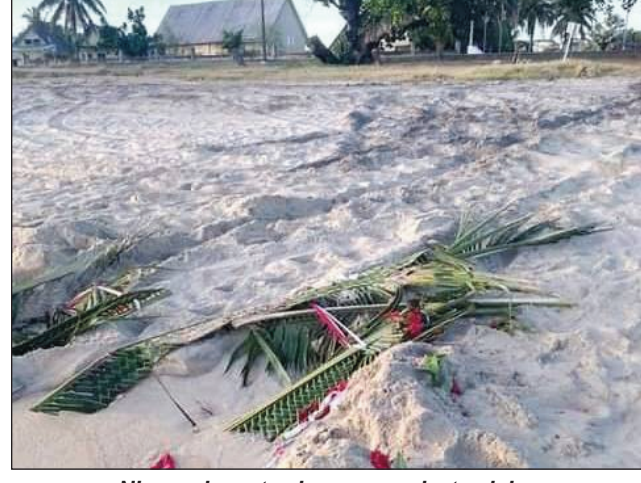
Nisy nadrava toy izao ny ravaka tamin'ny moron-dranomasin'i Sambava.