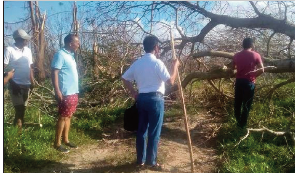
Ireo Tily sy Mpanazava nanadio ny tanànan'i Mananjary araka ny toromariky ny filoha Marc Ravalomanana.