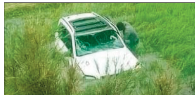
Ilay fiara 4 x4 latsaka tany an-tanimbary.

hany ity 4x4 no nandona ny teo alohany ka nikipily avy hatrany. Nihisaka tamin'ny sisin'ny lakan-drano kosa ilay fiara kely iray voadona. Tsy nisy ny aina nafoy, fa naratra ilay teratany kaomôriana nitondra. Samy nahitana fahasimbana avokoa ireo fiara roa.