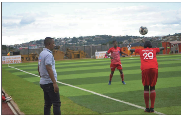
Disiples Fc teny amin'ny By-Pass.

Ary amin'ny fiandohan'ity herinandro diavina ity dia efa mivoaka sahadry ao anaty pejiny ny "Orange Pro League", ny fandaharandalo andro faha-9 amin'io fifaninanana io, ka amin'ny sabotsy 19 febroary 2022 : As Fanalamanga # Jet Kintana (kianja "Stade Barikadimy Stadium Toamasina", Cffa # Zanakala Fc (kianja "Elgeco Plus Stadium By-Pass").