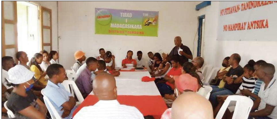
Ny fihonana teo amin'ny Jeune TIM Toamasina ny faran'ny herinandro teo.

Nanatanteraka fihonana ny tanoran'ny antoko Tiako i Madagasikara, na ny Jeune TIM any Toamasina faritra Atsinanana ny faran'ny herinandro teo. Fotoana izay nifanomezan'izy ireo vaovao mahakasika ny raharaham-pirenena amin'izao fotoana, nifampiarahaban'izy ireo ihany koa tratry ny Asaramaniry ny taona vaovao 2022, ny fanetsehana na ny fameloma-maso indray ny antoko, indrindra ny an'ny tanora araka ny toromariky ny filoha mpanorina Marc Ravalomanana. Nisongadina nandritra izany, fa velona sy