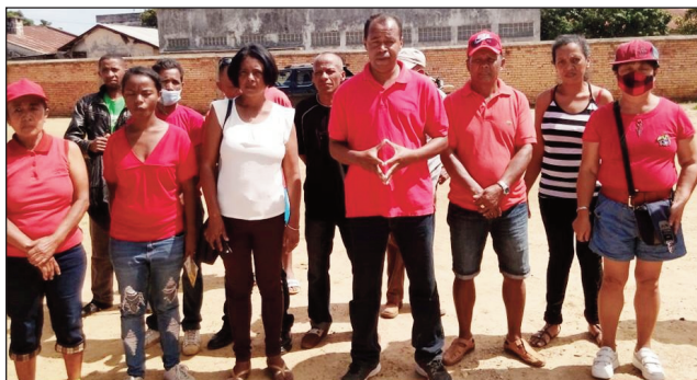
Ny solontenan'ny GTT-RMDM Diaspora La Réunion, nitondra fanampiana ho an'ireo traboina tany Moramanga.

Anisan'ireo distrika nitondra faisana noho ny rivodoza sy ny andro ratsy nandalofa farany teto amintsika dia ny rivodoza Ana sy Batsirai, ny distrikan'i Moramanga any faritra Alaotra Mangoro. Noho izay antony izay, misy ihany koa ireo traboina any an-toerana. Nitondra fanampiana ho azy ireo ny alahady teo ny GTT-RMDM Diaspora La Réunion, na ireo Malagasy monina atsy amin'ny Nosy La Réunion avy amin'ny GTT (Gasy Tia Tanindrazana), sy ny avy amin'ny RMDM (Rodoben'ny Mpanohitra ho