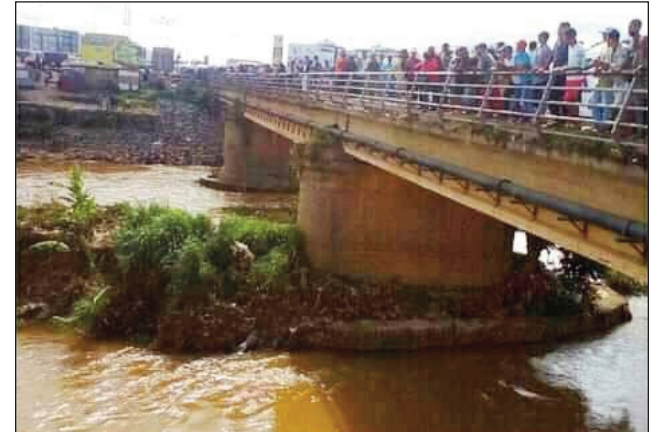
Ny tetezana Anosizato omaly.