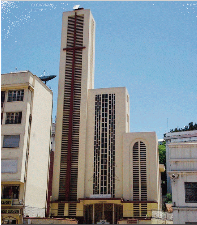
Azo haterina ato amin'ny FJKM Katedraly Analakely ny fanampiana ho an'ireo traboina, avy amin'ny mpino FJKM.

M anodidina ny faha-voazana vokatry ny rivo-doza Batsirai teo iny, dia nanapa-kevitra ry zareo avy amin'ny fiangonana Fjkm, fa hanao tolo-tanana hanampiana ireo traboina sy hitondra am-bavaka hatrany, araka ny vaovaompiangonana naporitaka ny alahady teo. Manentana ireo mpino Kristiana tsy ankanavaka izay afaka manampy ara-bola, na afaka manolotra fitaovana fandrahoana sy fihinanana, na fitaovampitafiana, na lamba firakotra, izany dia azon'ireo mpanolotra haterina any amin'ny fiangonana nandrenesany izany filazana izany, na koa any amin'ny synodam-paritany, nefa azony hatao koa ny manatitra izay foiny eny amin'ny Fjkm Analakely, na ny foibe ihany koa. Tamin'ny filazan-draharaha no nahenoana, fa azo alefa amin'ny alalan'ny finday amin'ireo tompon'andraikitra ny vola