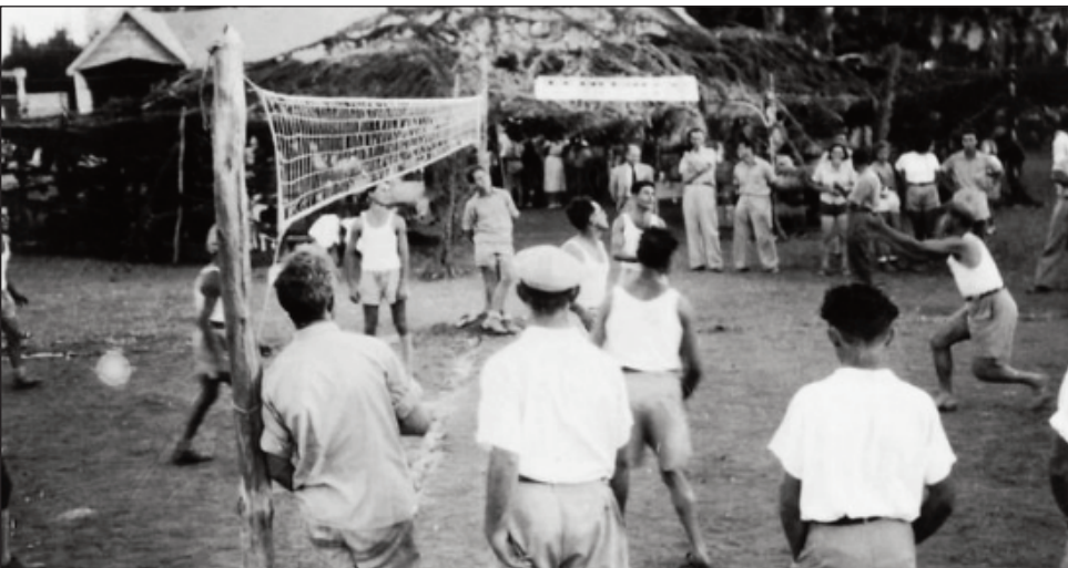
Ny taranja Mintonnette fahiny.