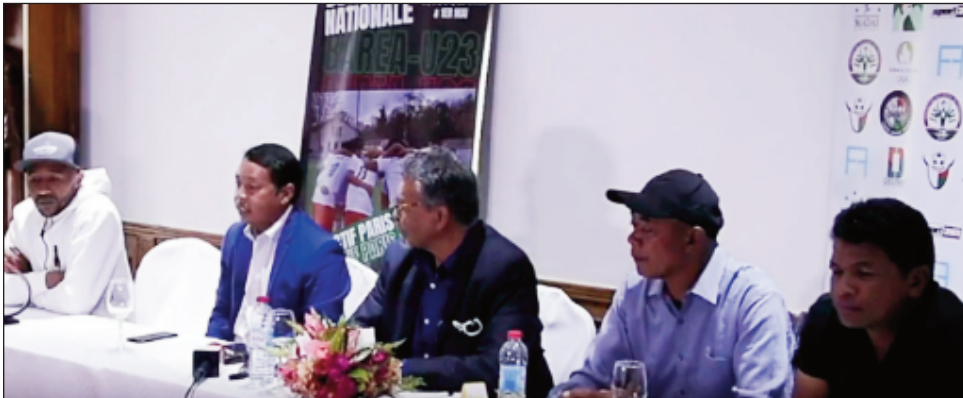
Ufiscam sy Madas teny Anosy.