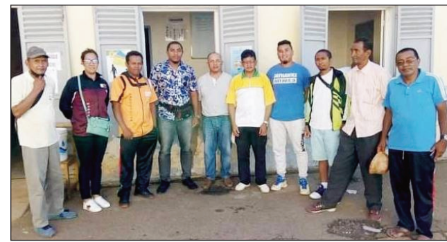
Mpikambana CRA Basketball vaovao any Vakinankaratra.