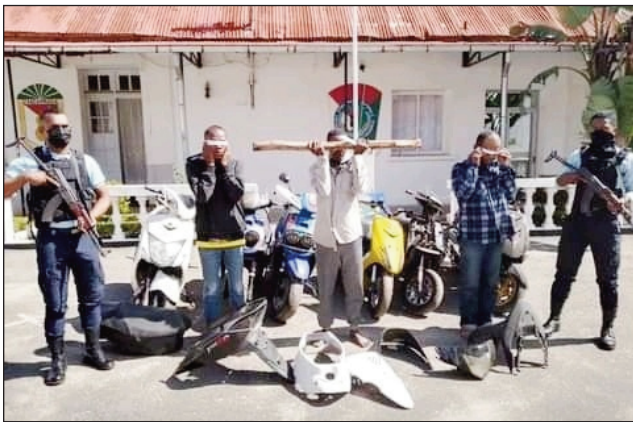
Ireo jiolahy miisa 3 mpangalatra moto sarona.

Tratra ireo jiolahy 3 gaigilahy mpamerin-keloka mpangalatra moto. Efa mampikaikaika ny olon-tsootra mpitaingina kodiara-droa ity raharaha halatra, sy fanendhana ary herisetra manjo azy ireo eto Antananarivo ity. Ary naharaisana fitarainana maro na mivantana na tamin'ny tambazotra hafa. Manoloana izany dia nanao hetsika manokana narahina velapandrika ara-paikady matihanina ny avy ao amin'ny Vondron-tobim-paritry ny Zandarimariam-pirenena Antananarivo-ville nandritra ny 3 andro izay. Loharanom-baovao misandrahaka voamarina teny ifotony, no nahafahana nisambotra jiolahy miisa telo izay efa mpamerin-keloka anatin'io sehatra ratsy io, tany amin'