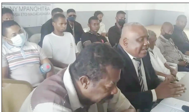
Ny avy amin'ny RMDM, nitafa tamin'ny mpanao gazety tetsy Bel'Air Ampandrana.