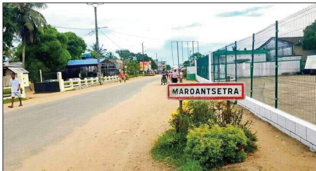
Ny tanànan'i Maroantsetra, renivohitry ny Antimaraoa.

Mangataka ny hanaovana azy ireo ho faritra vaovao: Faritra antsoina hoe Ambatosoa, ny any amin'ny distrikan'i Mananara Avaratra sy ny any amin'ny distrikan'i Maroantsetra, izay ao amin'ny Faritra Analanjirofo amin'izao fotoana araka ny fangatahana ataon'ireo zanak'ny faritra iny ireo. Raha ny distrikan'i Maroantsetra dia misy kaominina miisa 20, kaominina miisa 16 kosa ny ao amin'ny distrikan'i Mananara Avaratra. Arak'izany, hisy kaominina miisa 36 ity Faritra Ambatosoa, izay ho faritra