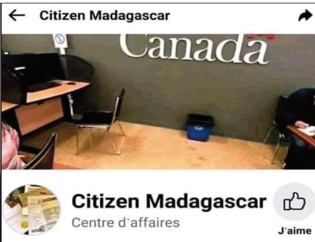
Ilay tovolahy mpisoloky amin'ny FB.

ireo Malagasy te hitady asa any Canada, amin'ny alalan'ny tolotra asa tsy misy akory. Ny Electro Magasin d'usine sy Roda Magasin d'usine. Ireto pejy ireto indray dia fivarotana fahitalavitra sy finday an'habaka (vente en ligne). Rehefa azony amin'ny findainy ny vidiny dia tsy azo antso intsony izy ary tsy tonga any amin'ilay mpi-vidy ny entana novidiana. Ny farany dia ny kaonty