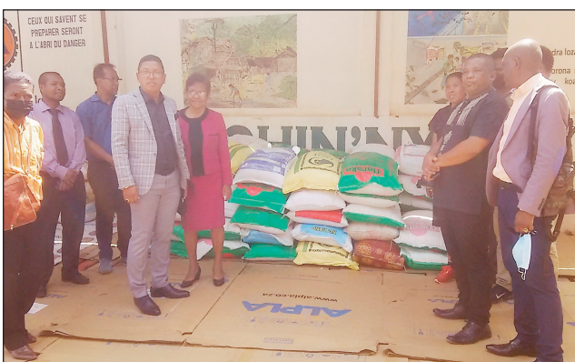
Ireo avy amin'ny fiombonamben'ny fiangonana Evanjelika nanolotra fanampiana ho an'ny traboina.

Nanolotra vary milanja 50 kg miisa 57 gony, na 3 taonina latsaka kely, tamin'ny Bngrc ny fiombonamben'ny fiangonana Evangelika, izay natao tetsy Antanimora ny talata maraina teo, ho fanampiana an'ireo mpiray tanindrazana traboina, nohon'ny fandalovan'ny Rivo-doza « Batsirai » teto Madagasikara ny faran'ny herinandro teo. Nisafidy nanolotra vary ho an'ny mpiray tanindrazana ny fiombonamben'ny fiangonana Evangelika, satria ny sakafo no tena ilaina maika eny anivon'ireny ivon-toerana mampiatrano ireo tra-boina ireny. Vaninan'andro tokony hifanohanana sy hi-