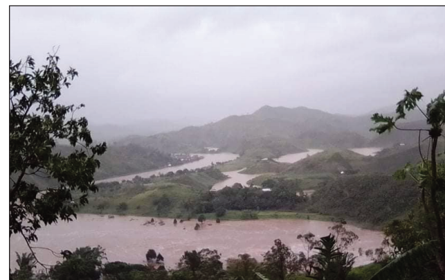
Manelingelina ny fotoam-pianarana ny zava-mitranga mandritra ny fotoam-pahavaratra.