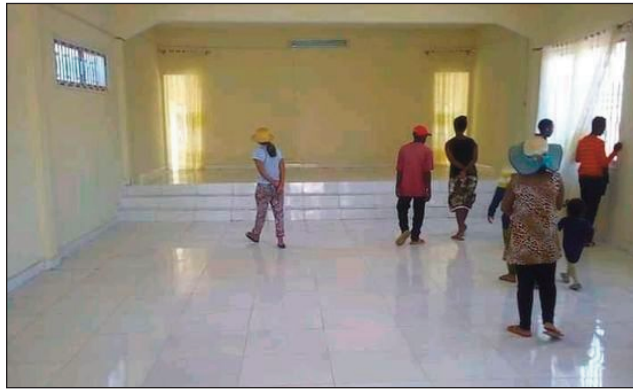
Ny Tranompokonolona Mandrosoa Ivato, nandraisana traboina tany an-toerana.