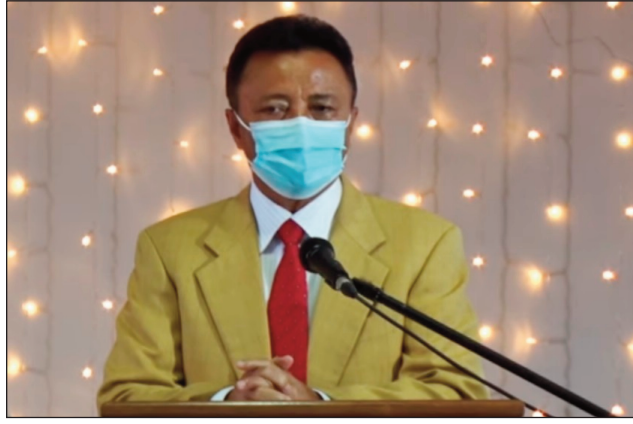
Ny filoha Marc Ravalomanana, filohan'ny RMDM.

Manoloana ny voina mihàtra amin'ny firenena amin'izao fotoana izao, vokatry ny andro ratsy Ana, sy ny rivodoza Batsirai, misy ny fanambarana avy amin'ny filoha Marc Ravalomanana sy ny RMDM, Rodoben'ny Mpanohitra ho an'ny Demokrasia eto Madagasikara: "nandalo fotoan-tsarotra tokoa ny firenena vokatry ny fandalovan'ny rivodoza roa nifanesy dia Ana sy Batsirai. Nisy ireo havantsika izay namoy ny ainy vokatry ireo rivodoza ireo. Amin'ny anaran'ny tenako manokana, sy ireo mpikambana rehetra ato amin'ny RMDM dia miara-ory aminareo fianakaviana sy mitondra ambavaka anareo rehetra hatrany izahay. Miarahaba ihany koa ny Malagasy tsy maty fo aman'aina, satria tena mahery tokoa raha iny rivodoza Batsirai iny. Maro ny faritra no nitondra faisana vokatry izany ary betsaka ny zavatra simba, na ireo fananana iombonana izany na ihany koa ireo fananan'ny fianakaviana tsirairay toy ny trano, ny entana tao antokantrano, ny fambolena sy fiompiana, sns... Mankahery hatrany ny vahoaka Malagasy aho mba tsy ho kivy ary tsy hitanondrika fa hitraka sy hiatrika kosa, ireo fanarenana ny simba. Manao antso avo ihany koa amin'ny fifanomezan-tanana eo amin'ny tsirairay any amin'izay toerana misy anareo tsirairay any. Homba