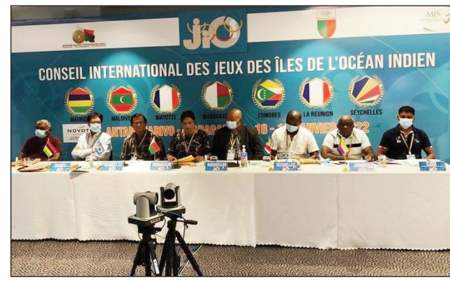
Komity mpanomana ny Jeux des Iles 2023.