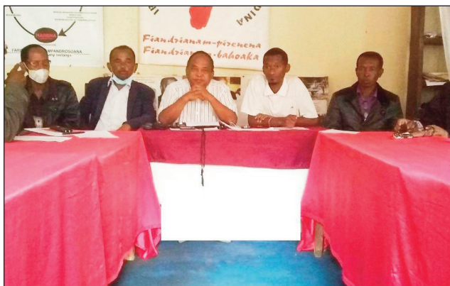
Ny sasany amin'ireo ao amin'ny Hetsika Fanoherana Teleferika.

Mijoro amin'izao fotoana ny Hetsika Fanoherana Teleferika, araka ny fanambarana nataon'izy ireo: "tsy ekenay marindrano ary toherinay ny fanatanterahana ny tetikasa teleferika, izay tsy hamaaha ny fitohanan'ny fifamoivoizana eto Antananarivo, sady tsy ao anatin'ny laharam-pahamehan'ny Firenena velively. Marobe ny Olompirenena, Fikambanana ary Antoko Politika manohana izao hetsika izao", hoy izy ireo. Araka ny fanambarana nataony ihany:" nanao ssonia fifanarahana ny Fanjakana Malagasy sy ny Fanjakana Frantsay, niaraka tamin'ireo Banky Frantsay hanaovana Teleferika eto Antananarivo. Miteti-bidy 151 tapitrisa euros na eo amin'ny 680 lavitrisa Ariary eo izany. Natao mba mahazana ny olan'ny fifamoivoizan'Antananarivo ny tetikasa. Olona 40 000 isan'andro no heveriny handeha amin'izany ary 4000 Ar eo ny sarandalana. Nola-zain'ny Fanjakana fa 14 taona no hamerenana ny vola ary tsy trosa fa mamelontena ilay tetikasa. Rehefa nandinika sy namakafaka izahay dia tsy mahavaha ny fitohanan'ny fifamoivoizana eto Antananarivo io. Ny Gara Andalovany vitsy aza dia tsy misy eny amin'ny toerana maro mponina. Lafo koa ny sarany, ka tsy takatry ny sarambambem-ba-