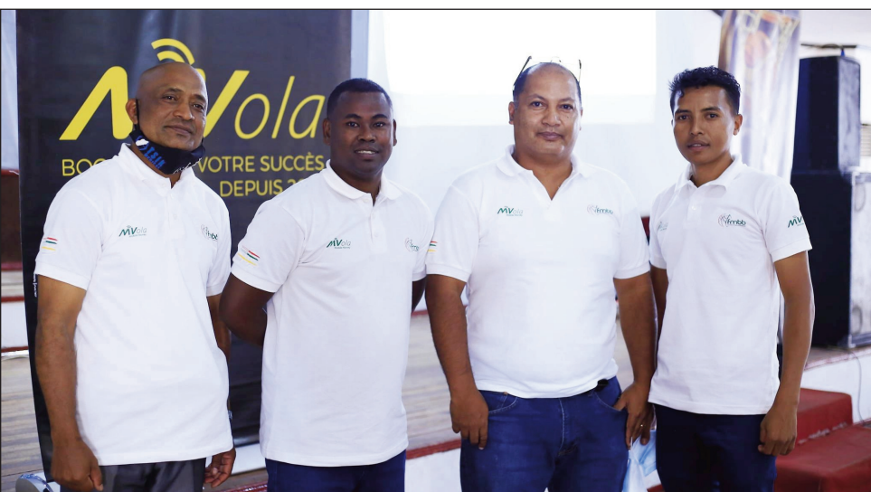
Mpitantana fitsarana lalao basikety Malagasy.