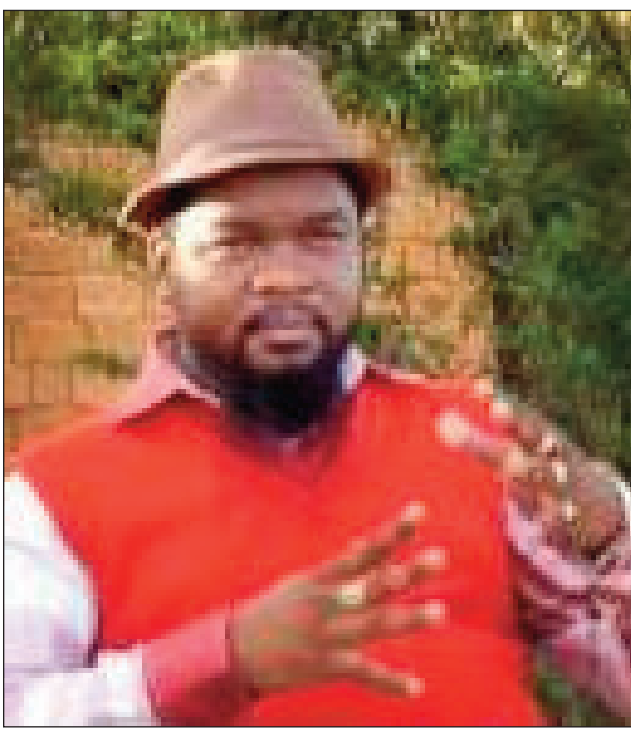
Mr Aina eny ltaosy.

Misy ve ny mosavy, sa efa anjara mihitsy ny tsy hiteraka sy rava fananana foana. Santionany tamin'izany mantsy ity ramatoa 35 taona ity, satria sady rava fananana foana, no tsy nety nahazo zaza mihitsy koa, ka teny ltaosy vao avotra.