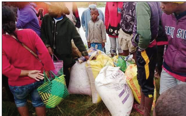
Fanampiana, anisan'ny nentin'ny antoko TIM ho an'ireo traboina.