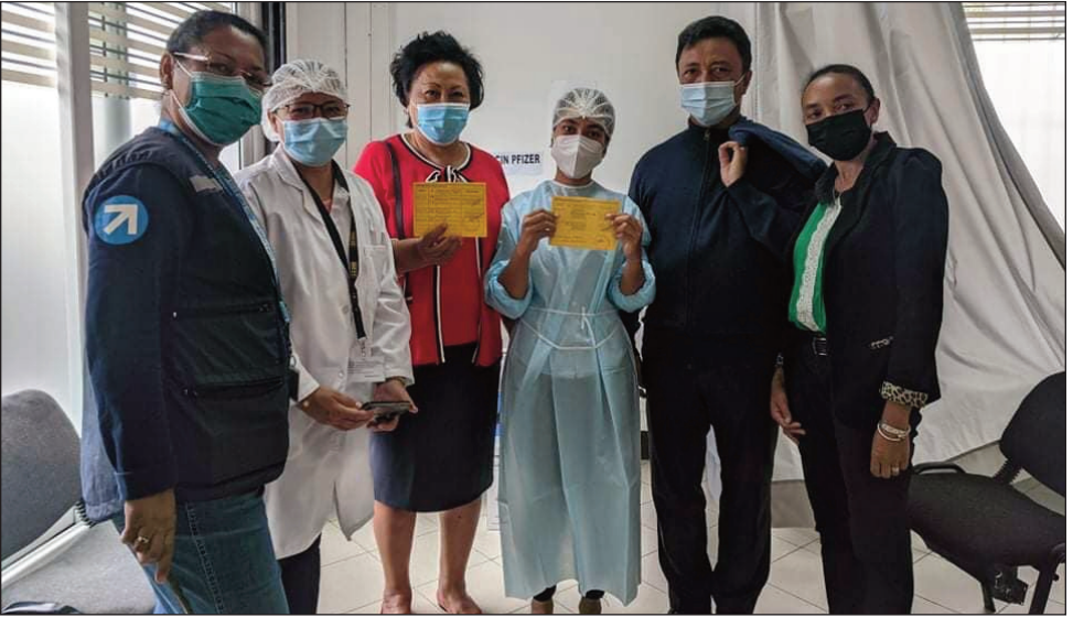
Ny Filoha Marc Ravalomanana mivady, nanao vaksiny fatra faha-3.