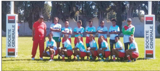
Mpilalao Rugby Malagasy.