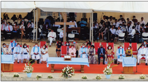
Ny fanompoam-pivavahan'ny FJKM ny alahady teo teny Antsonjombe.

Toy ny fanaony isan-taona, ny Fiangonan'i Jesoa Kristy eto Madagasikara na FJKM, dia manatanteraka fotoam-pivavahana lehibe hatrany amin'ny fiandohan'ny taona toy izao nitondrana am-bavaka ny taom-piasana 2022 sy ny filohan'ny FJKM mianakavy. Ka tamin'ity taona ity dia ny alahady 16 Janoary, no nanatanterahana izany teny amin'ny Coliseum Antsonjombe. Indroa niditra ny fotoana noho ny fitandroana ny fahamailoana ara-pahasalamana, dia ny tamin'ny 7 ora sy sasany maraina sy tamin'ny 10 ora sy sasany. Efa voatsinjara ihany koa ny mpino FJKM niditra tamin'ny fotoana voalohany na ny tamin'ny faharoa. Nipetra-petraka avokoa ny lamina rehetra tamin'ny nahatomombana ny fotoana, ary efa zatra ny amin'ny fandaminana izany ny tomponandraikitra. Efa taona maromaro mantsy izay no nanatanterahan'ny FJKM fanompoam-pivavahana lehibe toy izao teny Antsonjombe. Eo rahateo ny maha fiangonan-dehibe azy. Nikatona avokoa