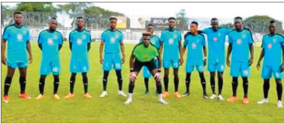
Ny ekipan'ny Cffa Andoharanofotsy.

Taorian'ny andro faha-5 amin'ny fifaninana «Orange Pro League 2021/2022 », izay tontosa tamin'ny sabotsy 15 sy alahady 16 janoary 2022 lasa teo dia mbola mitarika an'isa vonjimaika ny ekipan'ny Fosa Juniors Fc ao amin'ny vondrona «Conférence Nord» manana isa 13 (+7). Ao amin'ny vondrona «Conférence Sud» kosa dia lasa ny Cffa Andoharanofotsy no mitarika an'isa vonjimaika manana isa 9 (+4). Marihana fa ekipa miisa 3 no resy teo an-jaridainany tamin'io andro faha-5 io dia ny ekipan'ny Five FC sy Cosfa ary ny Zanakala