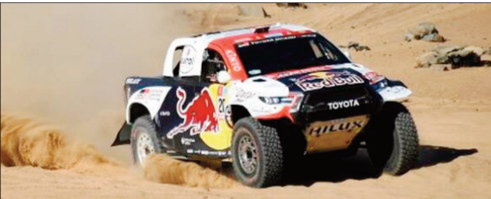
Nasser Al-Attiyah sy Matthieu Baumel.