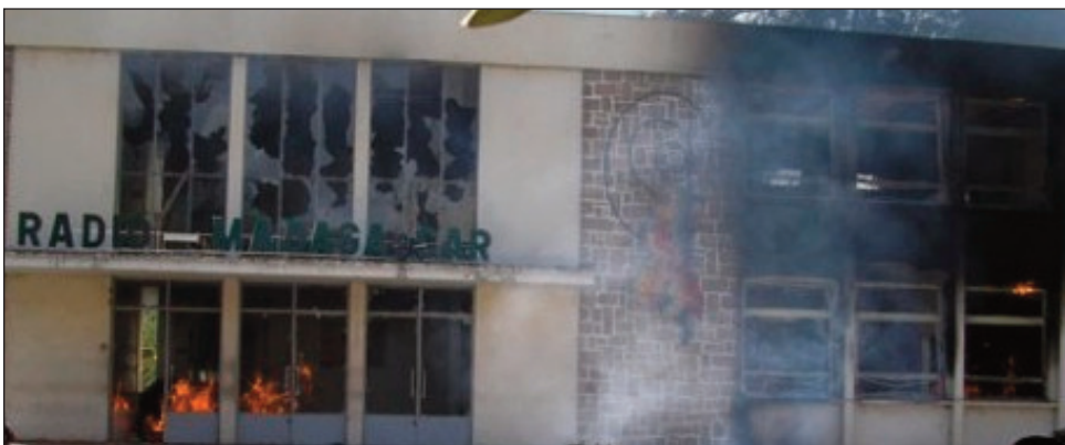
Ny RNM, nodoran'ireo mpanongam-panjakana ny taona 2009.

Misarika ny saina ny fanehoan-kevitry ireo mpamakafaka ny raharaham-pirenena momba ny zava-nitranga tany Andekaleka, sy ny fi-hetsiky ny fitondrana tao anatin'izany, na ny momba ny tsoa-keviny nahatonga ny fahamaizana ny fitaovana, na ny volabe nanambazana izay manome vaovao amin'izany. Fijery iray ihany koa manampy ireny, ny amin'ny fiheverana fa misy indray ny politika fanodinana ny tsaim-bahoaka tsy hibanjina hifantoka amin'ny fahasahiranany sy ny fihanaky ny valanaretina. Efa fanaon'ny fitondrana ihany mantsy izany, izay tsikaritra rehefa misy toedraharaha mafampana eto amin'ny firenena. Anisan'ny maresaka ao anatin'izany ny fitaterana an-tariby « teleferika » ity, ny fidangan'ny vidim-piainana, ny raharaha volamena mibananaka mivoakana eto Madagasikara ary any amin'ny firenen-kafa vao tratra, sns... Izay eo ihany, fa ny tiana horesahana, dia ny filazan'ny Andry Rajoelina, fa mila in'efatra mifanasy amin'ny fe-potoana ia-