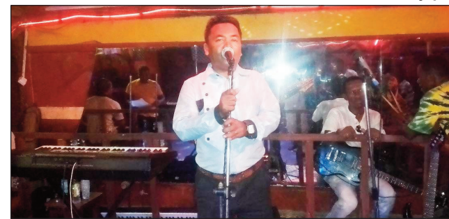
Rija de Morondava filohan'ny Andrahangy Menabe.