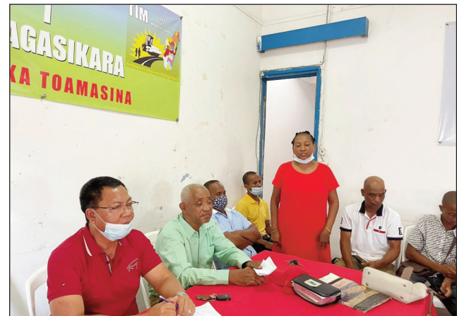
Ireo lohandohan'ny mpisorona amin'ny antoko TIM any Toamasina.