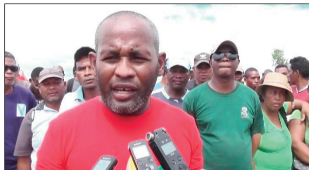
Solontenana mpandrafitra any Menabe.

Nosokafana tamin'ny fomba ofisialy ny alarobia teo, tao amin'ny fokontany Manambly ; kaominina Ampanihy distrikan'i Mahabo, ny fambolenzako amin'ity taona 2022 ity ho an'ny faritra Menabe, ka velaran-tany 30 ha no vita voly, niarahan'ny fitaleavam-paritry ny tontolo iaina sy ny hery velona rehetra ato amin'ny renivohim-paritra Menabe, sy distrikan'i Mahabo anisan'izany ny fikambanan'ny mpandrafitra, izay nilaza fa mbola tsy nivaly ny fangatahana nataon'izy ireo hatreto, ny mba hanomezana azy ireo ny fahazoan-dalana mitrandraka ny hazo, hahafahay miasa an-kalalahana ary ihany koa ny fanomezana azy ireo ; ireo hazo voageja satria izy ireo dia efa manaraka ireo fepetra rehetra apektaky ny ministera ary miara-miasa akaiky amin'ny fitaleavam-paritry ny tontolo iainana ato Menabe, nefa dia toa odianty tsy hita raha tsy rehefa misy ilana azy izy ireo araky ny tafa nifanaovan'izy ireo tamin'ny mpanao gazety tao aorian'ny fambolenzako.