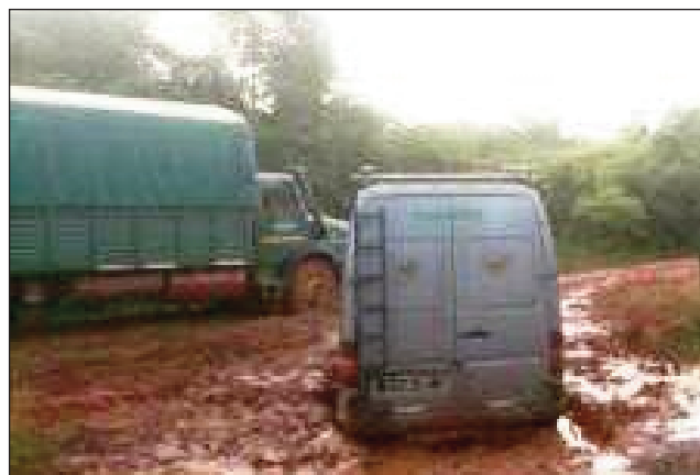
Ny fahasimbanana amin'ny lalam-pirenena faha-32.