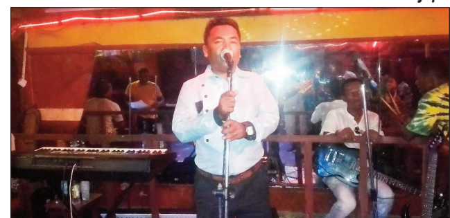
Rija de Morondava filohan'ny Andrahangy Menabe.