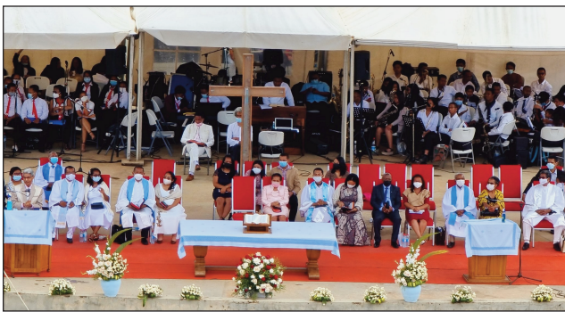
Ny fanompoam-pivavahan'ny FJKM ny alahady teo teny Antsonjombe.

Toy ny fanaony isan-taona, ny Fiangonan'i Jesoa Kristy eto Madagasikara na FJKM, dia manatanteraka fotoam-pivavahana lehibe hatrany amin'ny fiandohan'ny taona toy izao nitondrana am-bavaka ny taom-piasana 2022 sy ny filohan'ny FJKM mianakavy. Ka tamin'ity taona ity dia ny alahady 16 Janoary, no nanatanterahana izany teny amin'ny Coliseum Antsonjombe. Indroa niditra ny fotoana noho ny fitandroana ny fahamailoana ara-pahasalamana, dia ny tamin'ny 7 ora sy sasany maraina sy tamin'ny 10 ora sy sasany. Efa voatsinjara ihany koa ny mpino FJKM niditra tamin'ny fotoana voalohany na ny tamin'ny faharoa. Nipetra-petraka avokoa ny lamina rehetra tamin'ny nahatomombana ny fotoana, ary efa zatra ny amin'ny fandaminana izany ny tomponandraikitra. Efa taona maromaro mantsy izay no nanatanterahan'ny FJKM fanompoam-pivavahana lehibe toy izao teny Antsonjombe. Eo rahateo ny maha fiangonan-dehibe azy. Nikatona avokoa