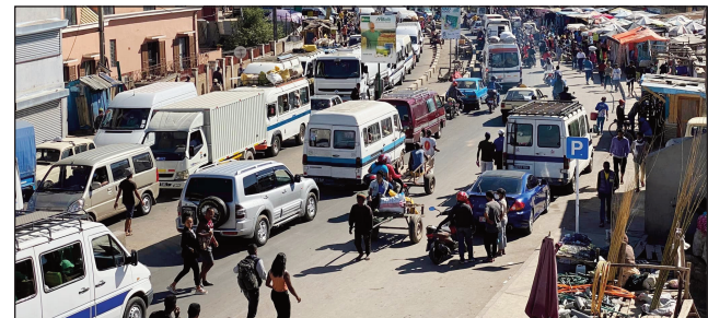
Ny eny Anosizato Atsinanana.