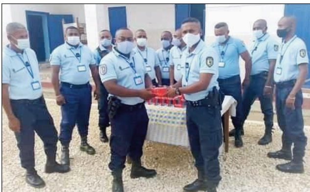
Fanolorana finday ny zandary tany Toliara.

Nomena finday avokoa ireo zandary any Toliara faritra Atsimo Andrefana, hanafainganana ny fifandraisana iadiana amin'ny tsy fandriampahalemana. Anisan'ny antoka iray hanatsarana ny fitandroana ny fandriampahalemana ny fahafainganana ny fifanakalozam-baovao. Izany indrindra no nanosika ny Komandin'ny Vondron-tobim-paritry ny Zandarimaria ao Toliara, nameritrika finday matanjaka ho an'ireo Zana-tobim-paritra rehetra (Postes fixes et mobiles) sy mpiandry kizo