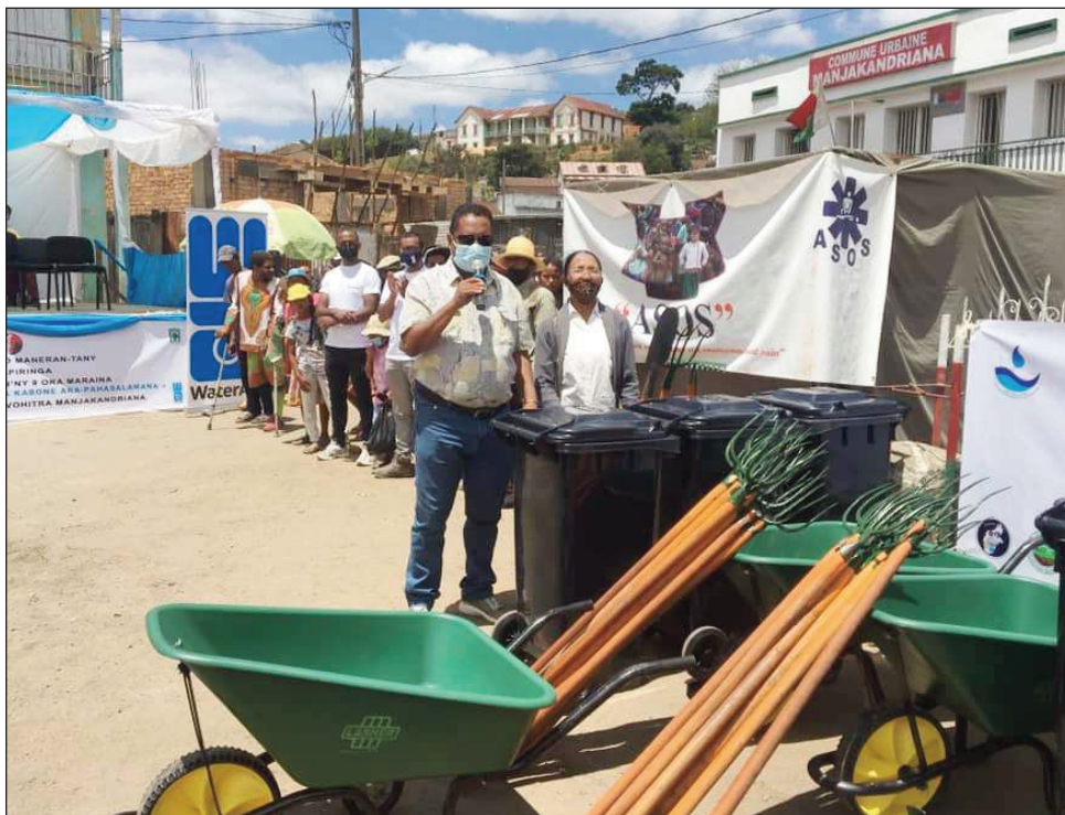
Ny lanonana tany Manjakandriana omaly.