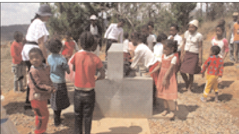
Ny anjaran'ny EPP Isonjo.