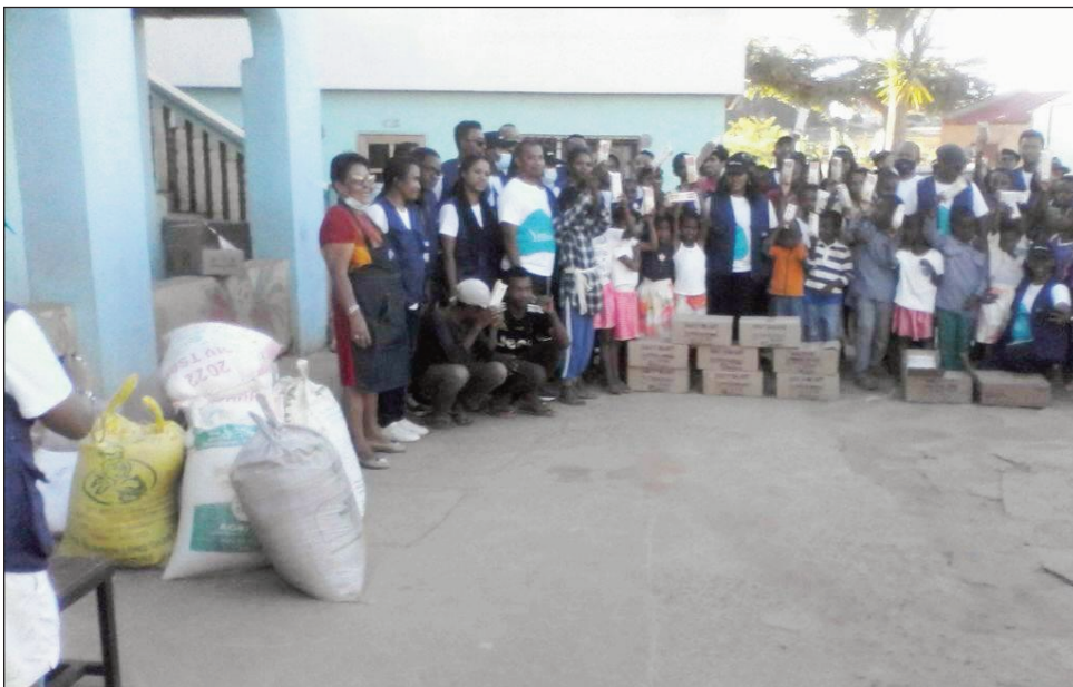
Ny asa an-tsitrapo teny amin'ny Akany Tsimoka Anosy-Avaratra ny sabotsy teo.

Nanatanteraka asa an-tsitrapo ny Akany Tsimoka eny Anosy-Avaratra Antananarivo Avaradrano ny faran'ny herinandro teo. Tamin'ny sabotsy teo ny fotoam-pankalazana ny andro iraisam-pirenena fanaovana asa an-tsitrapo, asa fanasoavana. Marobe ireo fikambanana na vondron'olona nanao izay sitraky ny fony nanampy, nanome fanomezana toy ny hita teny amin'ny Akany Tsimoka Anosy-Avaratra, toerana fitaizana zaza tsy misy mpiahy. Nanolotra akanjo marobe ho entin'ireo ankizy amin'ny Noely sy ny faran'ny taona izao, miampy sakafo maivana amin'ny baoritra maro, izay efa fanomanana ny taom-baovao ihany koa ny teny an-toerana. Fikambanan'ny tanora manao soa: FTMS ireo tonga voalohany teny an-toerana ny sabotsy teo, fikambanana vao niforona teny Tsimbazaza teny, tsy nisalasala ary dia vonona ny hanampy ny akany toy itony tokoa, satria aleo hono mba manosika ny zandry zanaka toy izao, mba ho fitratry ny ho avintsika ihany koa any