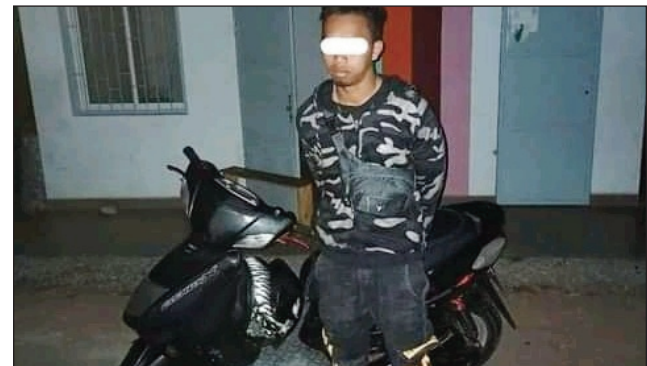
Ilay sakaiza manody nivadika tamin'ny namany.