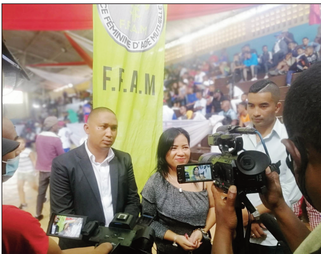
Teny amin'ny kianja mitafon' i Mahamasina ny sabotsy teo.