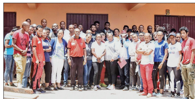
Ireo mpiofana eny Atsimondrano.