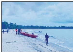
Morontsiraka any amin'ny faritra Analanjirofo.

Fa momba ny loza roa sosa nitranga tany amin'ny faritra Analanjirofo: tany Soanierana Ivongo, sy tany Fenoarivo Atsinanana: tany Mahambo, nataon'ny fitondrana ho andro fisaonam-pirenena anio alakamisy 23 DESAMBRA 2021. Araka ny didim-panjakana laharana faha 2021-1462, manambara fa ny alakamisy 23 desambra 2021 dia andro