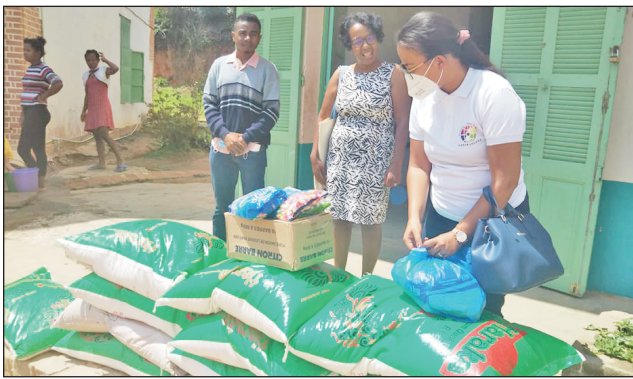
Ny fanolorana fanampiana, teny amin'ny Akany Avoko Ambohidratrimo.