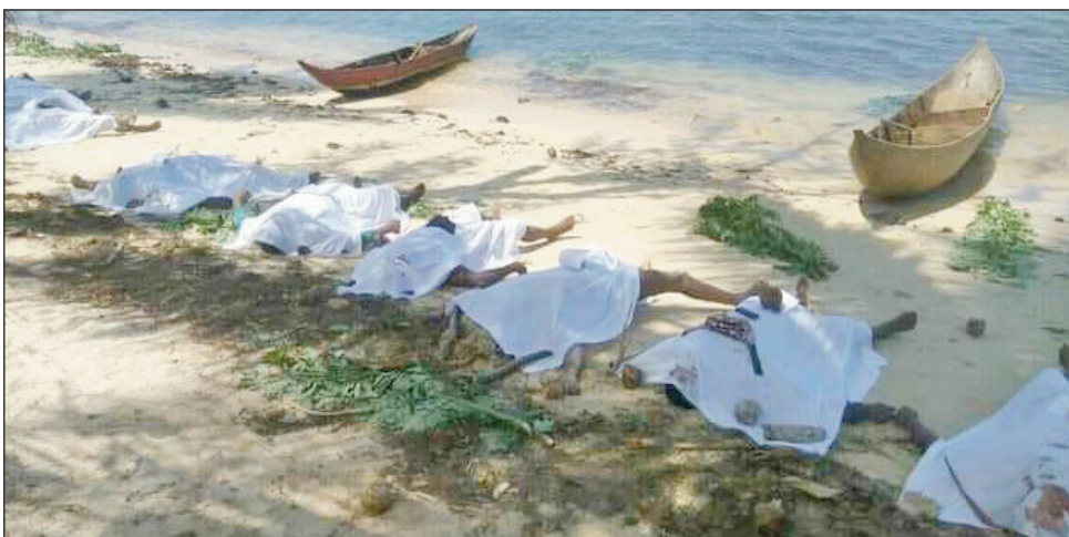
Razana anisan'ny hita omany.

Mbola mitohy hatramin' izao ny fikarohana ireo niharam-boina, tamin'ilay loza an-dranomasina nitranga tany Soanierana Ivongo faritra Analanjirofo ny alatsinainy teo. Mifanjanjona manatanteraka izany ny fokonolona, ireo mpamonjy voina samy hafa, na avy amin'ny foalalindahy izany, na avy amin'ny sehatra hafa. Hatreto araka ny vaovao voaray, manodidina ny 80 eo no namoy ny ainy noho ny faharendrehan'ny sambo Francia. Araka ny tatitra azo tamin'ny tapany marainina omy, tafakatra 114 amin'ireo olona 138 voalaza fa nentin'ilay sambo FRANCIA III, no hita ka tafakatra 50 ireo olona avotra soa amantsara ary 64 kosa no efa tsy misy aina intsony. Mitohy hatrany ny fikarohana, ka