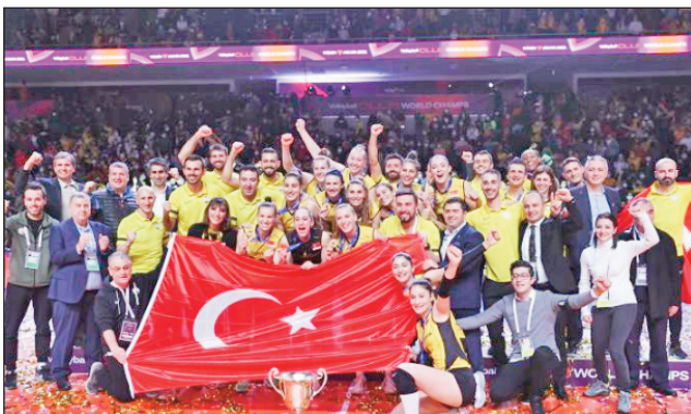
Ny ekipan'ny Vakinfbank Turquie.

Nifarana tamin'ny alahady 19 desambra 2021 teo, tany amin'ny kianja "salle des sports Ankara" any Turquie, ny fifaninanana fiadiana ny ho tompondaka eran-tany eo amin'ny taranja volley-ball isantarika vehivavy, nokarakarain'ny FIVB « Fédération Internationale de Volleyball ». Voahosotra ho tompondaka tamin'izany ny ekipan'ny Vakifbank avy any Turquie rehefa nandavo ny ekipa italiana, izy ireo arak'izany no voahosotra ho "champion du