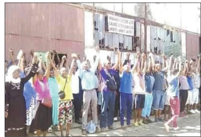
Ireo mpiasan'ny Secren mitaky ny karamany.