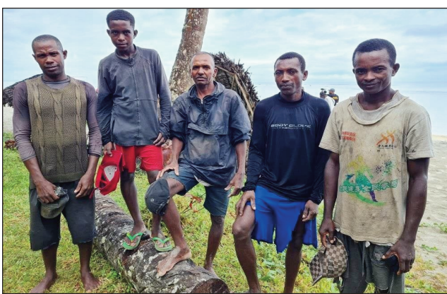
Ireo mpanjono nanavotra ny SEG tany an-dranomasina.

Loza roa no nitranga tany Analanjirofo ny alatsinainy teo, teo ny faharendrahan'ny sambo Francia tany Soanierana Ivongo, ny ministeran'ny fitate-rana no tompon'andraikitra voalohany ny amin'izany. Efa sambo tsy nanao dalàna, ahoana no tsy nisaterana ny tao amin'ny fitaterana sy ny mpitandrodra filaminana miaramiasa amin'izy ireo ity sambo ity, tsy voalohany no nisy loza an-dranomasina toy izao tao amin'ny faritry ny Ranomasimbe Indiana, anelanelan'ny Tanibe Madagasikara sy ny Nosy Sainte-Marie iny. Ny loza faharoa dia ny fianjeran'ny helikôptera niondrona ny Sekreterampanjakana amin'ny Zandarimariam-pirenena, helikôpteran'ny foloalindahy no nitondra azy ireo. Ny ministeran'ny fiarovam-pirenena no tompon'andraikitra voalohany ny amin'izany. Ny angidimby