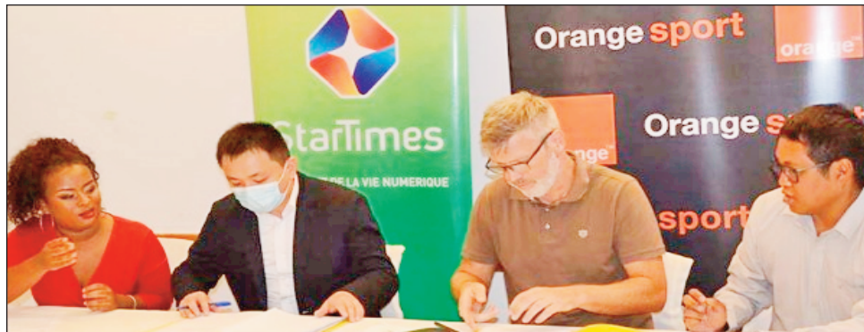
Fifanarahana teny Ankorondrano.