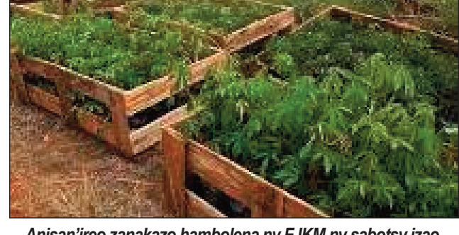
Anisan'ireo zanakazo hambolena ny FJKM ny sabotsy izao.