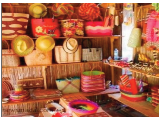
Anisan'ireo asa tanana hita any Menabe.

T sy nisy mpiahy sy mpijery loatra ny asa tanana sy haitao tany amin'ny faritra Menabe, nandrit'izay taona maro izay satria dia tsy misy na dia mpiasa iray aza tao amin'ny sampan-draharaha'ny asa tanana sy haitao, fa dia natolotra novimbinin'ny ministeran'ny indostria sy ny varotra ary ny fanjifana hatrany.