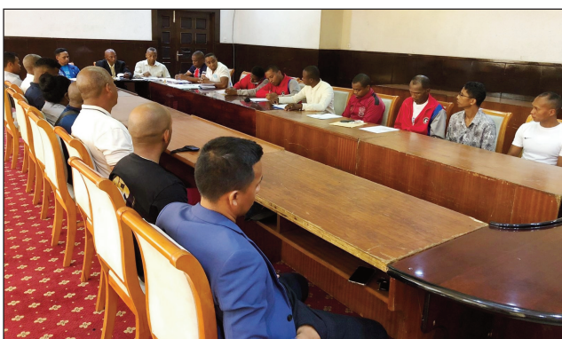
Teny amin'ny Lapan'ny fanatanjahantena Mahamasina.