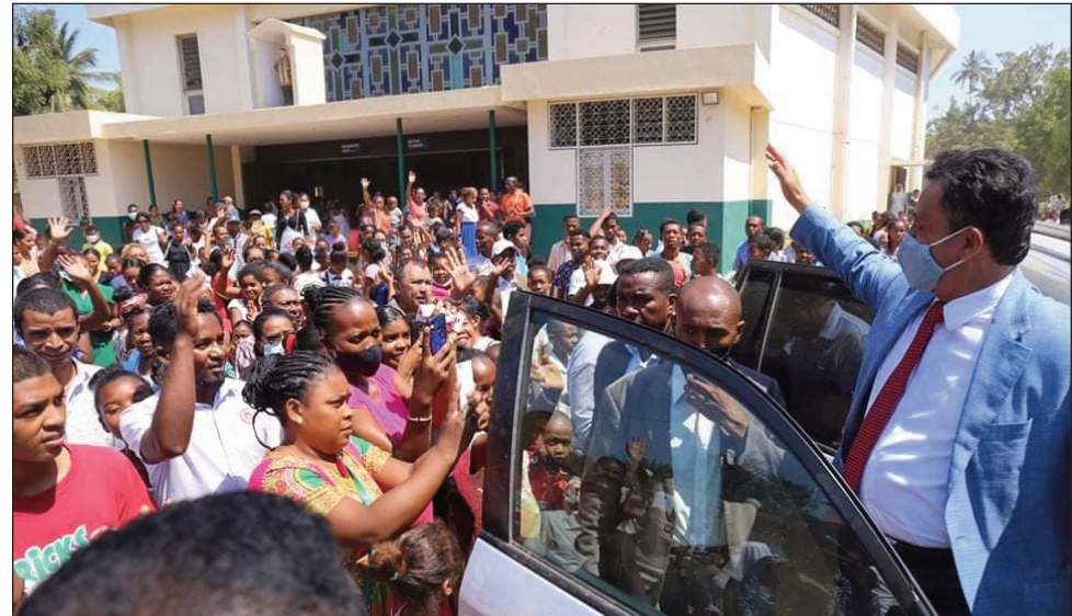
Ny fisakanan'ireo mpitandro filaminana ny vahoaka tsy ho ao amin'ny Magro Andaboly.