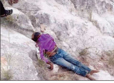
Ilay lehilahy nitondra moto, maty nisy namono.

Faritra tsy milamina ny any Kiranomena any amin'ny faritra Bongolava iny. Toerana ahitana fanafihan-jiolahy mitam-piadiana ihany koa. Lehilahy iray tokony ho 50 taona nandeha moto, no hita faty novonoin'olona omaly alatsinainy 13 desambra 2021. Raha izy an-dàlana hamonjy fodiana any Kiranomena iny, teo amin'ny toerana atao hoe Amparihimanga, 3 km tsy hidirana an'i Kiranomena, no no-taperin'ireo tsy mataho-tody ny ain'ity