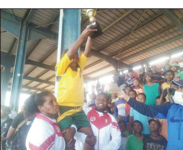
Ny Scb Besarety nandray ny amboara maha-tompon-daka.

Fararanon-danonana rugby tokoa ny teny amin'ny kianja Makis Andohatapanaka tamin'ny alahady 12 desambra 2021 lasa teo. Fifaninana federaly 2 sy Top 5 vehivavy ary Doppel Top 20, no indray narahina nisesy tamin'izany ka nahazoana ny vokatra : Top 5 Dames 1. Champion : SC Besarety (SCB 40-21 3FB) 2. Vice-champion : 3FB. 3. 3e place : FTM Manjakaray. Féderál 2 masculin