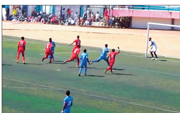
Lalao Orange Pro League 2021.