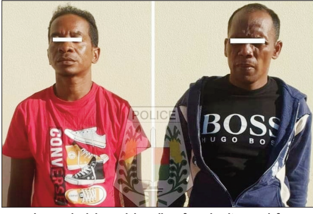
Ireo mpisoloky roalahy milaza fa mahavita mandefa olona hiasa any Seychelles.

Ho an'ireo liana hiasa atsy amin'ny Nosy Seychelles, olona miisa 100 mahery no voasolokin'ireo mpisoloky roalahy teto an-drenivohitra. Nanaparitaka peta-drindrina tamina faritra maro teto an-drenivohitra izy roalahy milaza fa misy asa any Seychelles ary mikarama 400 euros isam-bolana ny olona iray, no sady iantohana ny trano sy ny sakafo. Nasiona laharana finday ihany koa ho an'izay liana sy hanao ilay asa.