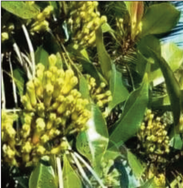
Vokatra jirofo eny am-potony any amin'ny faritra Analanjirofo.