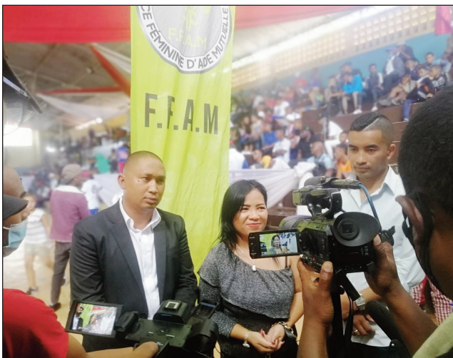
Teny amin'ny kianja mitafon' i Mahamasina ny sabotsy teo.